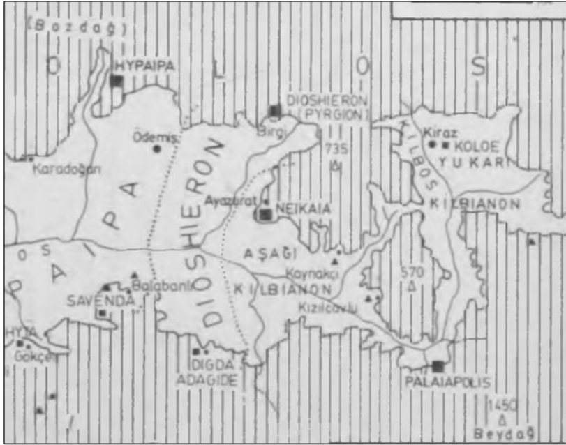
Harita-1: Küçük Menderes Bölgesi'nin Antik Dönemdeki Doğu Kısımlarını Gösterir Harita (Bkz. Meriç, 1988: 204)

yine Küçük Menderes Nehri'ne bağlı kalmak suretiyle yapılan adlandırmalardan daha fazla etkilenmiştir. Bu süreç içerisinde “Kilbos” olarak adlandırılan Kadın Deresi; Coloe (Kiraz), Palaiapolis (Beydağ) ve Neikaia (Ayasuret) merkezlerinin bulunduğu arazinin, “Kilbianon” bölgesi olarak tanımlanmasına zemin hazırlamıştır. 18 Coloe ve Palaiapolis “Yukarı Kilbianon” olarak adlandırılırken Neikaia ise “Aşağı Kilbianon” adını almıştır (Bkz. Harita-1). 19