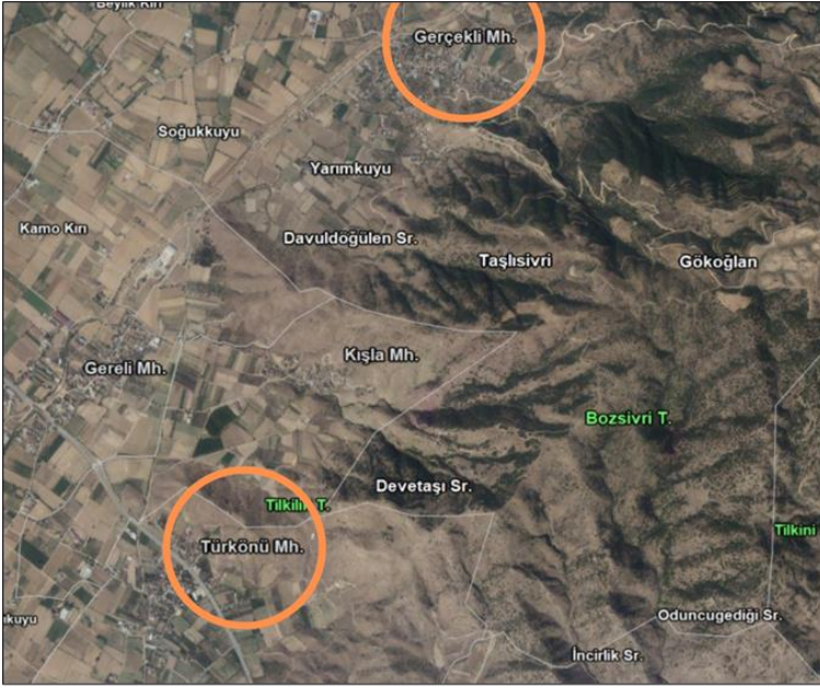
Harita-2: Günümüzde Ödemiş İlçesi'ne Bağlı Olan Gerçekli ve Türkönü (Ayasuret) Mahallelerinin Topoğrafyasını Gösterir Harita

Gerçekli ve Ayasuret karyeleri hususunda, XIX. yüzyılın ikinci yarısından itibaren yayımlanan Aydın Vilâyet Sâlnâmelerinden de birtakım bilgiler edinmek mümkündür. Her iki karye hakkında da akla ilk gelebilecek olan bilgi, belirtilen bölgede yaşayan nüfus varlığıdır. Sâlnâmeler içerisinde nüfus hakkında en detaylı bilgiyi veren R.1307/M.1891 Tarihli Aydın Vilâyet Sâlnâmesi; Gerçekli'de 43 binanın bulunduğunu ve 276 kişinin yaşadığını Ayasuret'te de 47 binanın bulunduğunu ve 253 kişinin yaşadığını kaydetmektedir. 36 Bahsedilen karyelerin Birgi Nahiyesi 37 ile Ödemiş Kaza merkezine olan uzakları, sâlnâmelerden edinilen bir diğer bilgidir. Buna göre; Gerçekli Karyesi, Birgi'ye 30 dakika ve Ödemiş'e 1 saat mesafede bulunurken; Ayasuret Karyesi de Birgi'ye 1 saat ve Ödemiş'e de 1 saat 20 dakika uzaklıktadır. 38 Sâlnâmelerde Aydın Vilâyeti dâhilinde icra edilen eğitim-öğretim