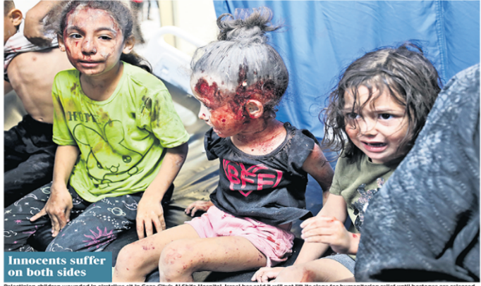
Innocents suffer on both sides

The violence, the most concentrated bout of killings of civilians since the founding of the state of Israel, has prompted calls for calm from the West to prevent an escalating war from spilling out across the Middle East. Blinken said yesterday that while