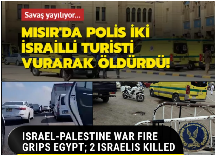
Görsel 1. Mısır’daki Polislerle ilgili İddiaya Dair Haber Görselleri