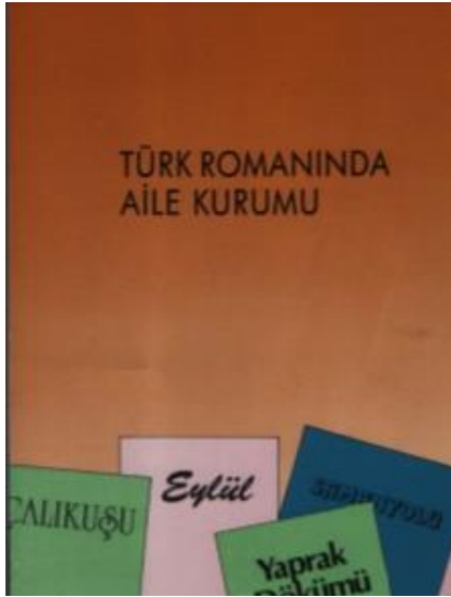
Görsel 1: Türk Romanında Aile Kurumu (Esen, 1991)

Türk Romanında Aile adlı bir çalışmada 1870-1970 yılları arasında yayınlanan 50 civarında Türk romanının değerlendirilmesi yapılmış; bu romanlarda işlenen 96 aileye mercek tutulmuştur. Bu ailelerden 43’ü konak, köşk veya yalıda oturan üst düzey aileler olarak dikkati çekiyor. Baskın çoğunluğu çekirdek aile, çocuk sayısı az, 11 ailenin çocuğu yok. 45 aile tek çocuklu, 25 ailenin 2, 10 ailenin 3, 5 ailenin ise 4 ya da çok çocuğu bulunuyor. İki nesil birlikte yaşarken 16 ailede ise 3 nesil bir arada. Ataerkil aileler çoğunluk olmakla birlikte 96 ailenin 25’inde aile reisi kadınlardır (Esen, 1991, s. 210).