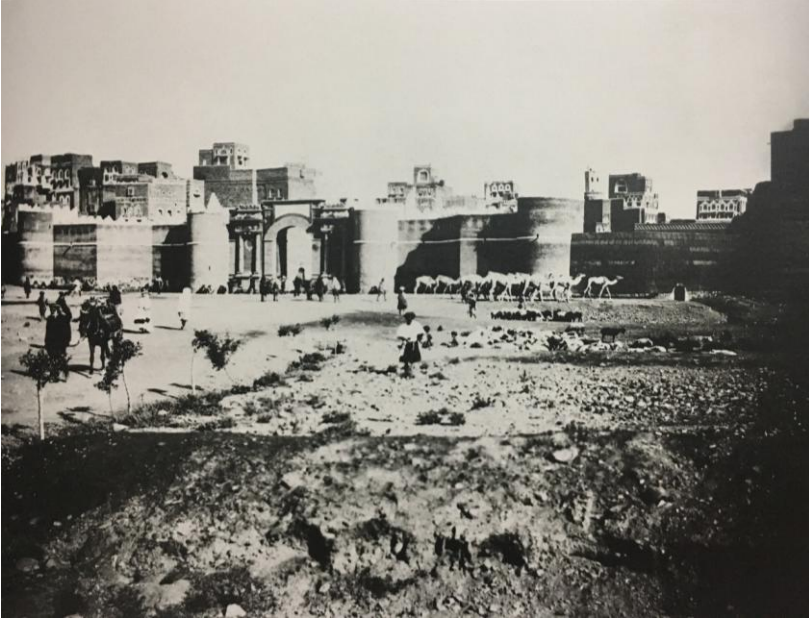
San'a, Yemen Kapısı 121