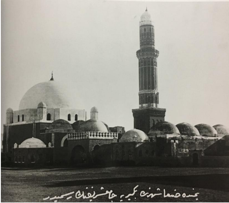
San'a Bekiriye Camii 120