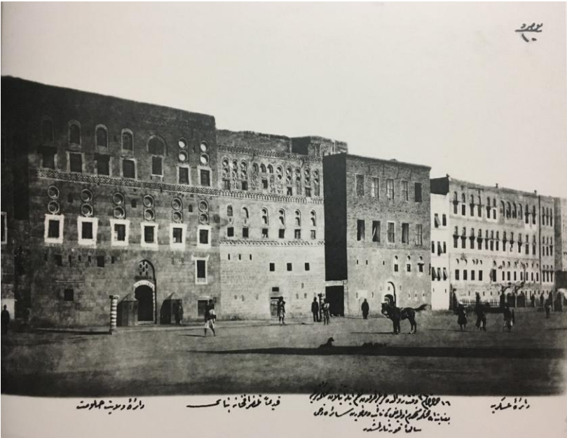
San'a resmî binalar; hükümet konağı, telgrafhane, mahkeme, askeriye 122