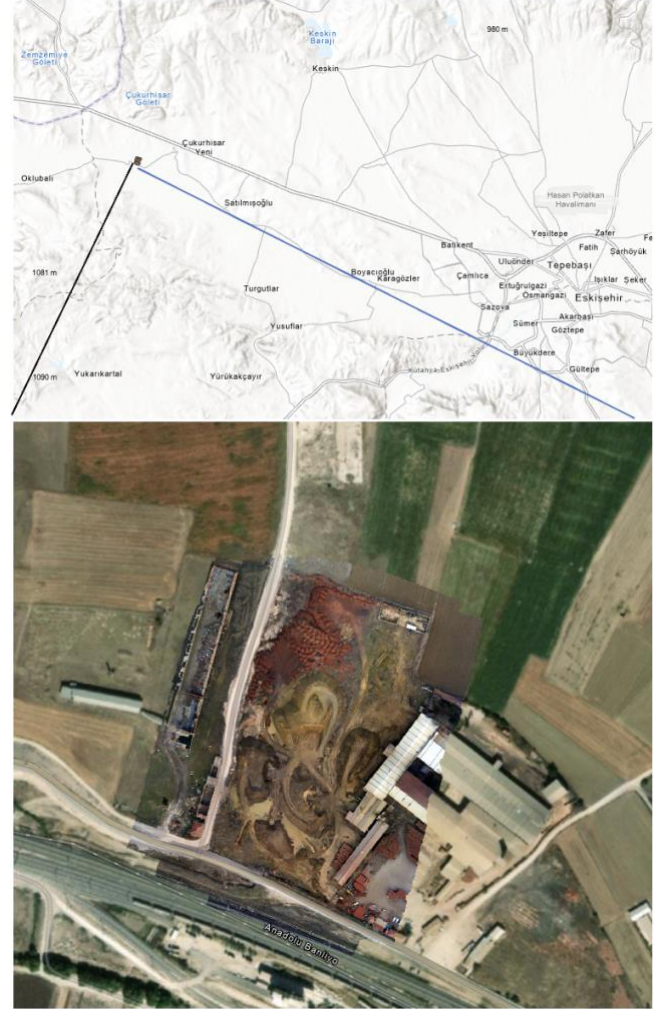
Şekil 1. Çalışma alanı

gerçekleştirilmiştir. Ölçüm ekipmanının özellikleri, arazi kullanımı, Yer Örnekleme Aralığının (GSD) hedef boyutu, görüntülerin planlanan yatay ve dikey bindirmeleri dikkate alınmıştır.