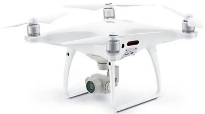
Şekil 2. DJI Phantom 4 Pro cihazı

Yer kontrol noktaları ve kontrol noktalarından oluşan çalışma bölgesinde homojen dağılımlı olarak ağ kurulmuştur. Koordinatlar, sürekli çalışan referans istasyonları ağı (CORS) kullanılarak GNSS gerçek zamanlı ağı (RTK) yöntemiyle her seferinde ölçülmüştür (Şekil 3). 2 cm yatay doğruluk ve 3 cm