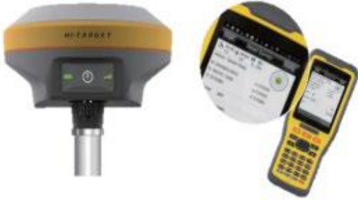
Şekil 3. GNSS alıcısı.

dikey doğrulukla sabit noktaların ölçümleri yapılmıştır.