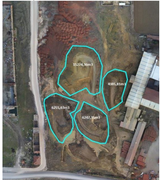
Şekil 6. Çalışma Alanı Ortofoto ve DEM Verisinden Hacim Hesabı

Son olarak, buluttaki görüntülere gerçek bir koordinat sistemi atanarak coğrafi referanslama (Şekil 6) yapılır. Yazılım, projeyi gerçek koordinatlarla dünya üzerinde konumlandırır. Daha sonra dijital yükseklik modelleri (DEM) oluşturulmuştur. Bunlar, görüntülerin ortomozaikler gerçekleştirmek ve ortomozaikler oluşturmak için bir temel olarak kullanılmıştır. Bu sonuçta projeye ölçek ve yönlendirme sağlar ve üretilecek model üzerinde farklı ölçümler yapılmasına olanak tanır. Proje daha sonra yeniden eşleştirilir ve optimize edilir. Bilinen stok yığınının hacmini hesaplamak için yeni hacim seçeneğine tıklayın. Ardından stok yığınını seçin ve ölçümleri güncelleme seçeneğine tıklayarak Pix4D yazılımının stok hacmini hesaplaması sağlanır (Şekil 6). Hesaplanan hacim 32163.15m 3 olarak belirlenmiştir.