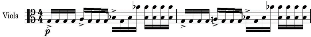
Şekil 5. II. Bölüm, Ölçü 71-73

Bu tema sonuna kadar solist – eşlik şeklinde devam etmektedir. 72. Ölçüde Gelişme bölümü başlar. Solo viyola p nüansı ile tekrar onaltılıklarla harekete başlar ve 1. tema gelişmede Sol tonuna geçilir.