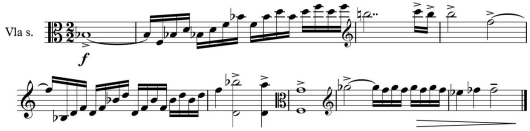
Şekil 4. II. Bölüm, Ölçü 26-35

Orkestrada soliste yaylılar grubu ve piyano eşlik etmektedir. İkili divisilere bölünmüş yaylılar pizzicatolarla dörtlük uzunluklarla tekrar edilen Si Bemol majör-minör akorlarıyla girmekte ve aynı akorlar bir sonraki, 27. Ölçüde sekizliklerle piyano da tekrar edilmektedir.