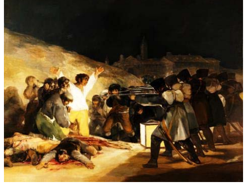
Fotoğraf, 4. Francisco Goya, The Third of May, 1808 in Madrid , 1808, 1814-15, oil on canvas, 8' 9" x 13' 4" (Museo del Prado, Madrid)