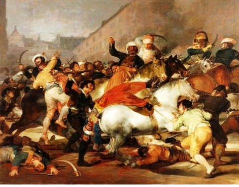
Fotoğraf, 3. Francisco Goya, The Second of May 1808 , 1814, oil on canvas, 104.7 x 135.8 in. (Museo del Prado)