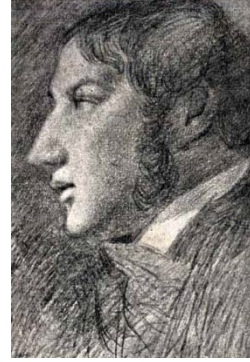
Fotoğraf, 2. John Constable (1776-1837) Self-portrait 1806, pencil on paper, Tate Gallery, London.