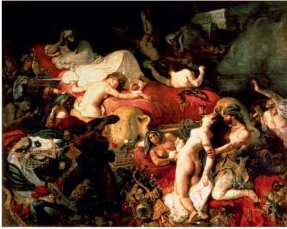
Fotoğraf, 5. Delacroix, The Death of Sardanapalus, 1827 (oil on canvas), / Louvre, Paris, France.

özgürlüğe kavuşturacakları şeklinde karşılaşmışlardı. Ama kısa bir süre sonra bütün İspanya halkına düşman oldular. Goya, İspanya halkının birçok değerinin yıllarca yok olmasına başından beri şahit oldu. Fransız askerlerinin İki Mayıs katliamını, gerçekliğin ötesine geçerek muazzam bir şekilde tuvale aktarırken, yardıma muhtaç insanların çocuksu hareketlerle karşı koymalarına, askerlerin bütün vahşetini nasıl sürdürdüğünü anlatır. (Wight, 1954: Commentary for color plate 19) Goya, geleneksel resim alışkanlığını yalnızca portre ressamı olarak yapmamış, Rembrandt gibi birçok asit oyma resimler de yapmıştır. Bu resimler çizgisel biçimde olmayıp, gölgeli bölgelerin açığa çıktığı leke baskı olarak adlandırılan, o döneme göre yeni bir teknik kullanmıştır. Goya, tarihsel olayları ve günlük yaşamdan betimlemeler yapmayarak, gizemli karartılar ve büyücü kadınların hayali görüntülerini imgeleştirerek diğer resimcilerden farklı bir tutum benimsemiştir. (Gombrich, 1992: 384). Klasizm ve aydınlanma fikirlerine duyulan tepkiyi ifade eden Romantizm, 18.yy.'da Avrupa'da heyecan ve özgürlük tutkularını dile getirerek, özellikle Fransa ve İspanya'da ulusal bir akım olarak anılması romantik sanatçının, soyluların, sarayın koruyucu elini çekmesi ile birlikte Fransız devriminin özgürlükçü düşüncesinde önemli rol oynamıştır.