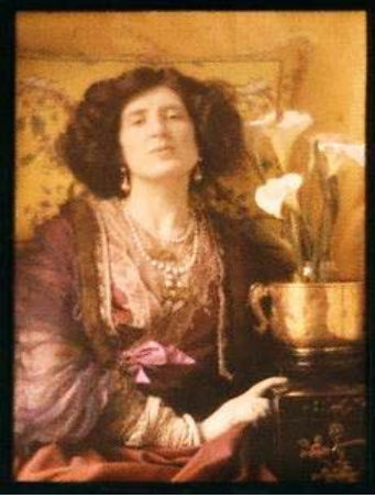
R. 10. B. De Meyer.1907.

kullandı. Kendi geliştirdiği ışıklandırma yöntemleriyle romantik fotoğraflar elde etti. De Meyer 1913-1940 döneminde önce Vogue ile daha sonra, Harper's Bazaar'da ünlülerin fotoğrafçısı olarak çalıştı. Önemli portre fotoğrafçılarından biri de, Mardin doğumlu Kanada vatandaşı fotoğrafçı Yousuf Karsh'tır. (1908–2002). (Fotoğraf, 11) Karsh, On altı yaşında Kanada'da Sherbrooke kentinde fotoğrafçılık yapan dayısının yanına gitti. 1928-1931 döneminde Boston'da bir portre fotoğrafçısının yanında çalıştı. 1932'de Kanada'ya döndü ve Ottawa'da kendi stüdyosunu açtı. 1960'ların başında Karsh'ın çağın önemli kişiliklerinin portre ağırlıklı çalışmalarında Low-key-high-key ışık yöntemiyle çoklu ışık sistemiyle romantik çağrışımlar yapan portreler çekmesi onu portre fotoğrafçılığında dünyada ön plana çıkarmıştır. Bu anlamda başarılı çalışmalarından dolayı Kanada hükümeti, 1935'te onu portre fotoğrafçısı olarak görevlendirdi.