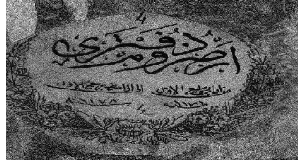
Defterinin Kapağındaki Künye Bilgileri (Kaynak: (A. DVNSAHK. ER. d004).