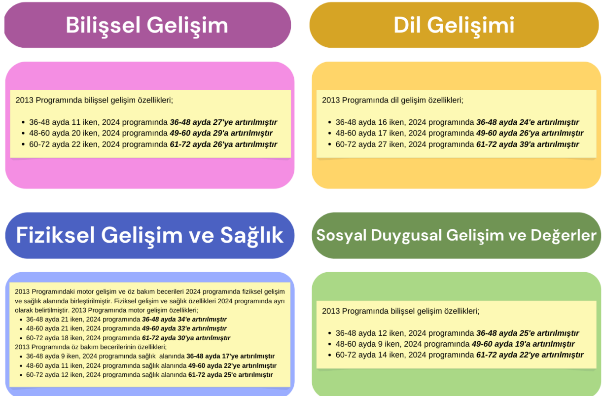
Şekil 1. 2024 Okul Öncesi Eğitim Programının Gelişim Alanları ve Gelişim Özelliklerine İlişkin Bulgular

2013 Programı içeriğinde gelişim alanları bilişsel, dil, sosyal ve duygusal, motor ve öz bakım olarak sıralanırken; 2024 programında gelişim alanları bilişsel, dil, fiziksel gelişim ve