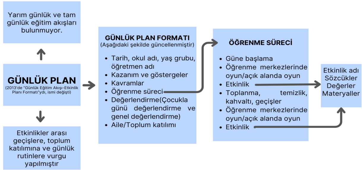
Şekil 3. 2024 Okul Öncesi Eğitim Programının Günlük Plan Formatına İlişkin Bulgular

Günlük plan formatının ilk bakışta uygulayıcılara karmaşık gelebileceği göz önüne alınarak Şekil 3 oluşturulmuş ve uygulayıcılara yol gösterici olması hedeflenmiştir. 2013 Programındaki "Günlük eğitim akışı-Etkinlik planı formatı", 2024 programında "Günlük Plan" olarak ismi değiştirilmiş; 2013 programında planın ilk sayfasında yer alan "etkinlik çeşiti" ve "uygulama şekli" 2024 programında öğrenme sürecinin içerisine eklenmiştir. 2024 programı günlük plan formatına okulun adı ve öğretmenin adı soyadı eklenmiştir. 2024 programında günlük eğitim akışlarına yer verilmemiş ve öğrenme sürecinde yer alan etkinlik kısmına "Değerler" sütunu eklenmiştir. 2024 programında günlük plan formatında etkinlikler arası geçişler, toplum katılımı, günlük rutinler ve açık alanda oyun öne çıkarılmış, rutin etkinliklerin tanımı ve bileşenleri açıklanmış, günlük plan hazırlanırken gelişime uygun uygulamaların düzenlenmesi gerektiği belirtilmiştir. 2013 programı eğitim akışındaki "Oyun zamanı" yerine 2024 programında günlük plan öğrenme sürecine "öğrenme merkezlerinde oyun/açık alanda