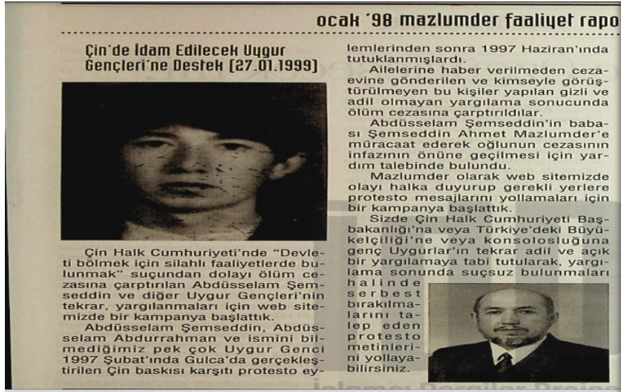
Resim 2. Faaliyet Raporu'nda Uygur Gençlerine Destek Çağrısı

yapılan protestolar ve etkinlikler aktarılmış, Çin hükümetinin Uygurlara karşı soykırım işlediği belirtilmiştir (2009: 17, 2012: 15).