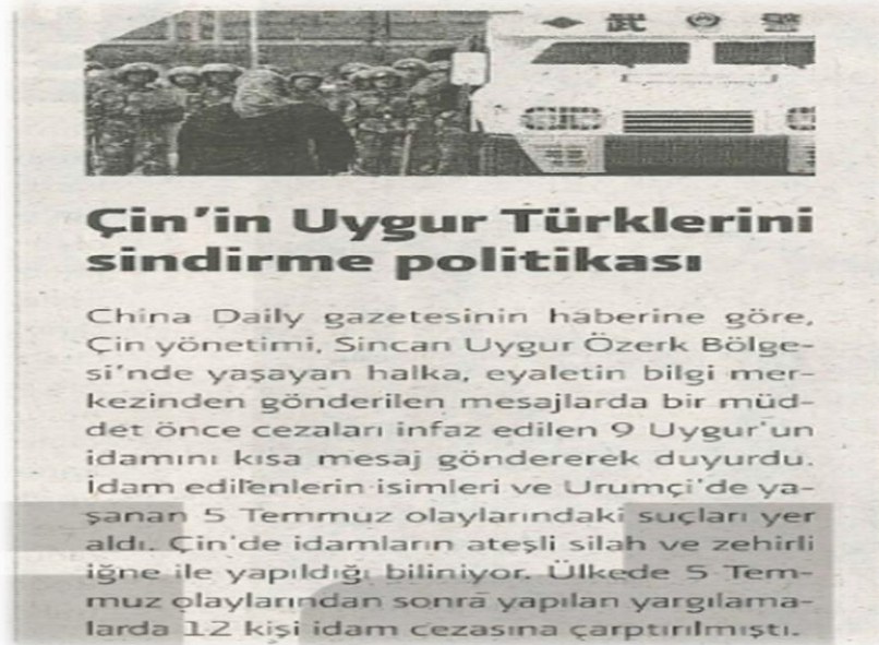
Resim 1. China Daily gazetesindeki haberin aktarımı

Örneğin “El Kaide’den Uygur Müslümanları İçin İntikam Mesaj” başlıklı yazıda aktarılan habere göre, El Kaide’nin Cezayir’deki kolu “İslami Mağrip Örgütü”, Pekin’in Uygurlara yönelik tutumuna misilleme amacıyla Kuzey Afrika’da çalışan ve Cezayir’de yaşayan Çinliler üzerinden Çin’i tehdit ettiği bilgisi verilmiştir (Baran, 2009: 5). Bir başka örneği kaleme alan Gerçek Hayat , China Daily gazetesinde yapılan haberi aktarmıştır (Koçulu, 2009: 30). Resim 1’de görseline yer verilen haberde “Urumçi’de 5 Temmuz olayının ardından yapılan yargılamalarda Çin hükümeti tarafından 12 kişiye idam cezası verildiği ve son zamanlarda dokuz Uygur’un idam edildiği” bilgisi paylaşılmıştır (Koçulu, 2009: 30). Katliam hakkında bir diğer bilgi, Genç Öncüler’de yer almıştır. “Asya’nın Garib Coğrafyası” olarak atılan başlıkta, 2009’da yaşanan olayların sorumlusu olarak Çin hükümeti, Dünya Uygur Kurultayı’nı ve Rabia Kadir’i suçlamış bölgede süregelen olayları dünya kamuoyundan saklamıştır (Açıkel ve Polat, 2010: 19).