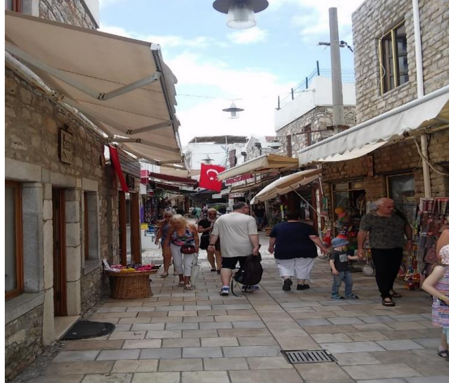
Fotoğraf 3: Cumhuriyet Caddesi, Çarşı İçi, Alışveriş (Şeyma Bayazıt: 5 Eylül 2017).

Serbest dolaşım sonunda gemiye akşam saatlerine doğru dönüş gerçekleştiren yolcuların kısmen yerel halk ile etkileşime geçtiği söylenebilir. İncelenen yeni turist grubu arasından yalnızca bir yabancı yolcunun adres sormak için bir restoran garsonu ile görüştüğü gözlenmiştir. Yolcuların, yerel halk ile sosyal etkileşimine oldukça nadir rastlansa da, küçük hediyelik alışverişi amacıyla yolcu ve çarşı esnafı arasında kısa süreli iletişim kurulduğu gözlenmiştir.