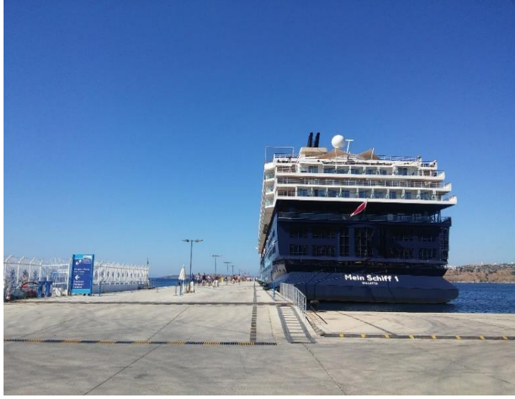
Fotoğraf 2: Bodrum Gemi Yanaşma İskelesi: Mein Schiff 1 Gemisi (Şeyma Bayazıt, 5 Eylül 2017).

Serbest dolaşım sonunda gemiye akşam saatlerine doğru dönüş gerçekleştiren yolcuların kısmen yerel halk ile etkileşime geçtiği söylenebilir. İncelenen yeni turist grubu arasından yalnızca bir yabancı yolcunun adres sormak için bir restoran garsonu ile görüştüğü gözlenmiştir. Yolcuların, yerel halk ile sosyal etkileşimine oldukça nadir rastlansa da, küçük hediyelik alışverişi amacıyla yolcu ve çarşı esnafı arasında kısa süreli iletişim kurulduğu gözlenmiştir.