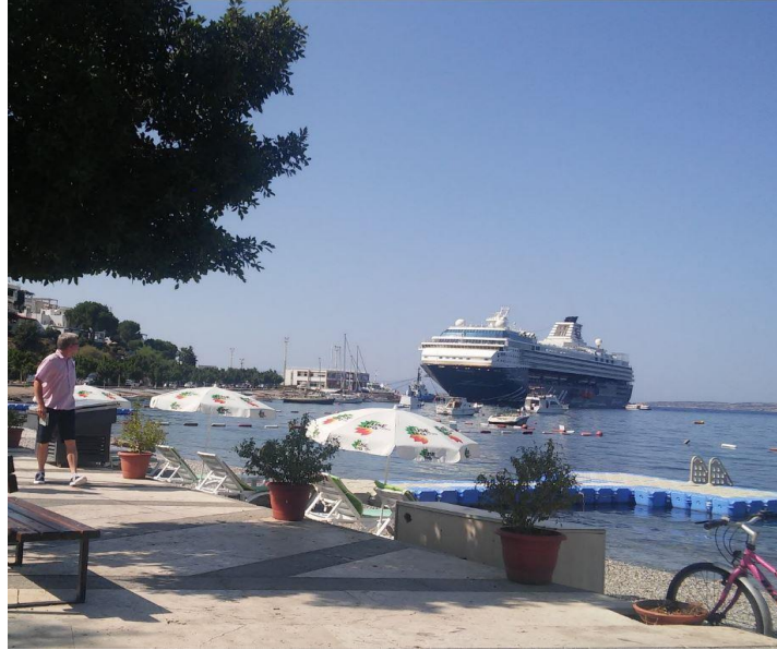
Fotoğraf 1: Kumbahçe Mevkii'nden Yanaşma Yerine Bakış: Mein Schiff 2 Gemisi (Şeyma Bayazıt, 13 Haziran 2017).