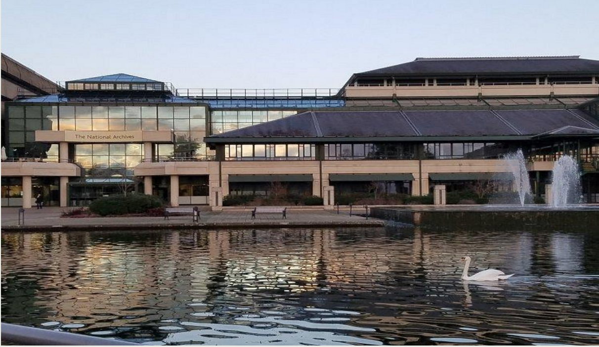
Resim 1. The National Archives (İngiliz Ulusal Arşivi)

İngiltere'nin başkentinde (Kew Gardens'ta) bulunan İngiliz Ulusal Arşivi, İngilizlerin bütün resmî yazışmalarının muhafaza altında tutulduğu kompleks bir yapıdır. İlk kayıtların XI. yüzyıla kadar gittiği arşiv, 1786 tarihinde toplu şekilde bir arşiv oluşturma düşüncesi ile teşkil edilmiş; 1838'de dağınık olarak tutulan kayıtların bir yerde toplanması düşüncesi 1851'de arşive ait bir bina yapımı ile Public Record Office ismi ile vücut bulmuştur (Ersoy, 1955: 125). Günümüzdeki mevcut konumuna ise ( The National Archives ) XX. yüzyılın ortalarında gelmiştir (Kurat, 1949: 1). Arşivin her türlü masrafı İngiliz devlet hazinesi tarafından karşılanır.