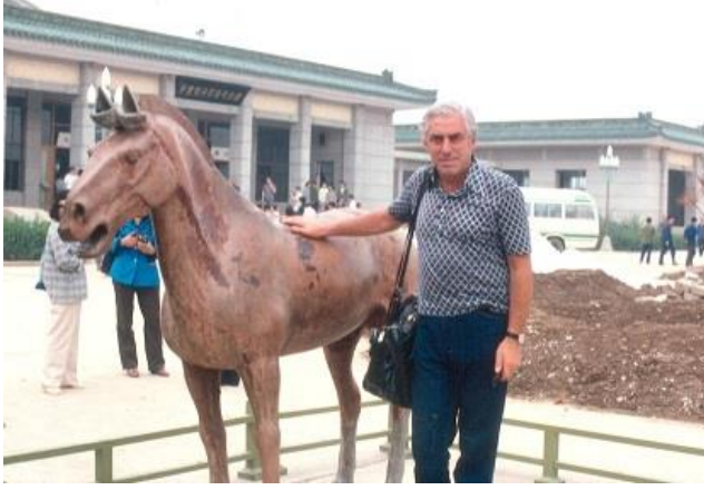
Resim 2. Chin Huang Ti, yeniden birleştirdiği Çin'i MÖ. 221-210 yılları arasında yönetmiştir. Bu kadar popüler olmasının nedeni 6.000 kişiden oluşan bir terracotta ordu ile beraber gömülmesidir. Diyarbekirli, bu imparatorun mezarından çıkan malzemenin sergilendiği müzenin önünde.

Diyarbekirli, Arseven ile beraber çalışırken hocası ile ilgili edindiği bir anısını da şöyle aktardığını hatırlıyorum: “Celal Esad Arseven öyle uzun ve yorucu bir şekilde çalışırdı ki göz kapaklarının bu yorgunluğu taşıyamayıp kapanmaması için, her ikisini de selobantla yukarı doğru bantlardı. Hocanın gözlerinin aldığı şekli düşündükçe...”