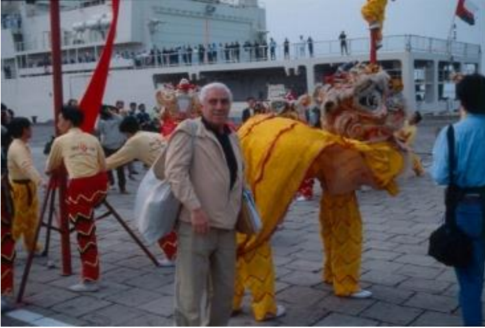
Resim 5. 1990, Çin'in Şangay limanında, Unesco heyetini uğurlayan Çinli göstericilerle birlikte. Omuzlarında Türkiye'ye gelmesi pek mümkün olmayan kitaplar.

Ancak yukarıda ifade ettiğimiz gibi, Diyarbekirli'nin yapısı sıradan bir akademisyen olamayacak kadar farklıydı. Nepotizm'in gücünün hissedilmediği dönemlerde Asya ile ilgili yaptığı çalışmaları, onu Unesco'nun İpek Yolu ile ilgili yapacağı bilimsel araştırmalarda, Türkiye temsilcisi olarak atanmasına yardımcı oldu. 1987'den başlayarak 10 yıl boyunca yaptığı geziler sonucu topladığı kitap, çektiği film ve dia pozitif ve fotoğraflar, çok önemli bir kütüphane oluşturmasına neden olmuştur. Hayatı boyunca topladığı malzemeler Eralp Alışık'ın çabalarıyla bugün Yeditepe Üniversitesi bünyesinde hizmet vermektedir.