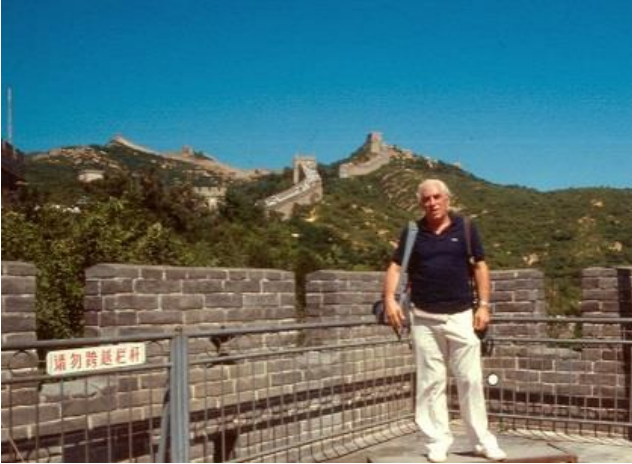
Resim 3. Savaşan Eyaletler döneminde (MÖ. 475-221) yapımına başlanan Çin Seddi. Zaman, para ve insan kaybindan başka bir şeye sebep olmayan, tedbir amaçlı inşa edilen bu duvar, Türkler tarafından defalarca aşılmıştır.

Diyarbekirli, Arseven ile beraber çalışırken hocası ile ilgili edindiği bir anısını da şöyle aktardığını hatırlıyorum: “Celal Esad Arseven öyle uzun ve yorucu bir şekilde çalışırdı ki göz kapaklarının bu yorgunluğu taşıyamayıp kapanmaması için, her ikisini de selobantla yukarı doğru bantlardı. Hocanın gözlerinin aldığı şekli düşündükçe...”