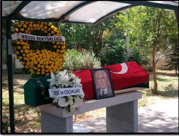
Resim 8. Moda camisi, 16 Temmuz 2017

içimize bir nebze su serpildi. Ancak yine de vefat haberini Moğolistan'da öğrendiğimde duyduğum üzüntüyü sizlerle paylaşamam. Kendisini 16 Temmuz 2017 günü Karacaahmet Mezarlığı'nda ailesi ve sevenleri ile birlikte ebediyete uğurladık.