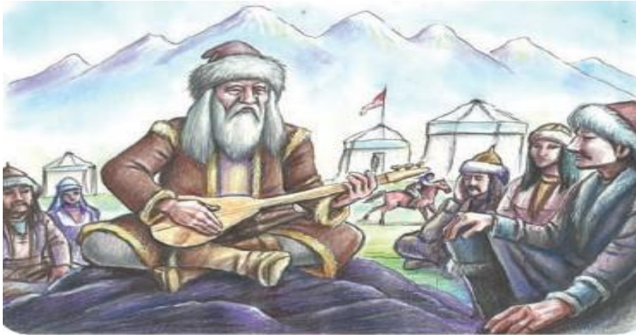
Görsel 1: Dede Korkut'u destan söylerken betimleyen görsel

“Metni Anlama ve Çözümleme” kısmında yer alan 10 soru dikkatle incelendiğinde soruların çok genel olduğu görülmektedir. Bunların yerine metinden alınan örnekler üzerinden cevaplanacak, tabloya veya şemaya dayalı olan, görsellerle beslenecek soruların daha etkili olacağı düşünülmektedir. Toplam 5 sayfadan oluşan anlatım sırasında 2 görsele yer verildiği tespit edilmiştir. Görseller aşağıdadır: