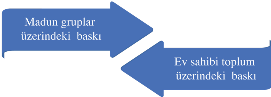
Şekil 3: Baskının İki Yönü

Burada şiddetin türlerinin bu madun gruplar üzerindeki baskısının karşısında, ev sahibi toplumun tahammülünün düşmesinin (Erdoğan, 2020) oluşturduğu baskı ile tansiyonun diğer bir yüzünden bahsedilmektedir. Şekil 3'te iki vektörün toplamı neticesinde oluşan baskı ev sahibi toplum ve madun gruplar arasında tansiyona neden olabilmekte ve bazen birey, toplum ve milli güvenlik bakımından tehditler ve hassasiyetler ortaya çıkabilmektedir.