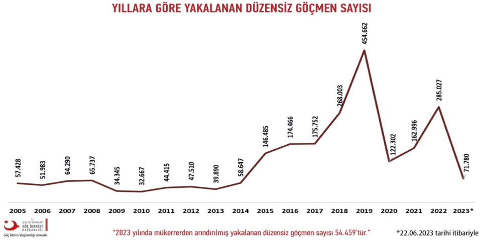
Şekil 1: Türkiye'de Yıllara Göre Tespit Edilen Düzensiz Göçmen Sayısı

Her ne kadar Covid-19 sürecinde bu rakamda bir düşüş olsa (122.302) da sonrasında tekrar yükselişe (285.027) geçmiştir (Göç İdaresi Başkanlığı, 2023). Tespit edilen göçmenlerin sayısının yüksekliği Türkiye'nin düzensiz göçmenler için bir hedef ülke olduğunu göstermektedir. Toplam rakamın içerisinde uyrukların dağılımındaki çeşitlilik ilgi uyandırmasına rağmen, Afganlıların rakamının (Ör: 2019'da 201.437 ve 2022'de 115.775) başı çekmesi bu göçmen grubunu tartışılmalı hale getirmiştir.