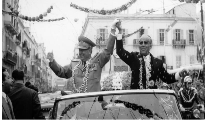
Resim 3: “Tito Tunus halkını selamlıyor” Adlı Görselin Göstergebilimsel Analizi

1963 yılında Karadağ'ın Çetine kentinde çekilen bu fotoğrafta Tito ve SSCB lideri Kruşçev yerel halkla dans ederken görülmüştür. Yugoslavya'nın hem Batı'dan hem de SSCB'den önemli miktarda kredi almaya hazırlandığı dönemde çekilen bu fotoğraf, iki sosyalist lider ve ulusları arasındaki yakın ilişkiyi simgelemektedir. Yerel halkın katılımı, bu liderler tarafından teşvik edilen birlik ve dayanışmayı vurgulamaktadır. Bu tür halka açık gösteriler, uyum ve işbirliği imajını güçlendiren güçlü propaganda araçlarıdır. Bu krediler Yugoslavya'daki yaşam kalitesini geçici olarak arttırmayı ve Tito'nun liderliği altında ilerleme ve refah algısını güçlendirmeyi amaçlamıştır.