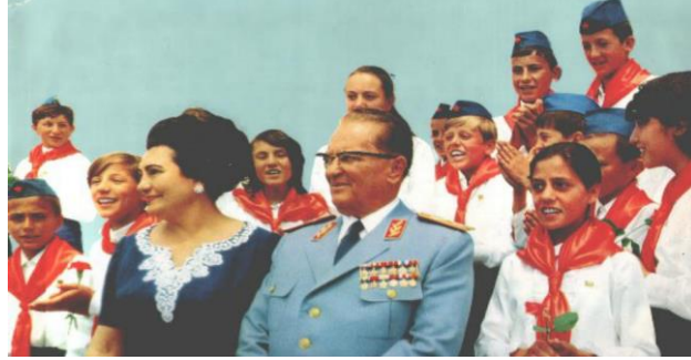
Resim 4: “Tito Yugoslavya Öncüleri Birliği’yle” Adlı Görselin Göstergibilimsel Analizi

Tito'nun Tunus Cumhurbaşkanı Habib Burgiba ile yer aldığı 1961 tarihli fotoğraf, diplomatik bir dostluk anını gözler önüne sermektedir. Tito'nun Afrika'daki varlığı, Yugoslavya'nın küresel sahnedeki etkisini artırmak için yeni bağımsızlığını kazanan ülkelerle güçlü bağlar kurma politikasının altını çizmiştir. Halka açık bu dayanışma gösterileri, Yugoslav liderliğinin imajını ve uluslararası işbirliğine olan bağlılığını güçlendirmek için tasarlanmış güçlü propaganda araçları olmuştur. Bu tür etkinlikler, Tito kültürüne de katkıda bulunarak onu sevilen ve etkili bir küresel figür olarak tasvir etmiştir. Rejim, Tito'nun diğer dünya liderleriyle olan yakın ilişkilerini ve kitleler tarafından coşkuyla karşılandığını vurgulayarak Tito'nun ulusal ve uluslararası prestijini pekiştirmiş, ulusal gurur ve birliği teşvik etmiştir.