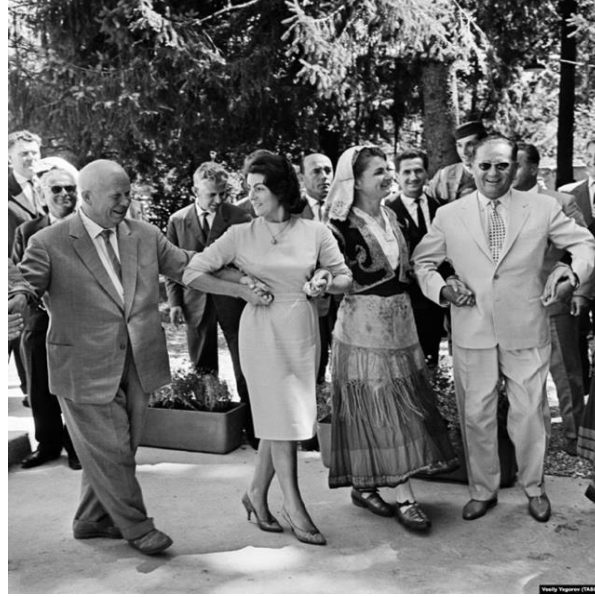
Resim 2: “Sovyet lideri Nikita Kruşçev ve Tito’nun Çetine’de yerlilerle dans etmesi” Adlı Görselin Göstergebilimsel Analizi