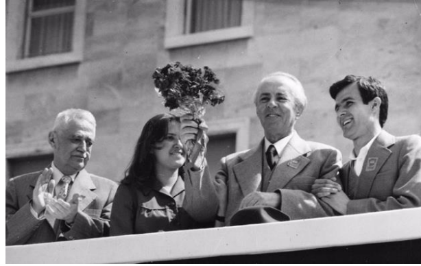
Resim 7: “Enver Hoca halka çiçek uzatıyor” Adlı Görselin Göstergebilimsel Analizi

Bu görsel, Enver Hoca'nın liderliğini ve PPSH'nin gücünü gösteren güçlü bir propaganda parçası olarak hizmet etmiştir. PPSH'nin 1976 yılındaki 7. Kongresi sırasında çekilen bu fotoğraf, Hoca'yı kalabalığa el sallarken göstermekte ve halkla olan bağını simgelemektedir. Arkasındaki binada görülen, partinin 35. Yıldönümünü kutlayan devasa poster, partinin uzun süredir devam eden etkisinin ve ideolojisine verilen yaygın desteğin altını çizmektedir. Hoca'nın resmi kıyafeti ve kendinden emin tavrı karizmatik ve deneyimli bir lider imajı çizmektedir. Kalabalığın enerjik katılımı rejimin kitle desteğini harekete geçirme becerisini vurgulayarak birleşik ve güçlü bir sosyalist devlet imajını pekiştirmektedir. Genel olarak bu fotoğraf, Enver Hoca'nın liderlik kültürünü ve onun yönetimi sırasında Arnavutluk'taki güçlü ideolojik bağlılığı vurgulamaktadır.