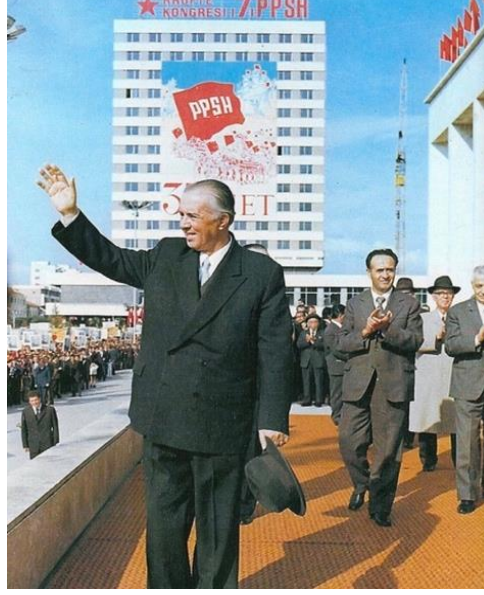
Resim 6: “Enver Hoca 1976 yılında Tiran’da Arnavutluk Emek Partisi (PPSH)’nin 7. Kongresine Katılırken” Adlı Görselin Göstergebilimsel Analizi