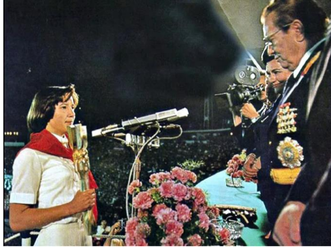
Resim 1: “Tito’ya 1977’de her yıl düzenlenen Gençlik Koşusu’nda baton hediye edildi” adlı Görselin Göstergebilimsel Analizi