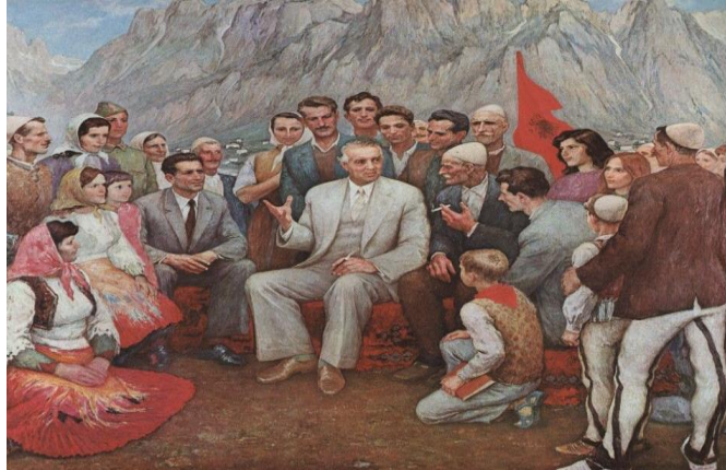
Resim 5: "İnsanlarla Diz Dize" Adlı Görselin Göstergibilimsel Analizi