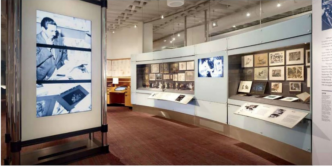
Fotoğraf: 3- Walt Disney Aile Müzesi, Yeni Başarı ve Büyük Tutkular (Yu, J., 2012, s. 222)