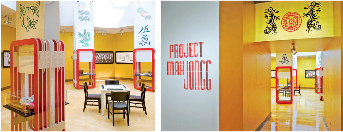
Fotoğraf: 5- Musevi Kültür Mirası Müzesi, New York (Locker, P., 2013, s. 113).

Metnin karakteristik özelliği, kullanılan renkler gibi ayrıntıların oluşumunda sergi tasarımcısının belirlemiş olduğu konsept ve serginin hikâyesi çok iyi kavranmalıdır. Grafik öğelerinin desteğiyle hikâyeye uygun mekânın tasarlanması, ziyaretçinin müze sergilemelerinde etkileşime geçmesine neden olacak ve sergi mekânı ile bağlantı kurmasını sağlayacaktır. Böylelikle ilgi çekici sergi mekânı tasarımları ziyaretçinin merak duyduğu konularla daha çok meşgul olmasına neden olacaktır.