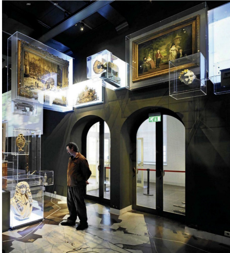
Fotoğraf: 8- Bir Vitrin Örneği (Kossmann, H. ve Jong, Mark W. de., 2010, s. 260-261).

Müze sergilerinde vitrinlerin tasarımında sergilenen malzemelerin ya da nesnelerin özellikleri, fiziksel şartları ve ölçüleri dikkate alınması gereken konuların başında gelir. Sirel bu sergi tasarım öğelerinin aydınlatma düzeninin de sergilenen nesnenin özelliklerine bağlı olarak biçimlenmesi ile birlikte geliştiğini ifade etmektedir. Vitrinlerin tasarlanma aşamasında tasarımcı ile aydınlatma uzmanının birlikte çalışmasının önemi ortaya çıkmaktadır. Bu aşamada sergileme vitrini, aydınlatma ve nesne arasındaki ilişkinin birlikte ele alınması zorunludur. Vitrinin biçimlenmesine etki eden objelerin, tasarımın oluşmasındaki rolü oldukça yüksektir. Aynı zamanda objelerin büyüklüklerinin, şekillerinin birbirlerinden farklı olmaları onların belli gruplara ayrılarak farklı tipte vitrin tasarımlarının ortaya çıkmasına neden olmaktadır (Sirel 1992, s. 35).