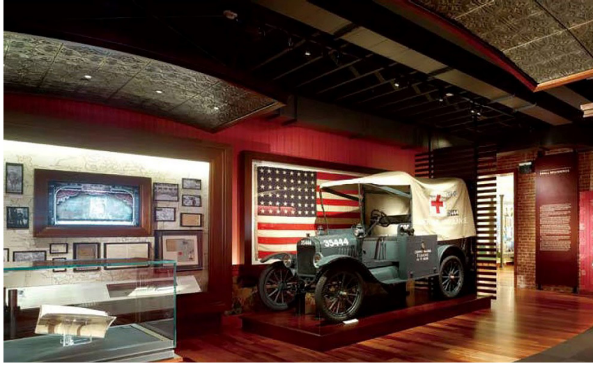
Fotoğraf: 1- Walt Disney Aile Müzesi, Sergi Başlangıcı (Yu, J., 2012, s. 220)