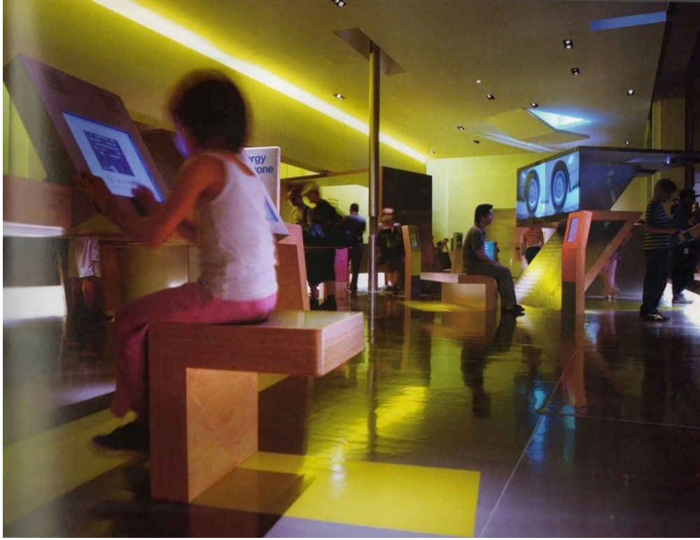
Fotoğraf: 11- Bilgisayarlı Cihaz Yerleştirilmiş Bir Sergi Mobilyası (Dernie, D., 2006, s. 67).

Fotoğraf 10'da etkinliğin yapıldığı noktada kullanılan taburelerin üzerine oturan ziyaretçilerin fotoğraflarını çeken bir butonu kullandıkları görülmektedir. Zemine yansıtılan ve tabureler arasında gezinen ve değişen fotoğraflarla bir tür etkileşim sağlanmak istenmiştir (Locker, 2013, s. 100). Sergileme alanında müdahale edilebilen cihazların, ekranların, buton ya da tuşların yer aldığı mobilyaların serginin konusu ile bütünleşecek niteliklerde tasarlanması sergiye olan katılımın artmasını sağlayacaktır.