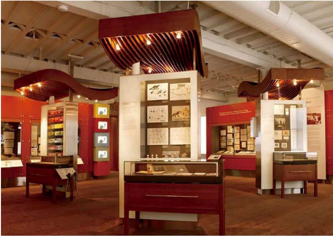
Fotoğraf: 4- Walt Disney Aile Müzesi, Yeni Ufuklar (Yu, J., 2012, s. 223)