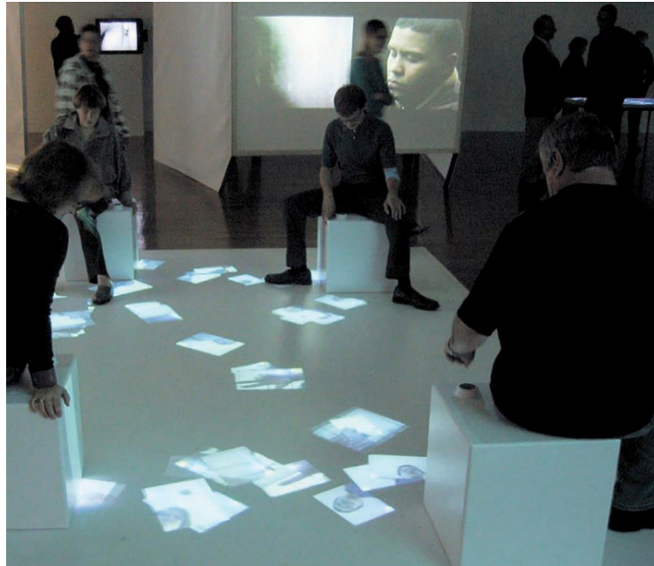
Fotoğraf: 10- Nosy Parker, Denge ve Güç Sergisi, Krannert Sanat Müzesi, ABD (Locker, 2013, s. 100).