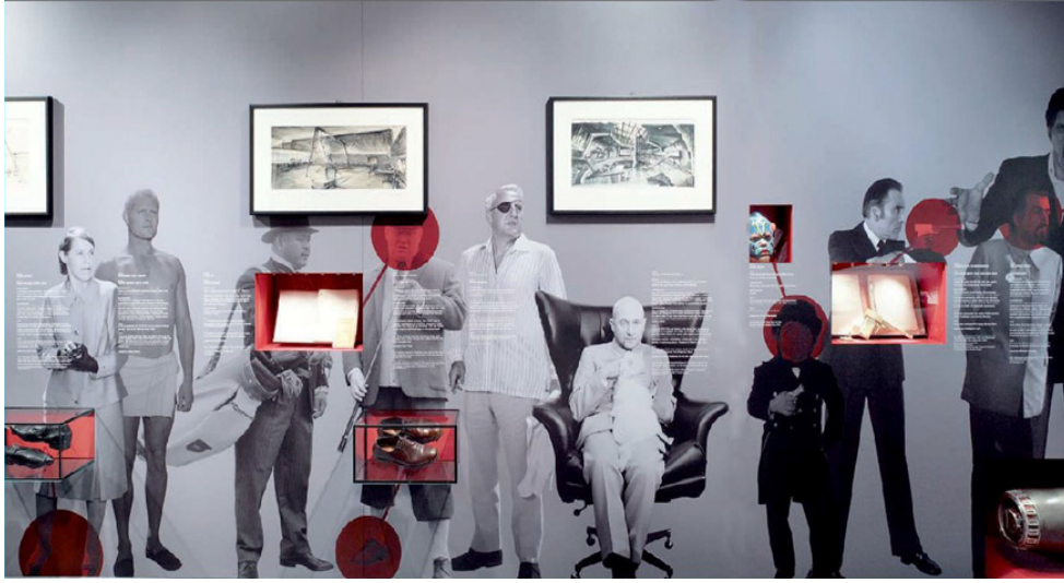
Fotoğraf: 6- “Yalnız Gözlerin İçin” James Bond Sergisi, İmparatorluk Savaş Müzesi, Londra (Locker, P., 2013, s. 122).