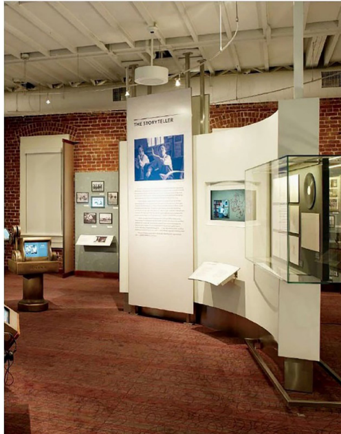
Fotoğraf: 2- Walt Disney Aile Müzesi, Uzun Metrajlıya Geçiş (Yu, J., 2012, s. 221)