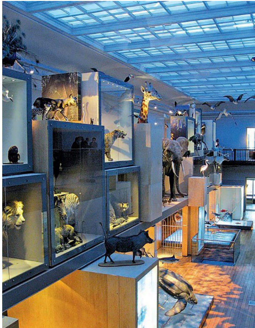
Fotoğraf: 7- Büyük Kuzey Müzesi’nden Bir Vitrin Aydınlatma Örneği (Locker, P., 2013, s. 152).

Fotoğraf 7’de görüldüğü gibi Büyük Kuzey Müzesi’ndeki hayvan doldurma koleksiyonunun sergilendiği vitrinlerin büyüleyici bir aydınlatma tekniği ile düzenlenmesi objeler üzerine olan çekiciliği ve merakı daha da güçlendirmektedir. Işığın, hikâyenin anlatılmasındaki etkisinin öne çıkmasında vitrin malzemesinin ve tercih edilen renklerin önemi de oldukça yüksektir.