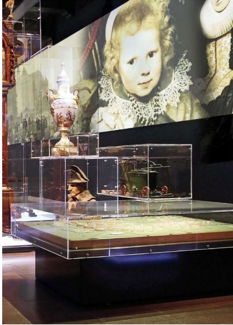
Fotoğraf: 9- Bir Vitrin Örneği (Kossmann, H. ve Jong, Mark W. de., 2010, s. 262-263).

Hikâye anlatımının bir ögesi olarak, seçilen objelerin sunumunda ve korunmasında önemli rol oynayan vitrinlerin ziyaretçinin ilgisini çekecek düzeyde tasarımı gerçekleştirilirken, yüksekliklerinin ziyaretçi ergonomisine uygun ölçülerde olmasına özen gösterilmelidir. Arka yüzeyde ise göz kamaştırıcı renkler yerine eseri belirgin gösteren beyaz, siyah ve kurşuni gibi nötr renklerin tercih edilmesi daha uygun olacaktır (Locker, 2013, s. 103). Sergi tasarımcısının etkili bir vitrin tasarlayabilmesi tamamen oluşturacağı kompozisyonun içeriğine bağlıdır. Çekici bir kompozisyonu sağlamak için objeleri en avantajlı şekilde yerleştirebilmeli, arkalıkları ve etiketleri ilgi uyandıracak şekilde bir araya getirebilmelidir (Belcher, 1991, s. 125). Müzelerde vitrin tasarımı konusunda yeni bir çalışma alanının doğmasına sebep olan bu geliştirme çabaları ziyaretçiye sergileme mekânını daha ilgi çekici hale getirecek etkilerin tasarlanmasına da imkân sunmaktadır.