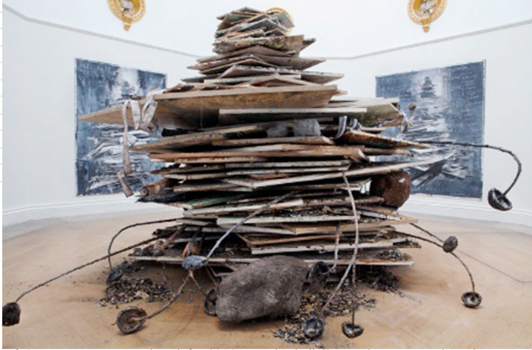
Fotoğraf: 3 Dünyanın Yaşı, Anselm Kiefer, 2014, Karışık teknik ile enstalasyon, Royal Academy, Londra, İngiltere.

Açıktır ki sanatçı, eserlerinde tarihsel bir içeriğe sahip bir anlatımı yıkım ve deneysellik üzerinden vurgulamıştır. Bu davranışı eserlerine bilimsel bir yaklaşım getirir. Primitifliğine rağmen resimleri olabildiğince realistiktir. Malzeme ve konsept ilişkisinin yorumlanmasında materyalist teknik majör rol oynar.