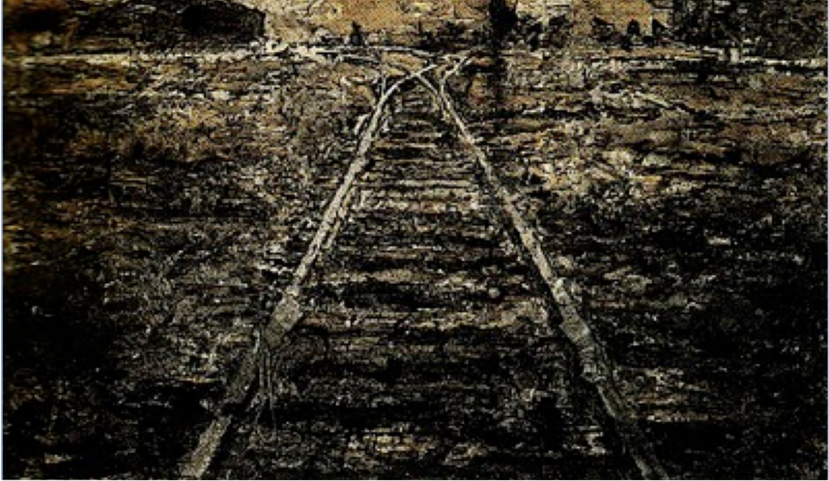
Fotoğraf: 2 Demir Yol, Anselm Kiefer, 1986, yağlı boya, akrilik, and tuval üzerine emülsiyon, dallar ve demir, 220 x 380 x 27.9 cm, Anthony D'Offay Galerisi, Londra) (Biro, 2003, Fot.5).

( http://www.christies.com/lotfinder/Lot/anselm-kiefer-b-1945-eisen-steig-5621943-details.aspx )