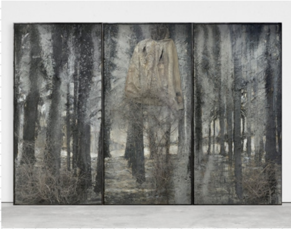
Fotoğraf: 4 Karfunkelfee, Anselm Kiefer, 2009, Tuval üzerine altın boya, pelerin, akrilik, yağlıboya, emülsiyon, çalı, toprak ve cila, çelik ve cam çerçeve, 382 x 576 x 35 cm, White Cube, Londra, İngiltere. (Kiefer, A. (2009) Karfunkelfee 2009. (Online Image). October, 01, 2016 from

Galeriye göre planlanan (Şema1) enstalasyonda, tuval üzerine kullanılan malzemeler, bir çeşit yağ karışımı, emülsiyon boyası, akrilik, kil, kül, toprak, kurumuş ayçiçeğinden oluşmaktadır. Piramit bir kompozisyon halinde kurulu eserin etrafında paslanmış ve yıpranmış demirler, yuvarlaklar çizerek dinamik bir eser sunmaktadır. Hem aşağı ve yukarıya işaret ederken; insanların etrafında üç yüz altmış derece dönmelerini sağlar.