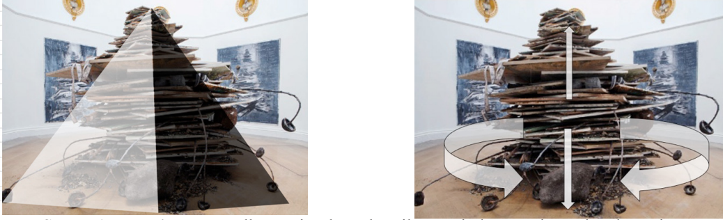
Şema: 1 Dünya'nın Yaşı adlı resmin Photoshop ile resmin kompozisyon incelemesi

Galeriye göre planlanan (Şema1) enstalasyonda, tuval üzerine kullanılan malzemeler, bir çeşit yağ karışımı, emülsiyon boyası, akrilik, kil, kül, toprak, kurumuş ayçiçeğinden oluşmaktadır. Piramit bir kompozisyon halinde kurulu eserin etrafında paslanmış ve yıpranmış demirler, yuvarlaklar çizerek dinamik bir eser sunmaktadır. Hem aşağı ve yukarıya işaret ederken; insanların etrafında üç yüz altmış derece dönmelerini sağlar.