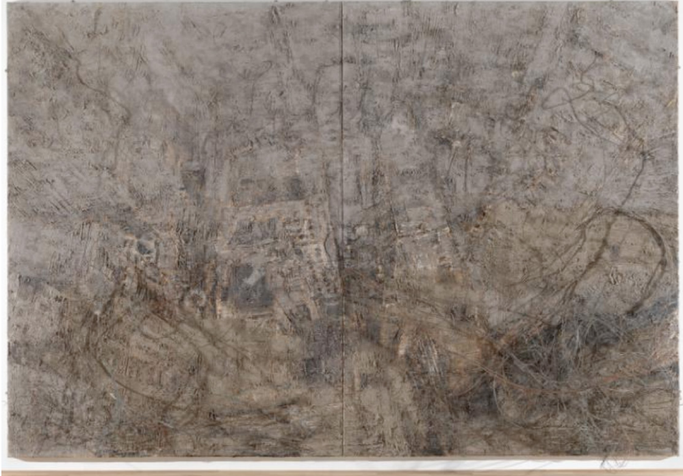
Fotoğraf:1 Lilith, Anselm Kiefer, 1987 – 89, Tuval üzerine yağlı boya, kül ve bakır tel, 3,815 x 5,612 x 50 cm, Tate Modern, Liverpool, İngiltere.

(Kiefer, A. (2003). Lilith. 1987-89. October, 01, 2016 from < http://www.tate.org.uk/art/artworks/kiefer-lilith-t05742 > [Accessed June 2008]).