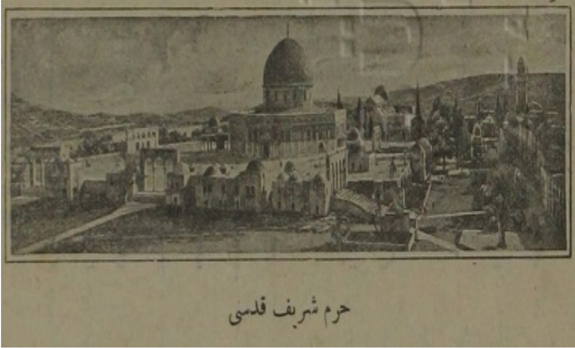
Resim 2. Tarihçe-i Harem-i Şerîf-i Kudsî Risalesi'nde bulunan Harem-i Şerîf-i Kudüs Resmi