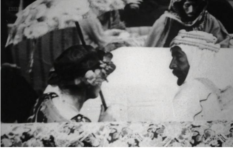
Fotoğraf 6. Sir Percy Cox ve Gertrude Bell İbn Sa'ud'un Basra ziyareti sırasında 109