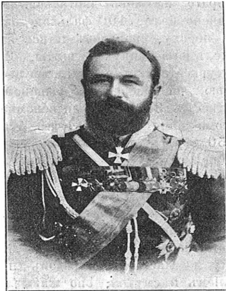
Görsel 7. Aleksey Kuropatkin (Abaza, 1902, s. 247).