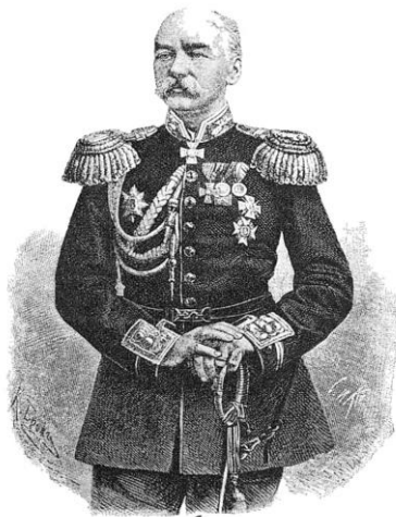
К. П. Кауфманъ.

Yaşanan bu gelişmeleri takiben Kaufmann, Skobelev ve Çernyayev komutasındaki Ruslar, Türkistan'ın işgaline başladılar ve 1865'te Taşkent, 1868'de Semerkant Rus topraklarına dâhil edildi. Rus kontrolünün Amu Derya'nın kuzeyine kadar sağlanması üzerine İngiltere Başbakanı Benjamin Disraeli, Kraliçe Victoria'ya yazdığı bir mektupta "Merkezî Asya'nın Moskovalılardan temizlenmesini ve Hazar'ın ardına püskürtülmeleri gerektiğini" ifade etti. Bunun üzerine İkinci İngiliz-Afgan Savaşı çıktı. İlkinde olduğu gibi bu savaşta da İngilizler istediklerini elde edemediler ve 1881 yılında Kabil'den bir kez daha geri çekildiler. Rusların 1884'te Merv Vahası'nı ele geçirmesi ve Pençşir'de Afganlarla çatışmaya girmesi İngilizlerle aralarında bir başka krize yol açsa da İngilizler Amu Derya'da Rus üstünlüğünü kabul ettiler. Son olarak, 1907'de İngilizler ve Ruslar masaya oturdu. Ruslar, İngiltere'nin Afganistan üzerindeki hâkimiyetini kabul edip Afganistan ile tüm siyasi ilişkilerini İngilizler aracılığıyla yürüteceklerini kabul ederken, İngilizler mevcut sınırlarını koruyup Rusların Türkistan'da işgal ettiği topraklara herhangi bir müdahale girişimine şiddetle karşı çıkacaklarını beyan ettiler (Alımkulov & Namatov, 2021, s. 16; Külünk, 2020, s. 101).