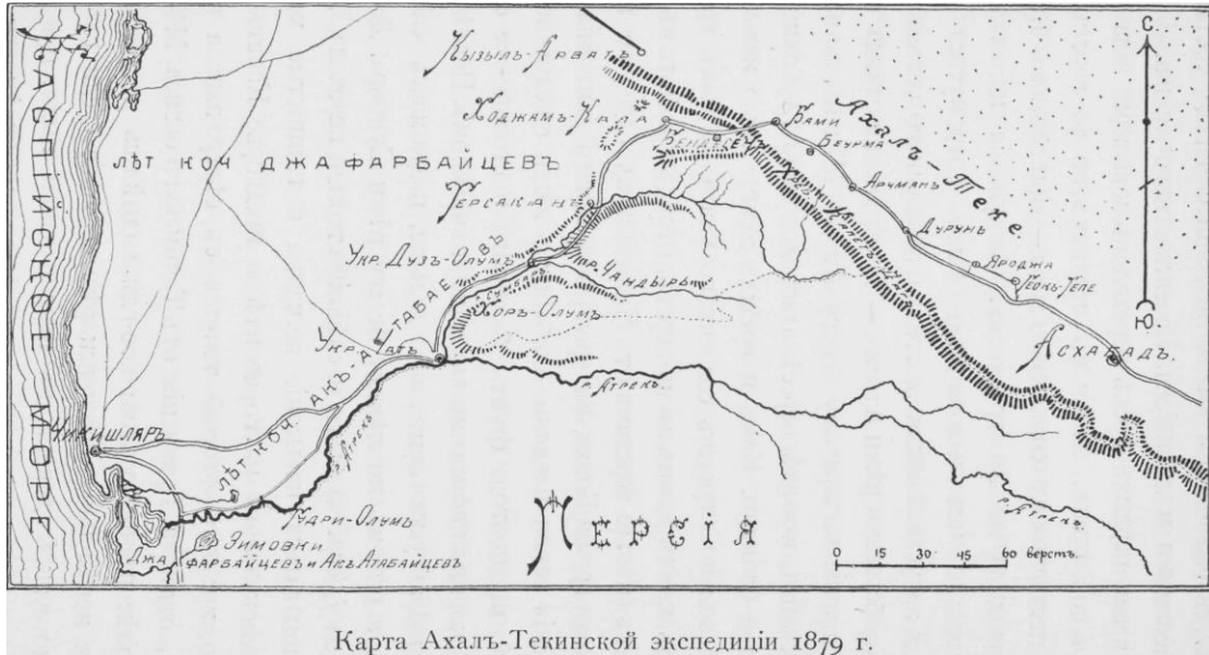
Görsel 3. 1879 Ahal Teke Seferi Haritası (Martinov, 1899, s. 173).

getiremeyeceği, çölün zorlu şartlarından ve Rus garnizonlarına olan mesafeden kaynaklı yiyecek, hayvan yemi, askerî mühimmat ve teçhizat yollayamayacağı üzerine kuruldu. Eğer Ruslar, bu zorluklarla karşı karşıya kalırlarsa geri çekilecekler ve Türkmenler süvarileriyle onları takip edip vur kaç taktiği ile yok edeceklerdi. 21 Ağustos'ta üç koldan harekete geçen Rus ordusu, Göktepe'ye doğru ilerlerken topçu ve piyadeleri yavaşlatacağını düşündüğü nakliye araçlarını Bendesen'de bıraktı. Sadece topçular ve bazı piyadeler çadırlarını yanlarına aldı. 2350 develik bir konvoy ile yola çıkan Lomakin, bu kuvvetin zafer için yeterli olacağına inanmaktaydı. Lomakin; Kızıllarvat, Bami, Börme ve Arçman sakinlerinin buraları terk etmesinden dolayı direnişle karşılaşmadan söz konusu yerleri ele geçirdi. Bu yerleşim yerlerinin ele geçirilmesi, su kaynaklarına yakın olmaları ve ordunun su ihtiyacının giderilmesi için önem arz etmekteydi (Potapov, 2021a, s. 69; Potapov, 2020, s. 103)