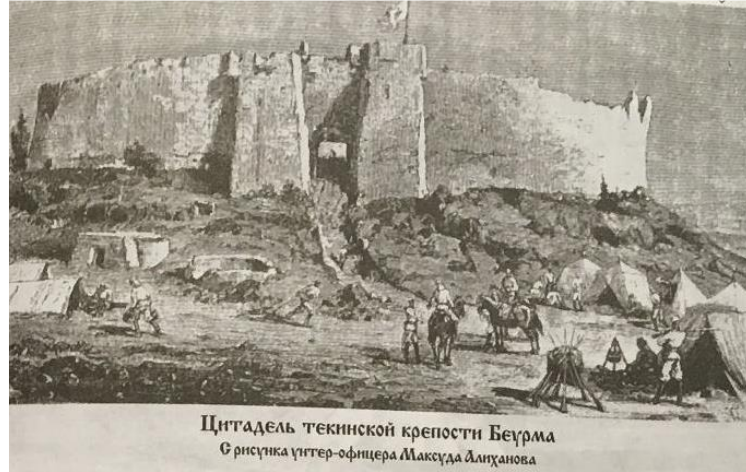
Görsel 12. Börme Kalesi (İvanov, 2003, s. 179).

Koritskiy'e gıda, teçhizat ve mühimmatın muhafaza edilmesi için depo kurulması talimatını verdi. Koritskiy aynı gün bir piyade ve bir Poltava Kozak süvari bölüğü ile Börme'yi işgal etti. Bunun için kendisine 2. Derece Kılıçlı Aziz Stanistav Nişanı verildi. (Potapov, 2021b, s. 63; Grodekov, 1883b, s. 78-79)