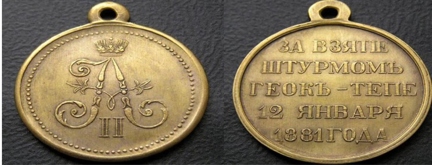
Görsel 14. 12 Ocak 1881 yılında Gök-Tepe Saldırısına katılanlar için verilmiş bir madalya (Potapov, 2020, s. 273).