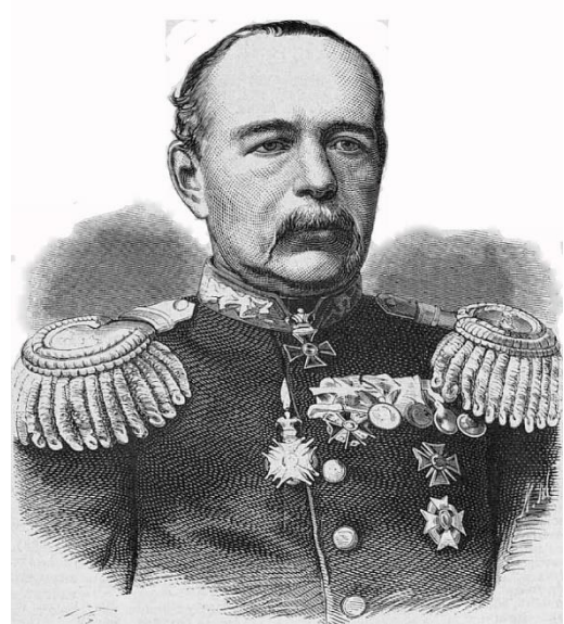
Görsel 8. Nikolay Lomakin (Ruwiki, 2024).