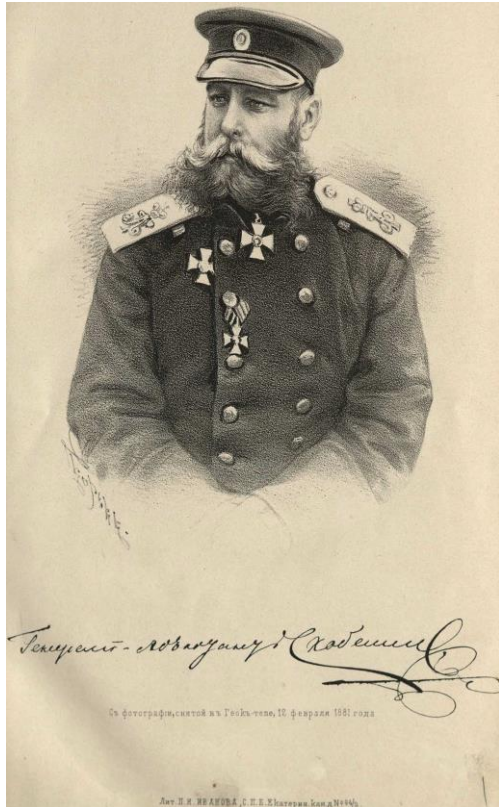
Görsel 4. Mihail Skobelev (Grodekov, 1883a).