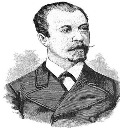
Генералъ-лейтенантъ М. Г. Черняевъ.

Görsel 1. Konstantin Kaufmann (Abaza, 1902, s. 229).