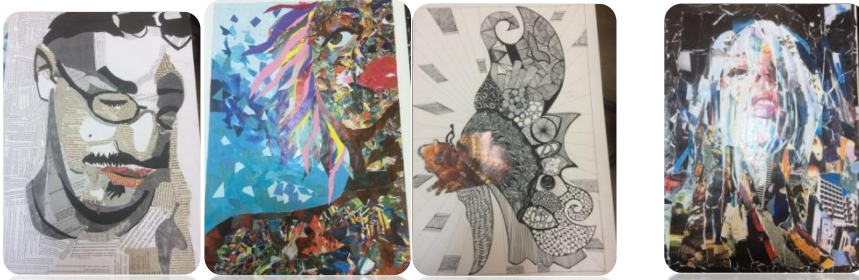
Öğrenci Çalışması:7 Öğrenci Çalışması:8 Öğrenci Çalışması:9 Öğrenci Çalışması:10