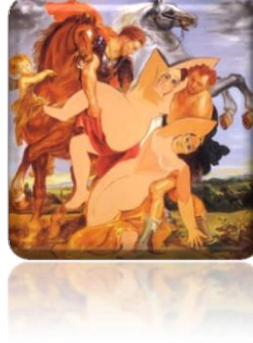
Resim 1: Russell Connor "The Kidnapping Of Modern Art by the New Yorkers"

20. yüzyılın başında modernliğin temsilini kentsel temalarda ve endüstriyel süreçlerde arayan birçok sanatçının yanı sıra, hızlı kentleşmeye ve endüstrileşmeye tepki duyan birçok sanatçı da olmuştur.