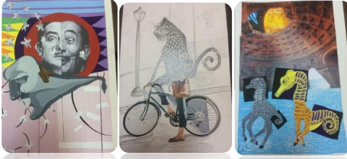
Öğrenci Çalışması:4 Öğrenci Çalışması:5 Öğrenci Çalışması:6