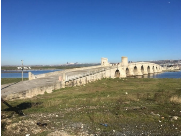
G.1. Köprü'nün genel görünümü (2022)

Mimar Acem Ali'nin ölümüyle 1537/1538 yılında göreve getirilen Sinan 7 sadece Osmanlı mimarisi için değil aynı zamanda dünya mimarlık tarihi içinde önemlidir. Kendi üslûbunu oluşturarak, yetiştirdiği mimarlarla da bir ekol olmuştur. 1588'de ölümü üzerine yerine Dâvud Ağa getirilmiştir 8 . Mimar Sinan'ın bilinen tek imzası 9 (G.2-3) Kanuni Sultan Süleyman için 1563 yılında yapımına başlanan ve onun ölümünden sonra 1567'de bitirilen 10 Büyükçekmece Köprüsü'nde (G.1) yer almaktadır.