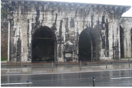
G.6. Köşkün genel görünümü (2011)

Dâvud Ağa'nın ikinci imzasına Sarayburnu civarında surlar üzerine inşa edilen fakat tamamı günümüze gelemeyen Sinan Paşa Kasrı'nda 15 (G.6) (İncili Köşk) 16 rastlanmaktadır. Çeşmenin üzerindeki kitabe (G.7) göre 1589-90 tarihinde inşa edilmiştir. Çeşmenin ve kitabenin günümüzdeki durumu çok kötüdür. Kitabe dış etkenlerden dolayı neredeyse okunamayacak duruma gelmiştir.