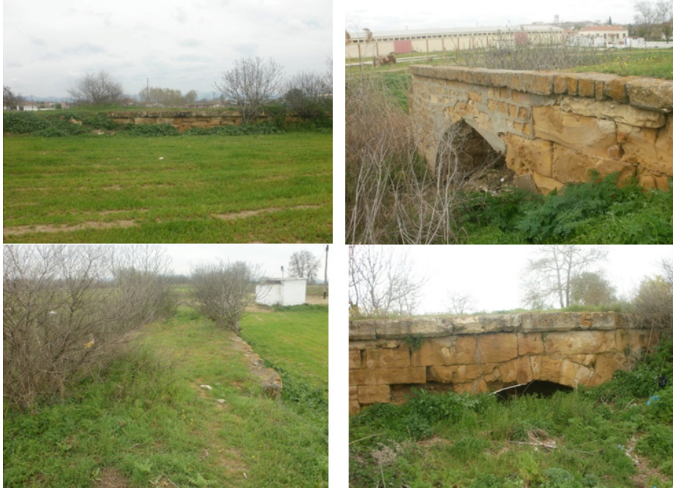
G.15. Köprünün çeşitli açılardan görünümü (2020) 42

4-. Kuloğlu (adlı şair) onun tarihini dedi. Cennet-i Firdevs (Hacı Kasım Ağa'ya) makam olsun. Sene 1644 41 "