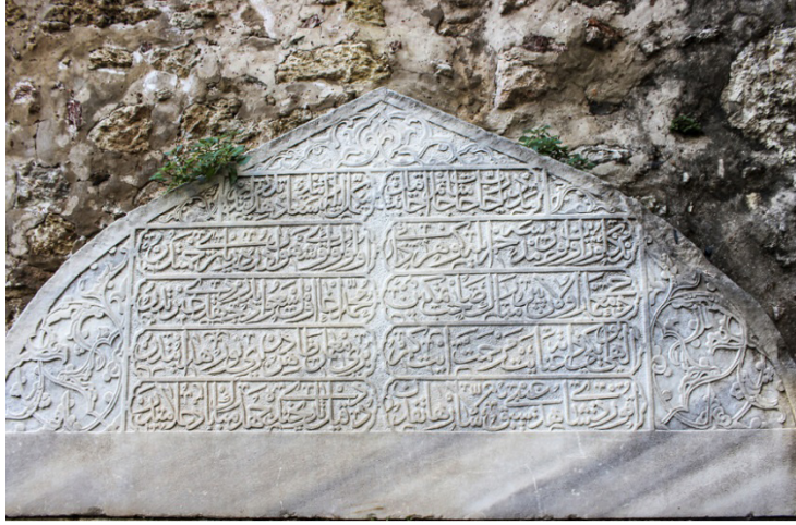
G.14. Sedefkâr Mehmed Ağa'nın adının geçtiği kitabe (Tüfekçioğlu'ndan) 32