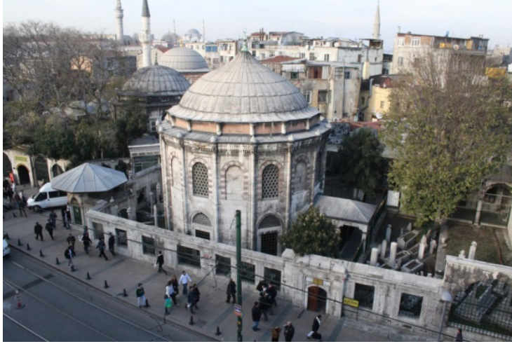
G.8. Koca Sinan Paşa Külliyesi'nin genel görünümü (2011)