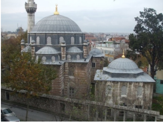
G.4. Külliye'nin genel görünümü (2011)

Mimar Sinan'ın ölümü üzerine göreve gelen Dâvud Ağa 12 , Hassa baş mimarlığı döneminde 4 yapıya açıkça imzasını koymuştur. 1585 tarihli İstanbul Çarşamba Mehmed Ağa Külliyesi'nin (G.4) avlu girişi kapısı üzerindeki on altı mısralık inşa kitabesinde Dâvud Ağa'nın bilinen ilk imzasına "mimar" unvanı ile (G.5) rastlanmaktadır. Henüz Mimar Sinan'ın hayatta ve baş mimar olduğu dönemde Dâvud Ağa tarafından inşa edilip tamamlanan külliye cami, türbe, hamam, çeşmeler (doğu ve batı yönde) ile günümüze gelemeyen tekke ve medrese yapıları ile geniş kapsamlı bir yapılar topluluğu olarak tasarlanmıştır. Külliye'nin kitabesi avluya girişi sağlayan ana kapı üzerinde on altı mısra olarak düzenlenmiştir. Kitabeden hareketle Sultan 3. Murad devrinde sarayın nüfuzlu isimlerinden Mehmed Ağa tarafından yaptırılmıştır.