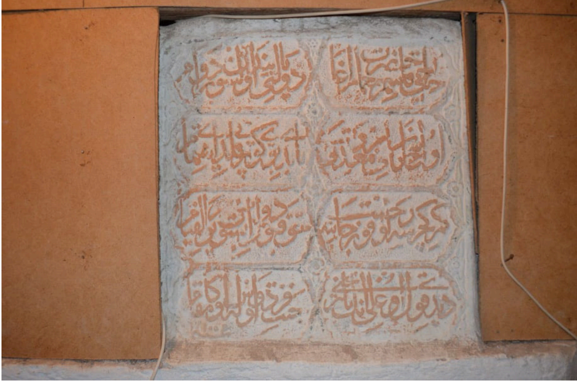
G.16. Köprü Kitabesi (2020)