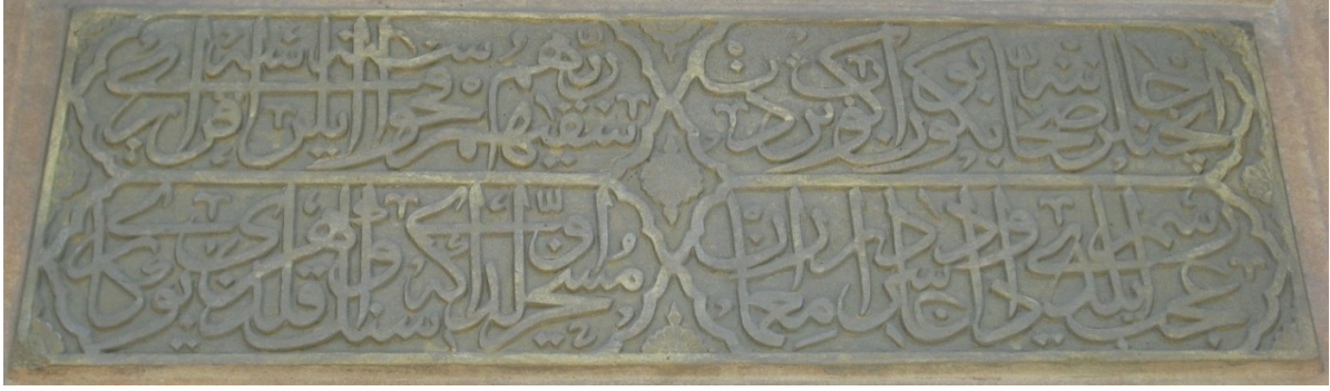
G.9. Mimar isminin geçtiği kitabe bölümü (2011)

Mimarın imzasına rastlanan bir başka yapı Topkapı Sarayı içinde yer alan 1586 tarihli 22 Zülüflü Baltacılar Koğuşu'dur. Bir kitabede mimarın adı doğrudan verilirken (G.10) diğ erinde ise mimarın ismine atıfta bulunulmuştur (G.11). Hem koğuş hem de tamir kitabesinde adı geçen Dâvud Ağa'nın saray içerisinde rastlanan başka imzası -şimdilik- yoktur.