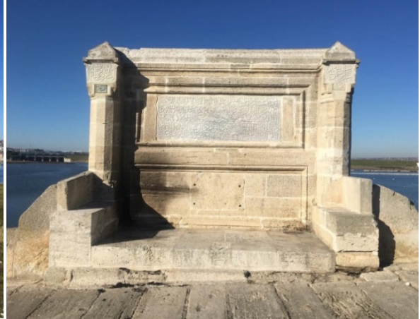
G.2. Köprü'nün Kitabesi (2022)