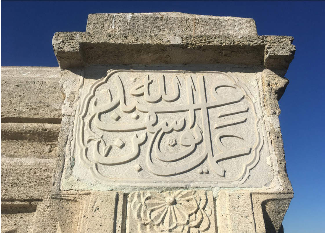
G.3. Amelü Yusuf bin Abdullah imzalı sanatkar kitabesi 11