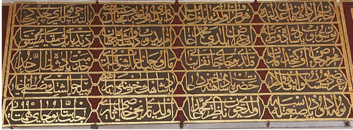
G.10. Mimarın adının geçtiği Mabeyn girişindeki koğuş kitabesi (2023)

Mimarın imzasına rastlanan bir başka yapı Topkapı Sarayı içinde yer alan 1586 tarihli 22 Zülüflü Baltacılar Koğuşu'dur. Bir kitabede mimarın adı doğrudan verilirken (G.10) diğ erinde ise mimarın ismine atıfta bulunulmuştur (G.11). Hem koğuş hem de tamir kitabesinde adı geçen Dâvud Ağa'nın saray içerisinde rastlanan başka imzası -şimdilik- yoktur.