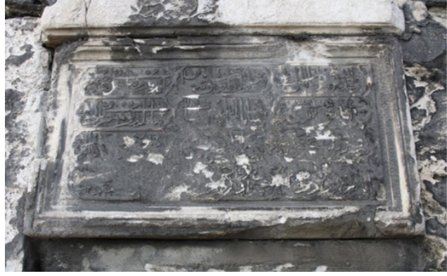
G.7. Çeşme üzerinde yer alan kitabe (2011)