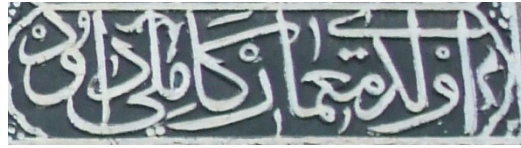
G.5. İnşa kitabesi ve mimar adının geçtiği bölüm (2011)