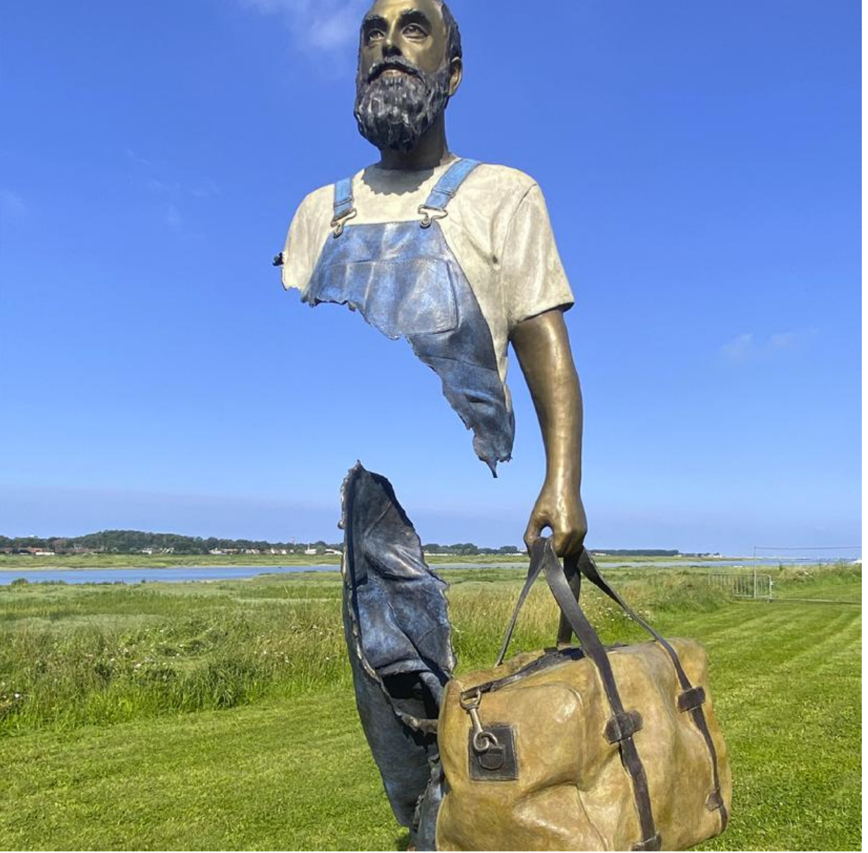
R.12: Bruno Catalano'dan Raphael Heykeli