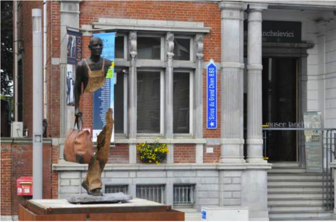
R.10: Bruno Catalano, "Blackman (Siyah Adam)", 210x83x93 cm, Sculpture en bronze, MiLL, La Louvière (Bruxelles, Belgique), 2015 (Dossier Artistique- Bruno Catalano, (t,y): 1-14)

"Blackman" heykeli, özellikle köklerinden koparılmış tüm zencilere bir ithaftır. Burada, tüm göçmenlere ve göç edenlere bir saygı duruşu söz konusudur (R.10) (Dossier Artistique- Bruno Catalano, (t,y): 1-14) Bu yalnız gezgin, kendisine kucak açmış ufka doğru ilerler ama bu gönüllü bir ilerleyiş midir, onu ne beklemektedir? Sürgünün acısı geçer mi? Gittiği yer vatani midir artık, kimliğini kaybedip tekrar bulabilecek midir? Her sürgünde bir parça eksilmez mi? Her neyse kafanız karışincaya kadar kaybolun.... (Articolo 16, (t,y): 199-201; Napolitano, 2014).