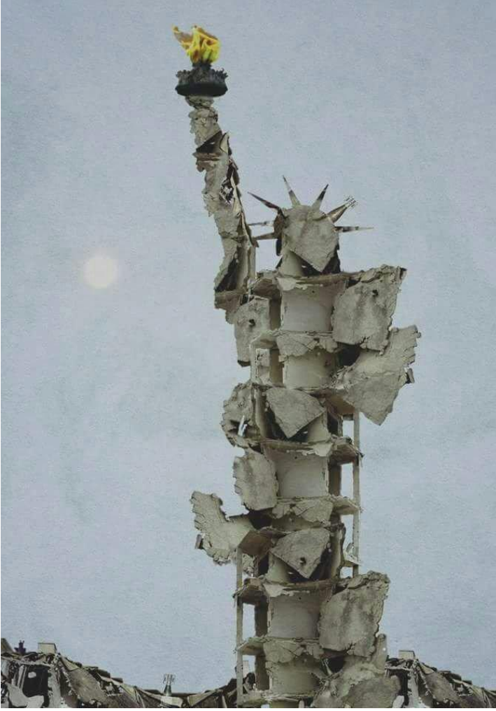
R.3: Tammam Azzam, "Özgürlük Heykeli" ( https://davetmektebi.com/bir-sessiz-ciglik-suriyeli-tammam-azzam/ ).

Heykel sanatçısı Bruno Catalano, Sicilya kökenli olarak Fas'ta doğmuş ancak ailesi ile birlikte sürgüne maruz kalmış ve sevdiği topraklardan ayrılmak durumunda bırakılmış bir sanatçıdır. Bu, onun hayatının dönüm noktası olarak kalacak ve sürgüne maruz kalan, vatanlarını terk eden/ettirilen tüm kimlikten insan figürlerini kullanarak sanatına yansıtacaktır. Anılar, acılar ve yeni yerlere adapte olabilme sorunlarını yansıttığı heykelleri, "göç" temasını içermektedir. Heykellerinde, gidilen her yerde geride kalanlardan bir parça eksilmiş ve "eksik bırakılmış heykeller" adını da alan çalışmalar ortaya çıkmıştır. Bu ana orijini içeren çalışmalar, özellikle "Gezginler" isimli bir seri çalışma olarak sanat tarihinde yer bulmuştur (Çetin, 2020: 31) Catalano gibi göç teması ve savaşları içeren çalışmaları ile Afroamerikan sanatçı Jabos Lawrence, "Gösteren" olarak heykellerin yerine resimleri tercih eden örnek bir diğer sanatçıdır ( https://kontrastdergi.com/gulser-gunaydin-bunlar-da-var-jacob-lawrens-54-sayi/ ) (R.4-5).