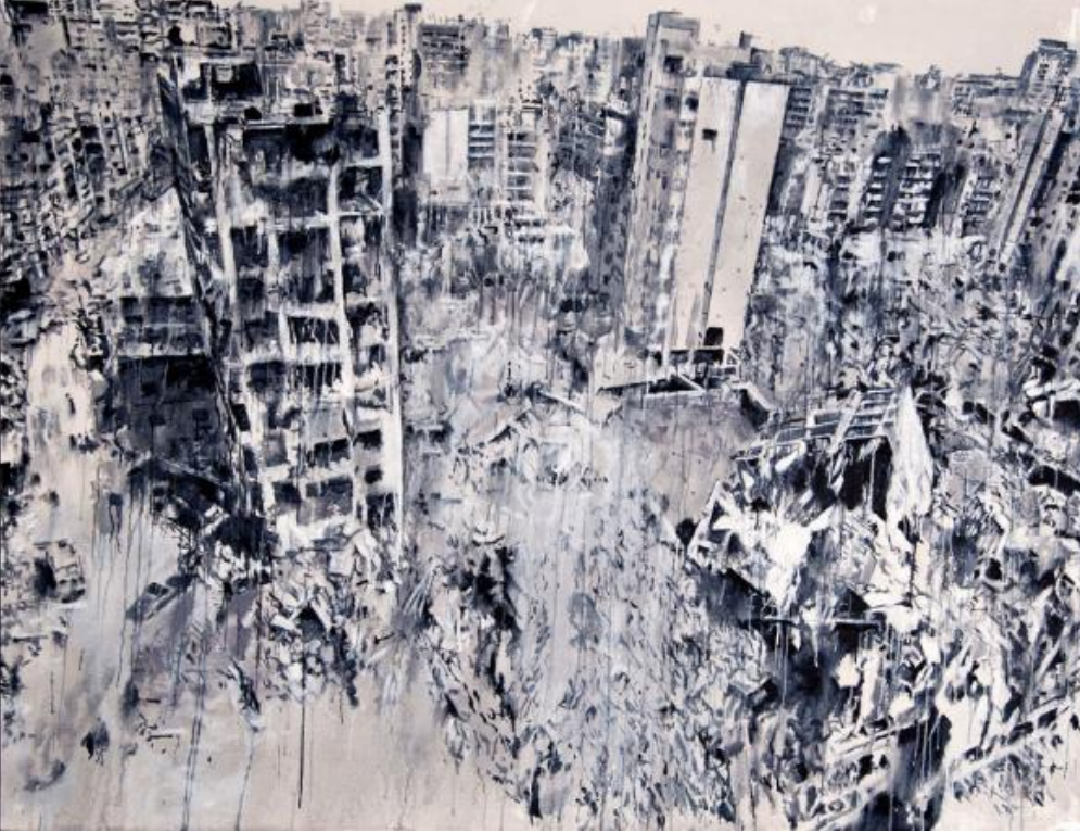
R.2: Tammam Azzam, "Storeys" ( https://www.pbs.org/newshour/arts/exiled-syrian-artist-tammam-azzam-paints-haunting-images-of-his-destroyed-homeland )

Sanatsal açıdan göç temasına değinilirken, zaman ve mekân kavramları iç ve dış göçler, göçün getirdikleri ve götürdükleri ele alınan temalar arasındadır. Bu anlatılar kimi zaman performans gösterileri ile, kimi zaman mekânsal sıkıntılarının oluşturduğu kent, kentleşme ve gecekondulaşma gibi temalarla görselleşir, hatta video sanatı ve fotoğraf sanatıyla da kalıcılığı sağlanır. Ayrıca göç’ün getirisi olarak “mülteci” kavramı sıklıkla temalaşan konular arasına girer (Mollaoğlu, 2023: 315-332; Uyar, 2021:221).