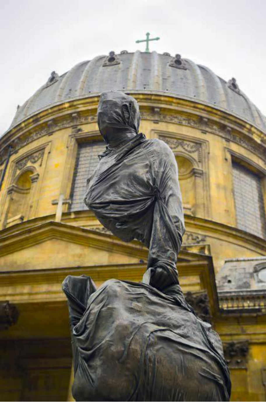
R.8: Bruno Catalano, "Sonsuz Örtü" , 300x150x130 cm- Sculpture en bronze, Paris 2020 (Dossier Artistique- Bruno Catalano, (t,y): 1-14).

Bütün silueti bir örtü ile kaplanan, görünmez, tespit edilemez ve kafa karıştırıcı bir heykel çalışmasıdır "Sonsuz Örtü" (R.8). Bu sonsuz örtü aslında tam da sonsuzluğun temsilidir. Hayaletimsi görünüm de buna eşlik eder. Bitmemişlik duygusunu ve yansıtılan estetiği anlatmaya gerek kalmaz. Esere kimi kaynakta "Non Finito (Bitmemiş)" denmesinin sebebi de bu olsa gerektir (Dossier Artistique- Bruno Catalano, (t,y): 3; Decraene, (t,y): 20-23).