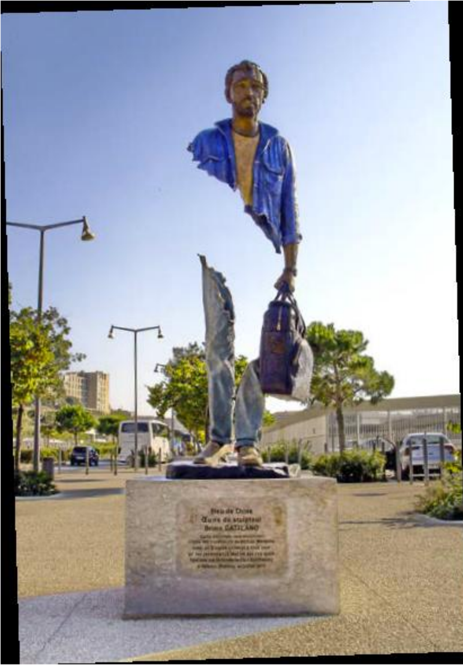
R.7: Bruno Catalano, "Çin Mavisi", 304x125x116 cm-Sculpture en bronze (Dossier Artistique- Bruno Catalano, (t,y): 3).

Heykelindeki işçinin tulumundan yola çıkarak adlandırdığı "Çin Mavisi", Çin ülkesinden Marsilya'ya gelmek durumunda kalan insanlara ithaf edilmektedir. Denizciler ve liman işçileri , sevdiği temalar arasındadır (Dossier Artistique- Bruno Catalano, (t,y): 1-14) (R.7).