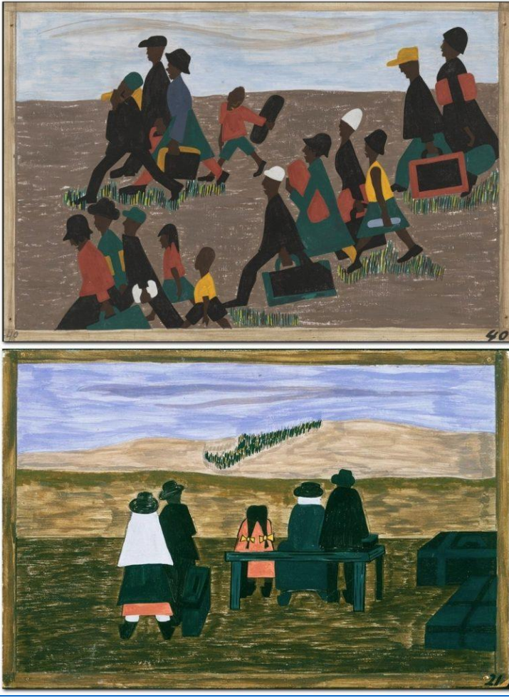
R.4: Jacob Lawrence, "The Migration Series" ( https://kontrastdergi.com/gulser-gunaydin-bunlar-davar-jacob-lawrens-54-sayi/ )