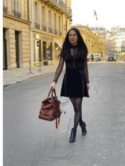
R. 13: Sosyal Medyadan İlginç Bir Deneyim...Hayalinizde Tamamlayın... Ve Kalbinize Yakın Bir Çanta ile "Yolculuk" Görünümünü Taklit Edin.