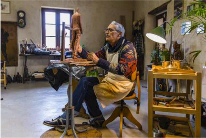
R.6: Catalano Atölyesinde (Dossier Artistique- Bruno Catalano, (t,y): 2).

Kent meydanlarını süsleyen sanatçının çalışmaları göçü yaşayanların, mültecilerin acısını ve hüznünü dilsiz tanıklar olarak insanlara aktarmayı amaçlamaktadır. Ona göre de hayat yolunda aslında herkes birer yolcudur. Bazen kendi içimizdir bu yolculuk, bazense dışarıya (Uyar, 2021: 29).