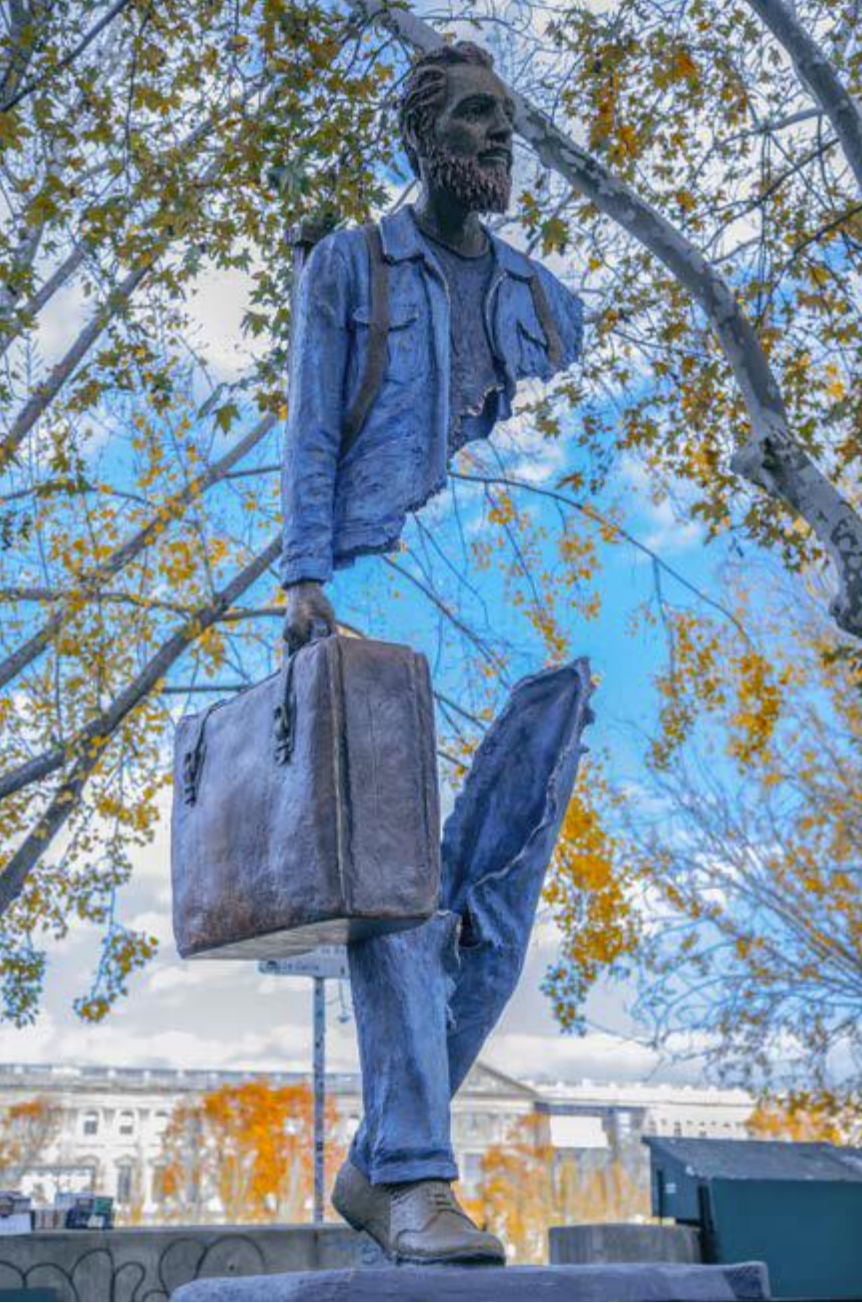
R.9: Bruno Catalano, "Van Gogh", 411x160x170 cm - Sculpture en bronze, Paris (Dossier Artistique- Bruno Catalano, (t,y): 4; Articolo 16, (t,y): 199-201).

Sanatçının Gezinler serisinin en önemli parçalarından "Van Gogh", Catalano'ya kendi yolculuğunda duygusal olarak arkadaşlık etmiş ve sevdiği bir sanatçı olarak bilinmektedir (R.9). Van Gogh, kendini belli edercesine, bir çanta dışında tuvalini de taşımaktadır. Peki neden Van Gogh? Onun yırtılan kulağı ile heykellerdeki eksiklik veya noksanlık benzeşmesi mi? Ve kendi gibi onun da yaşadığı ızdıraplı bir hayat yolculuğu mu? (Dossier Artistique- Bruno Catalano, (t,y): 5).