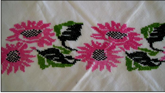
Fotoğraf 7. Kanaviçe yastık kılıfından detay (Meryem Salcı, Bursa)

Kanaviçe ürünlerin kompozisyon düzenlenmelerinde genellikle ulama adı verilen kompozisyonların kullanıldığı görülür (Fotoğraf 7). Özellikle yastık, karyola eteği, yorgan kapağı gibi parçalardan oluşan yatak takımlarında motiflerin kenara paralel olarak baştanbaşa işlenmesi Anadolu'da bir gelenektir. Ulama kompozisyonlar motiflerin aralarında boşluk bırakılmadan birbirine bitişik bir sıra izlenmesi ile oluşturulur.