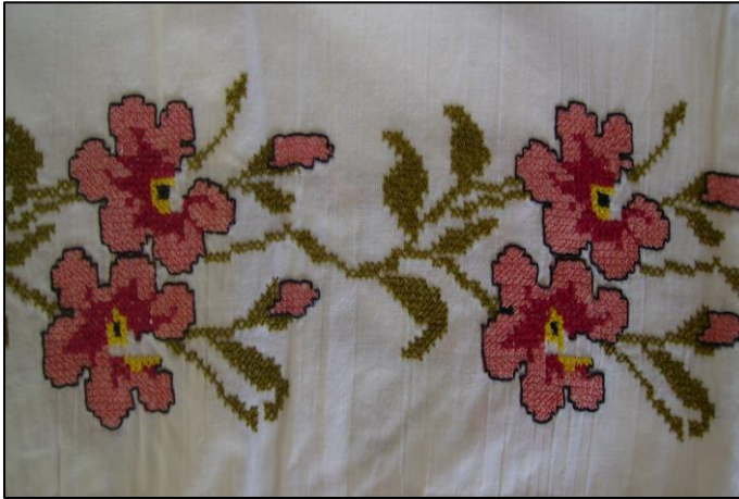
Fotoğraf 4. Kanaviçe yastık kılıfından detay (Meryem Salcı, Bursa)

Anadolu coğrafyasında Türk toplumunun gelenek ve göreneklere göre yeni bir kimlik kazanan kanaviçe, geleneksel işleme sanatımız içerisinde önemli bir yere sahiptir. Türk kadın ve genç kızları tarafından uygulanan kanaviçe örnekleri, Avrupa kaynaklı örneklerden kullanım alanı ve amacının yanı sıra işlemede kullanılan renk, bezeme konusu, kompozisyon özellikleri, kenar temizleme ve süslemede teknikleri bakımından da oldukça farklıdır.