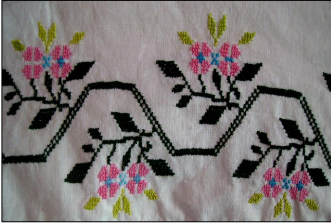
Fotoğraf 9. Kanaviçe sandık örtüsünden detay (Fikriye Can, Bursa)