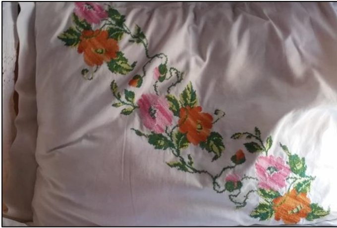
Fotoğraf 6. Afyon halk işlemlerine ait kanaviçe yastıktan detay (Afyon Mevlevi Konağı)

sahip kırlentler de bu grupta yer alır. Patıska kumaşından hazırlanan bu yastıkların uzun olanlarının iki dar kenarı, kısa olanlarının bir dar kenarı, kırlentlerin ise orta merkezden geçerek çapraz biçimde yerleştirilen işlemelerle süslediği görülmektedir (Fotoğraf 6). Ancak bugün uzun yastıkların ve kırlent yastıkların yapımının Anadolu’da azaldığı yerini daha çok kısa yastıklara bıraktığı öğrenilmektedir (Çelebilik, 2016: 13). Üzüntü verici bir diğer durum ise geleneksel yapının bozulduğu yerlerde kanaviçe işlemelerin farklı kullanım amaçlarına yönelik olarak yeniden şekillendirilmesidir. Günümüzde kullanılmayan ve sandıklarda saklanan karyola etekleri, yastık örtüleri geleneksel kullanım amacının dışında işlemeli kısımları kesilerek pike, oda takımı, mutfak takımı gibi farklı eşyalara dönüştürülmektedir (Sönmez, 2016: 891).