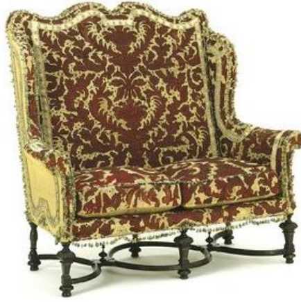
Fotoğraf 1. Victoria & Albert Müzesi / Museum Number W.15:1 to 3-1945 / (1690-1700 made)

http://collections.vam.ac.uk/item/O9899/settee