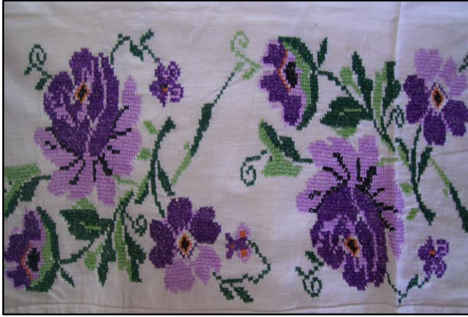
Fotoğraf 2. Kanaviçe yatak takımından detay (Şükriye Kula, Afyon)

iğnelerden birisidir (Barışta, 1997: 45). Özellikle 20. yüzyılda uygulaması kolay veya az iplik kullanılarak yapıldığı için en yaygın uygulanan iğne teknikleri arasında yer almıştır (Barışta, 1995: 90). Aslında bu türden sayılı iğneler arasında sayılan ve işleme tekniği olarak kanaviçenin ilk sırasına benzeyen Slav iğnesinin ve goblen iğnesinin ilk örnekleri 16. Yüzyıl saray parçalarında görülmüştür (Barışta, 1995: 22). Her iki iğne de 17. Yüzyılda bir önceki yüzyıla göre artış göstermiştir (Barışta, 1995: 66). Ülkemizde özellikle 20. Yüzyıl işleme teknikleri arasında en yaygın uygulanan iğneler arasında kanaviçe bulunmaktadır. Yapılan araştırmalarda kanaviçenin özellikle Ankara-Beypazarı, Mersin-Tarsus, Konya-Hadim, Ankara-Ayaş, Afyon-Emirdağ, Adana-Örcün gibi il merkezlerine yakın ilçelere ve köylerine kadar geniş bir alanda uygulandığı ortaya çıkmıştır (Fotoğraf 2) (Barışta, 2005: 212).