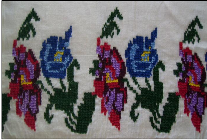
Fotoğraf 5. Kanaviçe yatak takımından detay (Şükriye Kula, Afyon)

Anadolu kültüründe kanaviçe işlemler özellikle çeyiz geleneğinin vazgeçilmez parçaları arasındadır. Bu durum gelin adayının çeyizinde bulunan eşyaların üzerine yaptığı işlemlerle bu ürünleri süslediği ve böylece daha gösterişli hale getirip, zevkle kullanabilme özelliği kazandırmayı amaçladığı şeklinde açıklanabilir. Nas (2012: 1621) Konya yöresinde çeyiz kültüründe yaygın olarak yer alan el sanatı ürünleri arasında kanaviçelerin önemli yer tuttuğunu ve kanaviçelerin gelin için hazırlanan yastık kılıfı ve yorgan kapağına uygulandığını belirtmiştir. Bugün Anadolu'da geleneksel yapının korunduğu yerlerde kanaviçe yatak takımlarının hem işlenmesine hem de kullanılmasına devam edilmektedir (Fotoğraf 5). Çeyiz hazırlama geleneğinin önemli parçası olan kanaviçe yatak takımları bu sanatın adeta devamlılığını sağlamıştır.