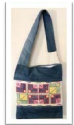
Şekil 1. Yaneş

Şekil 1’de görülen ürün, atık malzeme olan eski kot pantolon paçası ve çuval bezi kullanılarak üretilmiştir. Atık malzemeler bir önceki işlevinden çıkarılarak, farklı kullanım alanına sahip yeni bir ürün oluşturulmuştur. Eski kotun geri dönüşüm malzemesi olarak kullanılması, çuval bezinin atık malzemeden ana malzemeye dönüşmesi ve yaneş işlemenin çantanın gövdesini oluşturacak şekilde kullanılması, hem yenileşime hem de sürdürülebilir tasarıma örnektir. Çanta üzerinde yer alan süsleme Milas ilçesi Çomakdağ Köyü kadın giyiminde şalvar örgesi olan yaneş işlemeden alınmıştır. Çomakdağ-Kızılağaç Köyü kadınları bugün hala günlük yaşamlarında da, kutlamalarında da geleneksel giyimlerinden vazgeçmemiştir. Yaneş işleme bu giyimde önemli süsleme unsurlarından biridir. Örnekte yöre kimliğini taşıyan el sanatı ürünü yaneş işleme örge ve renk olarak öz hali ile kullanılmış; işleme tekniği ve kullanım alanı değiştirilmiştir. Bu turistik hediyelik eşyanın üzerinde taşınması gereken kimlik kartı örneği aşağıdaki gibidir (Çizelge 1).