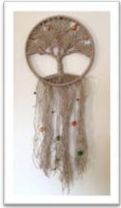
Şekil 2. Portakal Ağacı

Şekil 2’de görülen ürünün, nakış kasnağı, jüt ip ve farklı renk ve büyüklükte ahşap boncuklar kullanılarak yapılmıştır. Atık konumunda olan kasnak ve boncuklar yeniden kullanılarak hem yenileşime hem de sürdürülebilir bir tasarıma ulaşmak amaçlanmıştır. Örnekte Makrome düğüm uygulamalarından birkaç tanesi bir arada