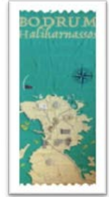
Şekil 9. Bodrum Haritası

hareketliliğinin yoğun olduğu alanlarda gerek şehrin kültürel değerlerini gerekse turistik hediye eşya satışı yapan işletmenin bulunduğu alanları gösteren bilgilendirme haritalarının konulması gerekmektedir. Şekil 9’da görülen tasarım bu istekten ve eksiklikten yola çıkılarak hazırlanmıştır. Yaz aylarında en çok kullanılan ürünlerden biri peştamaldır. Daha az yer kaplaması, hafif oluşu ve hızlı kuruma özelliğine sahip olması ile son dönemin en çok tercih edilen sahil ürün olan peştamal üzerine baskı uygulayımı kullanılarak hazırlanmıştır. Bodrum’a ait sahil, kültürel kalıt, müze gibi yerlerin gösterildiği harita üzerinde ziyaret edilen yerlerin işaretlenmesi için küçük kutucuklar konmuştur. Kullanıcılar için ziyaret edilen yerler açısından hem hatırlatıcı hem de gidip görme isteği uyandırması açısından teşvik edici olabilecek bu ürünün üzerinde taşınması gereken kimlik kartı aşağıdaki gibidir (Çizelge 9).