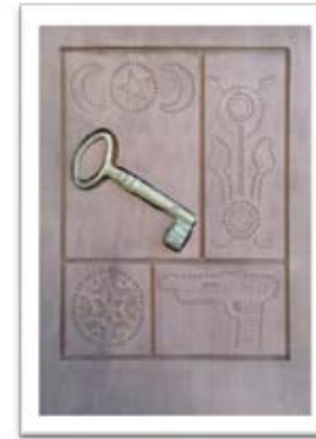
Şekil 5. Muğla Kapısı Pano

hatıl ve lentolar, haç planlı bacalar, kuzulu kapılar, kapı tokmakları yöresel özellikler taşımaktadır (Adalı, t.y., www.akademiktarih.com, [15.03.2015]). Ancak Muğla evleri gibi kapılarda modern ev mimarisi karşısında önemini yitirmekte ve yok olmaktadır. Her ne kadar Muğla Akya’da yöresel ev mimarisi canlandırılmaya çalışılsa da, bu yapılanma tüm bölgeye yayılmadığı için geleneksel Muğla evleri tüm yapı ve süsleme öğeleri ile unutulmaya yüz tutmuş durumdadır. Bu yapıların önemli bir ögesi olan kapılar ve bu kapıların süslemelerin de sahip çıkılması kadar tanıtılması da önemlidir. Bu turistik hediyelik eşyanın üzerinde taşınması gereken kimlik kartı örneği aşağıdaki gibidir (Çizelge 5).