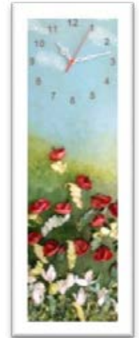
Şekil 6. Muğla Çiçekleri

Şekil 6’da görülen çalışma Muğla ili endemik bitkilerinden esinlenilerek tasarlanmıştır. Çalışma üzerindeki çiğdem çiçeği, ismini yöreden alması ile önemlidir. Fethiye çiğdemi ve yörede gelincik çiçeği olarak bilinen lale, duvar saati üzerinde düzenlenmiştir. Çiçeklerin yapımında yörede yetiştirilen ve işlenen ipek böceği kozaları kullanılmıştır. Çiçeğin formuna göre taç yapraklar kesilip, fabrikasyon toz kumaş boyası ile renklendirilmiştir. Çiçek teli üzerinde sarılarak sabitlenen çiçekler, ahşap boyası ile boyanan duvar saati kasası üzerinde düzenlenmiştir. Çiçek yapımında toz tutmaması, yıpranma hashlığının yüksekliği, kolay şekillendirilmesi ve şeklini uzun süre koruyabilmesi özellikleri yanında, yörede yetiştirilmesi nedenleri ile ipek kozası tercih edilmiştir. Sarı renkte ya da dokumaya uygun olmayan atık kozalardan yapılacak bu tür tasarımlar atıl durumda olan kozaların değerlendirilmesi ve dönüştürülmesiyle artı bir değer oluşturacaktır. Aynı zamanda Muğla ilinde yetişen endemik bitkilerin kendisini kullanmak yerine onların hem zarar görmesini engellemek hem de tanıtımını yapmak için aslına uygun olarak yeniden üretilen tasarımlar ile turistik hediyelik eşya pazarına kazandırılması yararlı