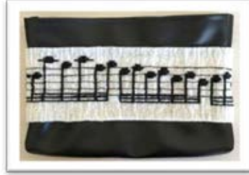
Şekil 8. Kerimoğlu Türküsü

Yaşadığı dönemde halkına sahip çıkan Kerimoğlu’na vefatından sonrada yöre halkı sahip çıkmış ve anısını bu türkü ile nesillere taşımıştır. Muğla düğünlerinde bu zeybeğin mutlaka birkaç kez çalınıp oynanması, Kerimoğlu’nun yaşatılmaya çalışılmasının bir göstergesidir. Şekil 8’de görülen çalışma tasarlanırken bu türkünün yöre halkı dışında ziyaret gelen kişilere tanıtılması amaçlanmıştır. Türkünün notaları 0,8 mm. boncuklarla dokunarak, çanta üzerine uygulanmıştır. Notalar aslının aynı olup hiç bir değişime maruz kalmamıştır. Bu çalışmanın üzerinde taşınması gereken kimlik kartı aşağıdaki gibidir (Çizelge 8).