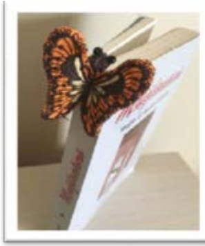
Şekil 10. Kaplan Kelebek