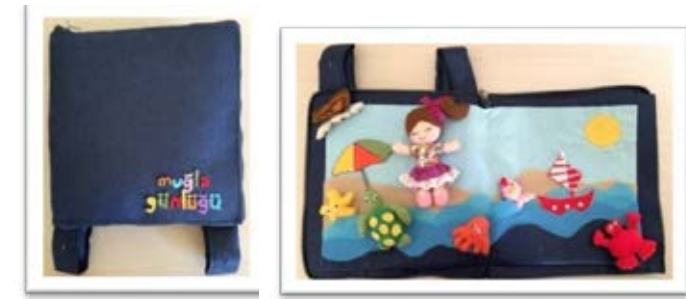
Şekil 3. Çantanın Kapalı Dış ve Açık İç Görüntüsü ile Oyuncaklar

yalnızca oyuncak değil, kendine ait yedek kıyafet vb. çok ağır olmayan eşyaları da taşıyabilecektir. Bu ürün teknoloji çağının, çocuklar üzerindeki kötü etkisi olan aşırı bilgisayar bağımlılığından onları uzaklaştırabilecek ve oyuncaklarla kendi yazdığı hikayeyi konuşturması ile hayal gücünü geliştirmesine yardımcı olabilecek niteliklere sahip bir çalışmadır. Kitabın sayfalarının yöre kimliğini taşıyan başka sahnelerle çoğaltılması bu becerilerin güçlendirilmesine daha da katkı sağlayabilir. Ayrıca Muğla ilini küçük yaşta ziyaret etmiş bir çocuk için oradan alınmış hediyelik turistik eşya olarak bir bardağın çok da hatırlatıcı ve yeniden gitme isteği yaratıcı bir özelliği yoktur. Çocuk için gezdiği yeri hatırlatan, kendi yaşamından bir kesit oluşturan, yöre kimliğini taşıyan ya da endemik unsurları öğreten, yeniden orada olma isteği oluşturan hem eğitici hem de eğlendirici oyuncak tasarımları yapılması çok daha yararlı olacaktır. Tez çalışması kapsamında gerçekleştirilen bu turistik hediyelik eşyanın üzerinde taşınması gereken kimlik kartı örneği aşağıdaki gibidir (Çizelge 3).