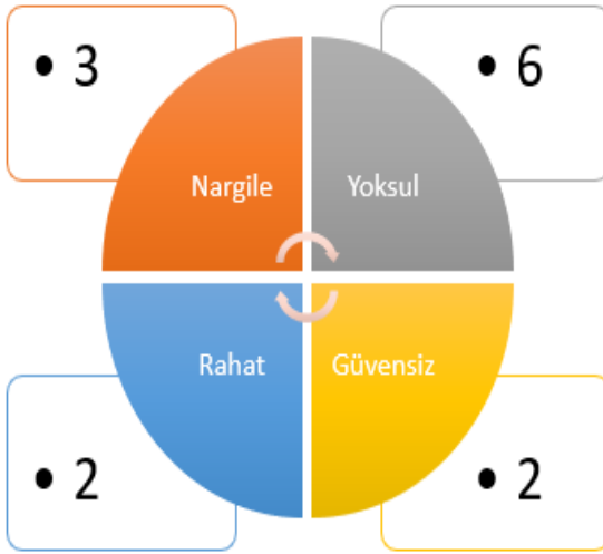
Şekil 2. Komşularının Gözünden Suriyeliler (Şanlıurfa)

Şanlıurfa'daki Türk katılımcılara sorulan Suriyelileri nasıl tanımlarsınız sorusuna verilen cevaplardan dikkat çekici semboller ve imgeler; "Nargile", "Yoksul", "Rahat" ve "Güvensiz" olsa da diğer ifadeler aşağıda verilmiştir;