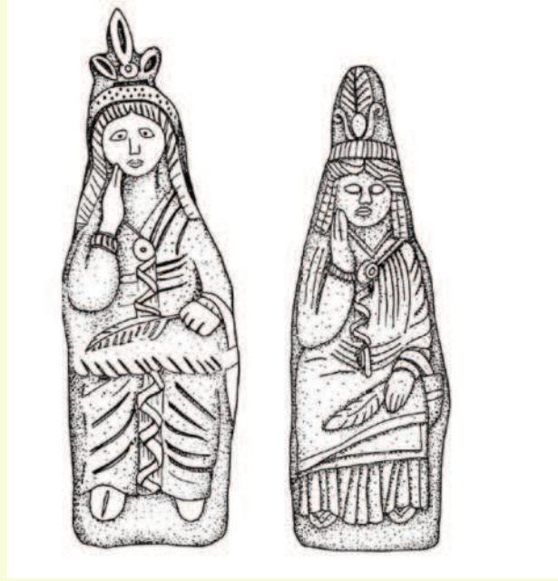
Şekil 3. Afrodit Anadyomen'e ait Pişmiş Toprak Figürleri