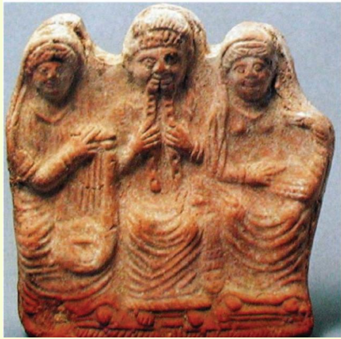
Şekil 1. Nabatî Müzisyenleri (Almasri 1997).

beş telli bir gitar çalarken, ikinci kadın telleri olan başka bir müzik aleti çalmaktadır (Şekil 1). 19 Bu, Nabatî kadınların erkek rahiplerle birlikte tapınakta çalıştığını gösterebilir.