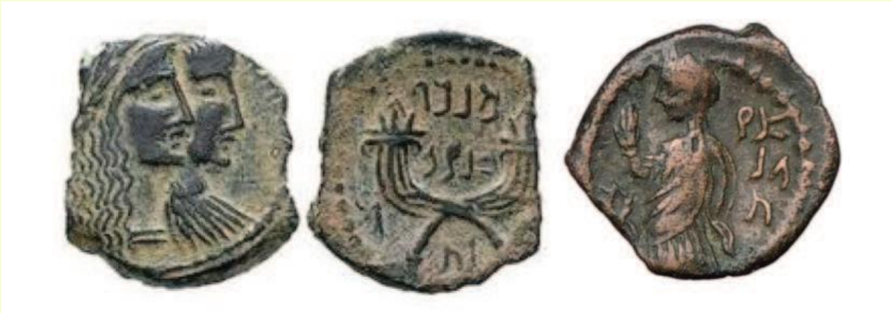
Şekil 2. Kraliçe Shaqulat'a Ait Sikkeler M.Ö. 9

Petra'daki ve diğer Nabatî şehirlerindeki birkaç Nabatî heykelinde yer alan farklı kıyafet ve takılar, sosyal sınıfların farklılığına işaret etmekteydi. Örneğin taç, Nabatî kadının yüksek sosyal konumunu temsil eden en önemli aksesuarlardan biri olarak görülmekteydi.