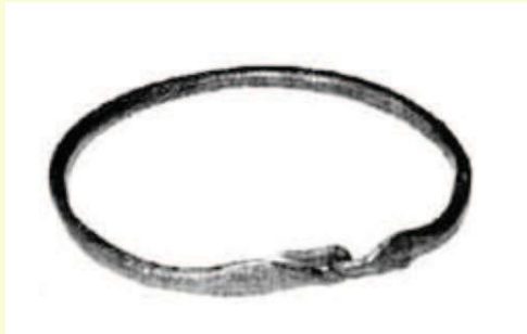
Şekil 5. Burun Halkası, Avdat (al-Musheisen vd.).