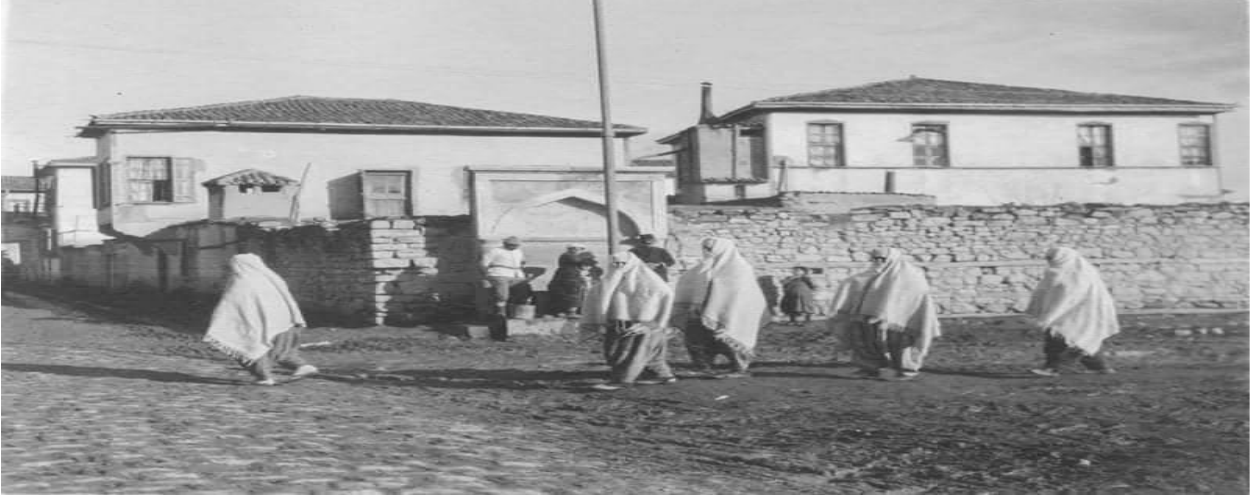
Resim 3. Osmanlı Devleti'nde Yaşayan Toplular