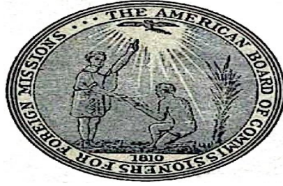
Resim 1. Amerikan Board'un Logosu(Kaynak: ABCFM Charter and By-Laws, 1922)

Okullarda verilen eğitimler çok üst düzeyde olduğu için tercih sebebi olmuştur. Bu okullardan mezun olan öğrenciler de iş bulma ve çalışma alanında zorlanmamış mutlaka bir iş kolunda istihdam edilmişlerdir.