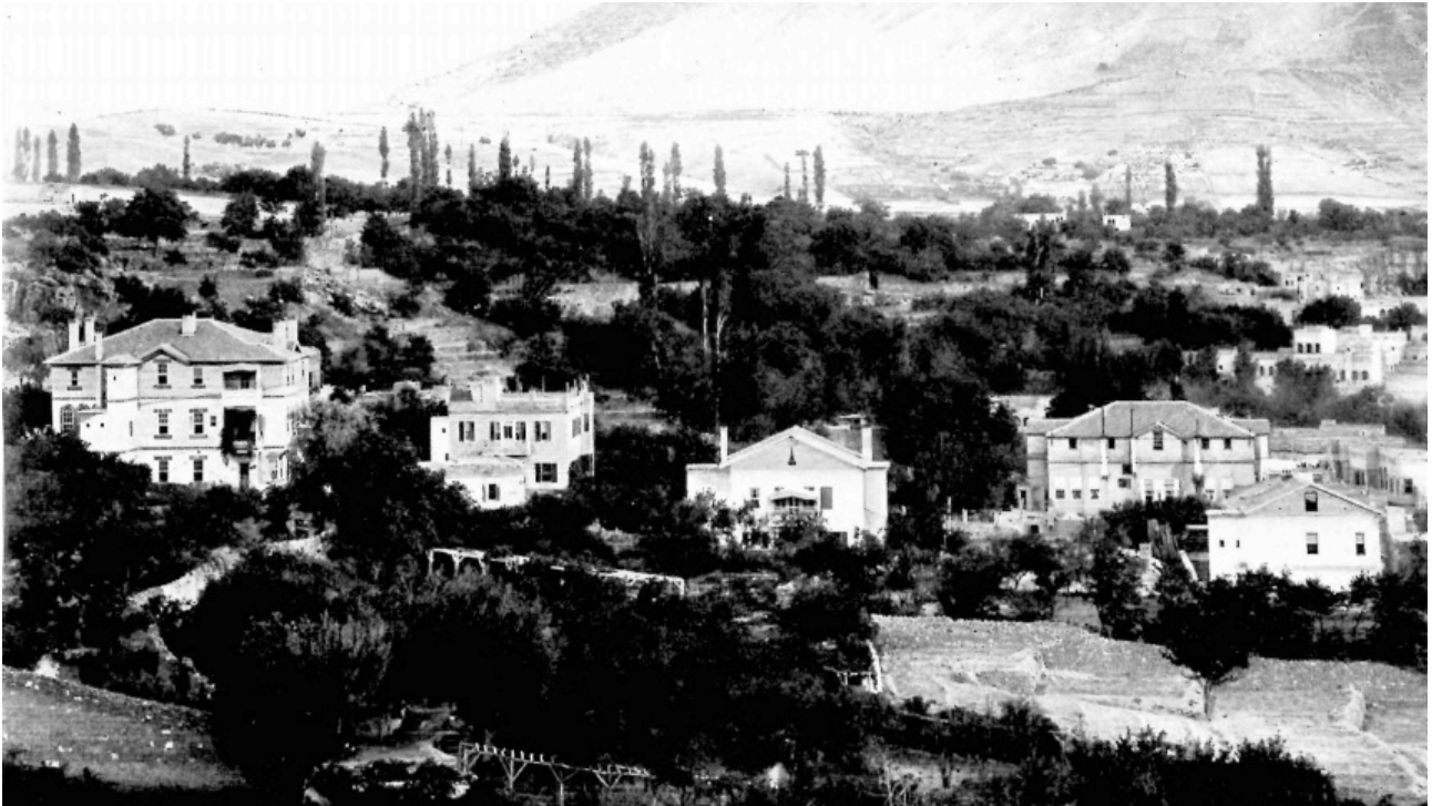
Resim 2. Talas Amerikan Koleji Yerleşkesi (Kaynak, Talas Amerikan Koleji, Kaynak: History Studies, 1922)

Bu bilgiler ışığında okulun tarihsel sürecinin ve gelişimine ne kadar önem verildiği gözükmektedir. Kaldı ki zaten açıldığında Osmanlı topraklarında ki en iyi ve modern bir okul olan kolej 1914 yılında tüm dünyayı kasıp kavuran ve etkileyen savaşla birlikte bazı faaliyetine son vermek zorunda kalmış ve okulun bazı faaliyetleri kesintiye uğramıştır. Savaş dönemi ve sonrasında ise; Amerikan Board'a ait bazı binalara ordunun ihtiyacına binaen el konulmuştur. Ayrıca mecburi olarak binalar Osmanlı halkına ait binalara çevrilmiştir. 1918 yılında savaşın sona ermesi ile birlikte içerisinde ise kolejin kızlara eğitim veren faaliyetine son verilmiştir. Ayrıca sonrasında erkek okulu 1967 yıllana kadar bazı bölümleri kapalı bazı bölümleri kısmı olarak hizmet vermeye başlamış, ancak 1967'de tamamen kapatılıp öğrencileri Tarsus Amerikan Kolejine nakledilmiştir. Bu süre zarfında ise bu boş kalan okul binaları, önce Kayseri Valiliği İl Özel İdaresine daha sonra ise Kayseri Beden Terbiyesi Bölge Müdürlüğü bünyesinde kullanılmak üzere verilmiştir. Günümüzde bu okullara ait bazı binalar Erciyes üniversitesinin bazı sosyal faaliyetleri gibi hizmet vermektedir (Akyüz, Y. (2011).