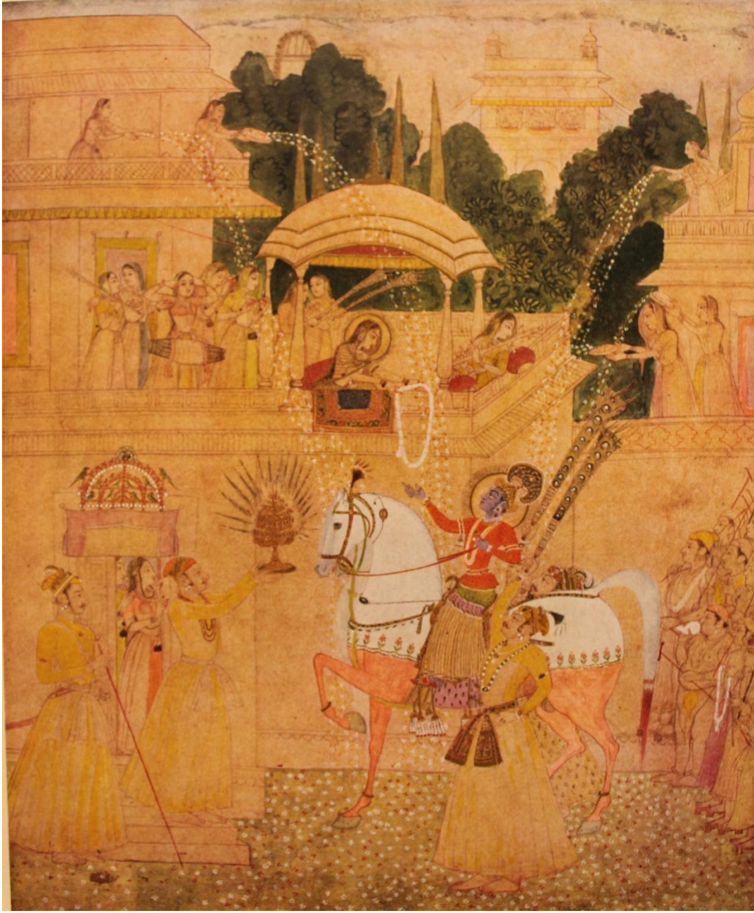
Rukmini - Harana Minyatürü