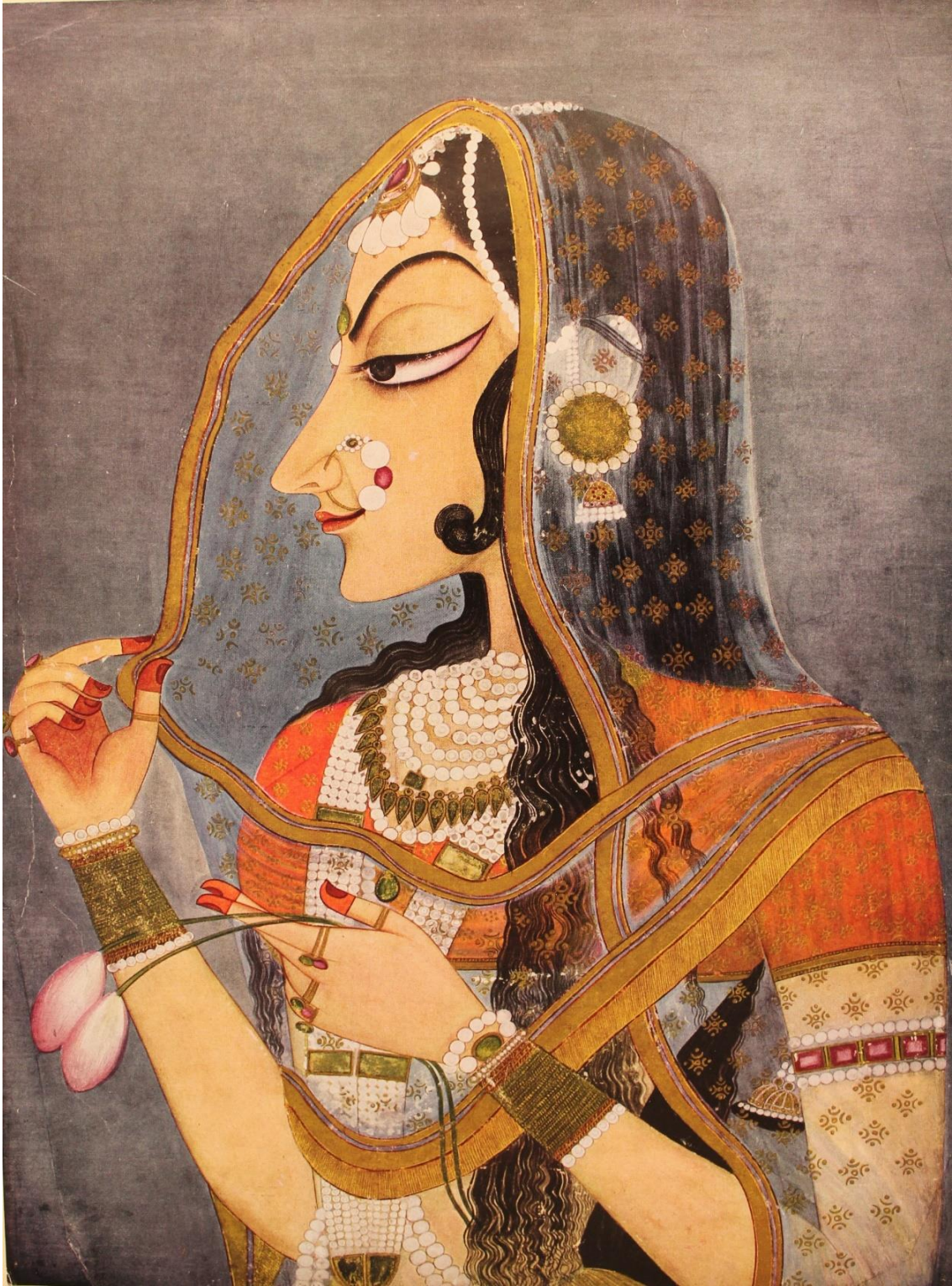
Radha (Bani-Thani) Minyatürü