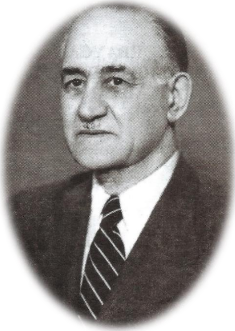
Mehmet Emin Resulzade

Resulzade, bir taraftan dünyanın dört bir yanına dağılmış olan Azerbaycan diasporasını tek bir siyasi örgütte birleştirmeyi başardı. Diğer taraftan halkın tarihi, kültürü ve edebiyatıyla ilgili çeşitli araştırmalar yapıp yayımlayarak vatanında başlattığı bağımsızlık mücadelesine yeni bir yön verdi.