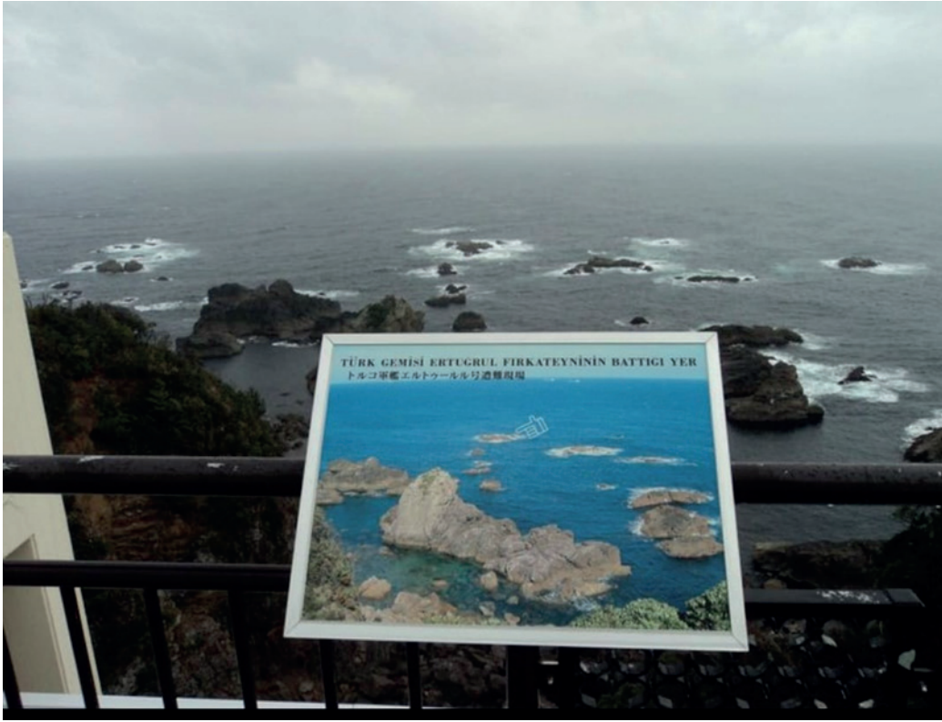
Fotoğraf 1: Ertuğrul Fırkateyni'nin Battığı Kıyı (Kushimoto/Wakayama).

Ertuğrul Fırkateyni'nin yaşadığı bu trajik hadise, Türk tarihinde derin bir üzüntü ile hatırlanmasının yanında iki millet arasındaki dostluk bağının kurulmasının da en büyük mimarı olmuştur. Bu dostluğun bir yansıması olarak Japon devleti, şehit olan Türk denizcilerin anısına kazanın yaşandığı Kushimoto'ya bir anıt ve yanına da Ertuğrul Fırkateyni Müzesi inşa ettirmiştir. Her yıl kazanın yıl dönümü olan 16 Eylül gününde Türk Büyükelçiliği personeli ve Japon yetkililer bu anıt önünde anma töreni düzenlemektedir. 7 Bu anma etkinliklerinden biri de İstanbul Erkek Lisesi ve kardeş okul protokolü imzaladığı Kushimoto Lisesi'nin katılımıyla 16 Eylül 2017 tarihinde gerçekleştirilmiştir. Fotoğraf 2'de söz konusu etkinlikten bir kesit gösterilmiştir.