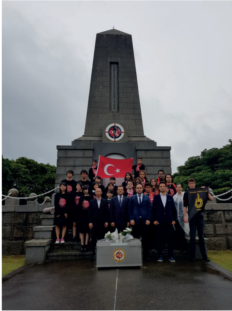
Fotoğraf 2: İstanbul Erkek Lisesi ve Kushimoto Lisesi Mensuplarının, Kazanın 127. Yıl Dönümü Münasebetiyle Gerçekleştirdikleri Anma Etkinliğinden Bir Görüntü-Wakayama

İki ülke arasındaki Ertuğrul Fırkateyni kaynaklı gelişen yakınlaşmanın yansımalarını farklı alanlarda gözlemlemek mümkündür. 1985 yılında İran-İrak savaşı nedeniyle Tahran'da mahsur kalan Japonların Türkiye tarafından tahliye edilmesi, Japonya'nın 2003 yılını Türk yılı; Türkiye'nin de 2010 yılını Japon yılı olarak ilan etmesi ve birçok Türk ve Japon şehrin birbirlerini "Kardeş Şehir" olarak tanımaları bu çerçevede verilebilecek belli başlı örneklerdir. 8