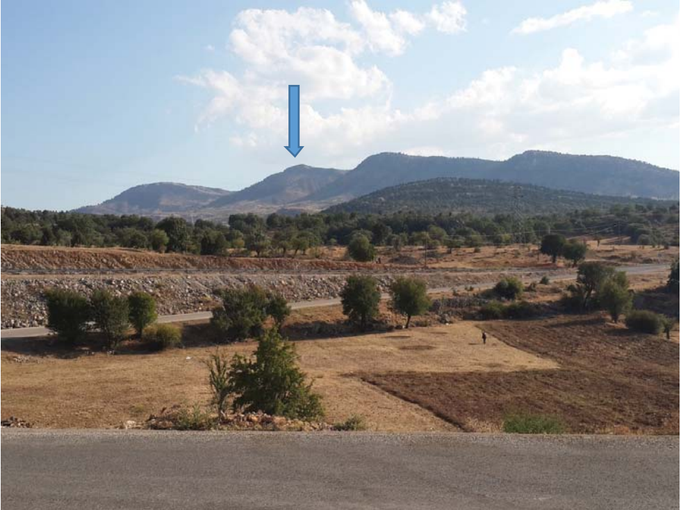
Levha. 2. Aydınkıřla'dan Isaura'ya bakıř.