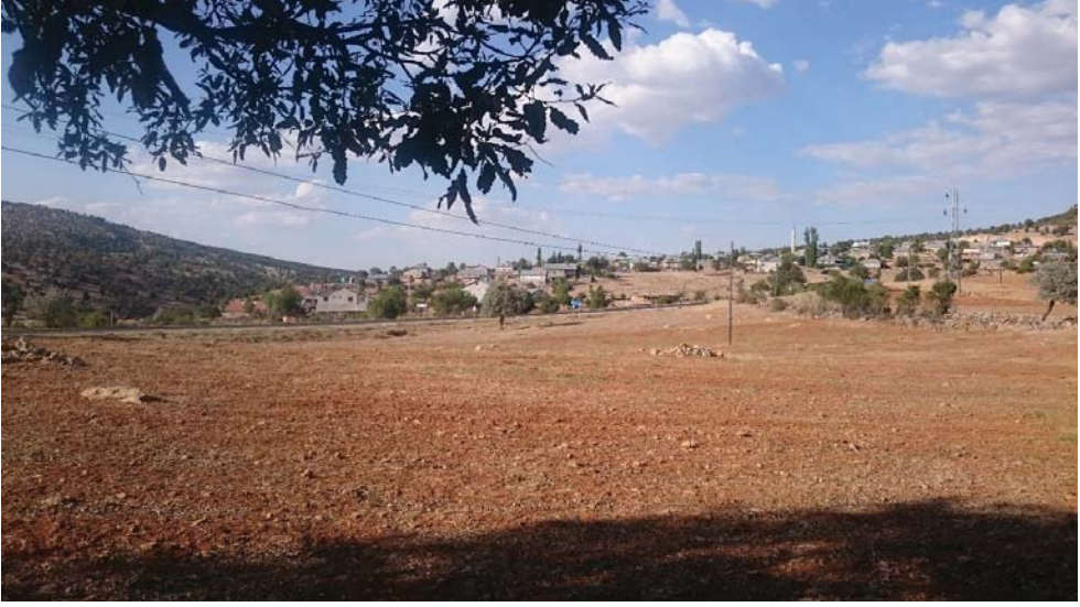
Levha. 1. Aydınkıřla Ky.