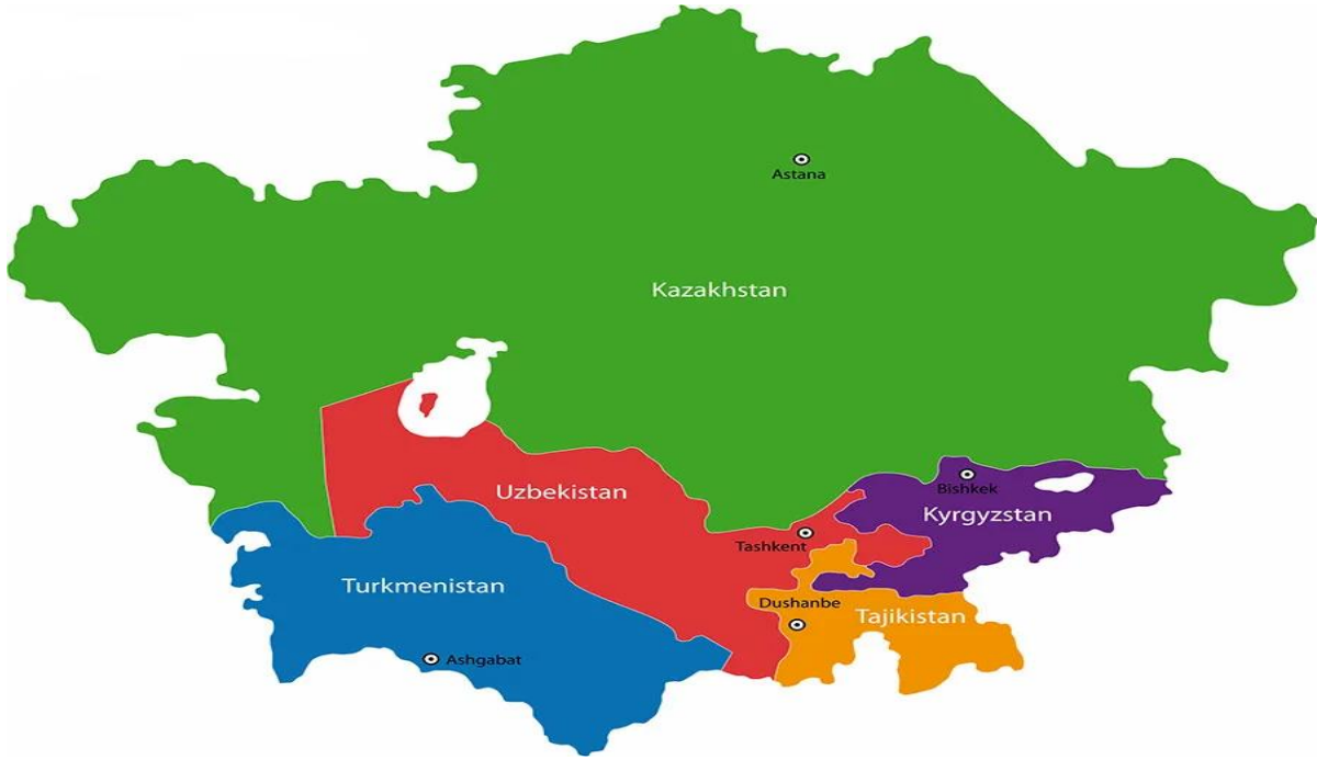
Şekil 1. Orta Asya Ülkelerinin Siyasî Haritası