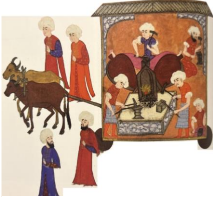
Resim 3: Süvrnâme-i Hümayûn , TSMK, H1344, 307a