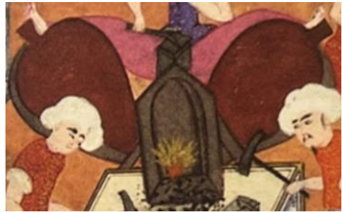
Resim 7: Sûrnâme-i Hümayûn , TSMK, H. 1344, 307a

Demirci ocağı, şiir dilinde de bu dayanıklılığı sebebiyle çeşitli unsurların benzetilene olarak ve genel olarak olumsuz çağrışımlarla yer almıştır. Vezîr-i Azam Mehmed Paşa'ya hâlini arz eden ve inayet bekleyen Azmizâde Hâletî, içinde bulunduğu durumu anlatırken