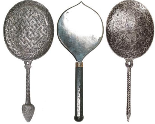
Resim 10: Sultanların Aynaları, 1998, s. 84, 87, 93

Cam aynalar yaygınlaşmadan önce aynalar tunç ve demir gibi metallere imal edilmiştir (bk. Resim 10). Demir (pûlâd/polat) aynalar sık sık cilalanıp parlatılmazlarsa hammaddeleri olan demirin paslanmasıyla yansıtma özelliklerini kaybedebilirlerdi. Edebî metinlerde ayna, çoğunlukla gönül ile ilişkilendirilmiştir. Bu durum, Allah'ın insan gönlüne tecelli ettiği inancıyla ilgilidir. İnanışa göre ancak kalbi temiz olanlar Allah'ın tecellisinin farkındadır, kalpleri günahla kirlenmiş olanlarsa bu tecellinin farkına bile varmaz. Bâkî'nin aşağıdaki beytinde de benzer şekilde âşık, sevgilinin kalbini aşk ateşiyle temizlenmemiş paslı bir demir aynaya benzettiği görülmektedir. Sevgilinin acımasızlığına işaret eden bu benzetmede âşık, sevgilinin yansıtma özelliğini kaybeden gönül aynasından vefanın görüntüsünün yansımadağını belirterek durumdan şikâyet etmektedir: