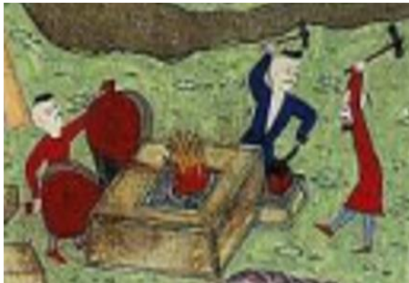
Resim 6: Seyyid Lokman, Zübdetü't-Tevârih , TSMK, H1321, 48b

Demirci dükkânının en önemli unsurlarından biri, demire şekil vermeyi mümkün kılan yumuşatma işleminin gerçekleştirildiği demirci ocağıdır. Bu ocak, içerisinde yıllarca ateş yandığı ve yıllar içinde pek çok kez demir ısıtılıp yumuşatıldığı hâlde kendisinin bir zarar görmemesi dolayısıyla dikkati çekmektedir. Osmanlı dönemine ait çeşitli resimlerdeki çizimlerden demirci ocağının dikdörtgen, altıgen, dikey silindirik gibi farklı formlarda yapıldığı görülmektedir. Aşağıda Seyyid Lokman'ın Zübdetü't-Tevârih 'inden alınmış olan ve İskender-i Zülkarneyn'in Yecüc ve Mecüc'e karşı set inşa ettirme sürecini tasvir eden resim (bk. Resim 6) ile Sûrnâme-i Hümayûn 'daki nalıncı (bk. Resim 7) ve bakırcı (bk. Resim 9) esnaflarının geçişini gösteren resimlerde farklı biçimlerdeki demirci ocakları etrafında çalışan ustalar görülmektedir: