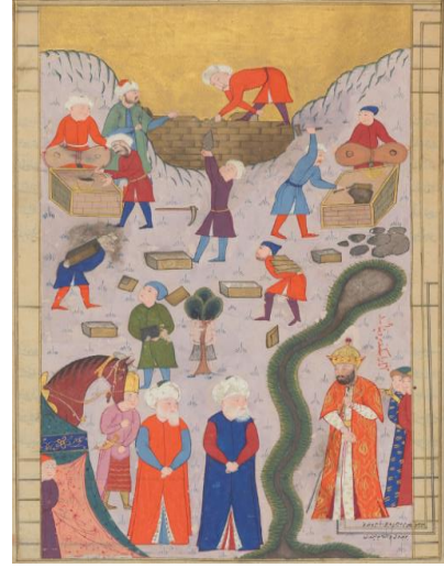
Resim 2: Seyyid Lokman, Zübdetü't-Tevârih , Chester Betty, T 414, 108a.

İslâm inancına göre demir, yeryüzüne Allah tarafından indirilmiştir. Nitekim Kur'ân-ı Kerîm 'deki Hadîd (demir) suresinde “Allah'ın açık delillerle peygamberler gönderdiği ve insanların adaleti yerine getirmeleri için beraberlerinde kitap ve mizan ile birlikte kendisinde büyük bir kuvvet ve insanlar için fayda bulunan demiri de indirdiği” ifade edilmiştir 4 . Bu ayette de demirin -yukarıda değinilen- kuvvetli olma, fayda sağlama ve adaleti temin etme işlevleri vurgulanmıştır. İslâm âlimleri ayette geçen “indirdik” kelimesinden ne anlaşılması gerektiğiyle, dolayısıyla demirin dünyada nasıl var olduğuyla alakalı farklı görüşler ileri sürmüşlerdir. Bu çerçevede demirin dünyanın yaratılışı sırasında sıvı hâlde gökyüzünde dolaşırken soğudukça yarıklardan yer altına indiği, esasen su kaynaklı olup yağın yağmurla birlikte gökten yere inerek toprağa karışıp katılaştığı, yıldız çekirdeklerinde üretilip göktaşlarıyla dünyaya geldiği, Hz. Âdem'le birlikte Cennet'ten indirildiği, aslında toprakta bulunduğu ve Allah'ın insanlara onu işlemeyi öğrettiği gibi çeşitli yorumlar söz konusudur (Ayrıntılı bilgi için bk. Gezer, 2006; Sülün, 2009; Duran, 2012; Eker, 2022). XIV. yüzyıl şairlerinden Ahmedî, kılıç ve kalemin münazarasını işlediği bir şiirinde yukarıdaki ayetin lafzına yer vermiştir. Kılıç, söz konusu şiirden alınmış olan aşağıdaki beyitte hammaddesi olan demirin Kur'ân-ı Kerîm 'de zikredilmiş [ enzelne'l-hadîd (biz demiri indirdik) ] olmasıyla övünmektedir 5 :