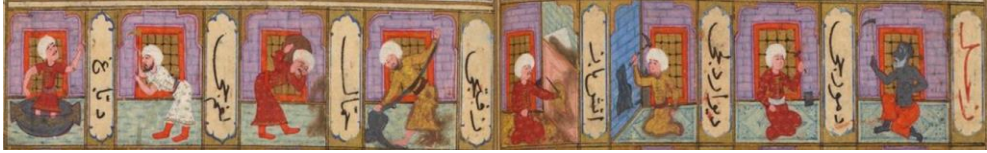
Resim 1: Suûdî, Metâlî'ü's-Sa'âde ve Yenâbi'ü's-Siyâde , Bibliotheque Nationale, Supplément Turc 242, vr. 32b-33a.

Suûdî'nin Metâlî'ü's-Sa'âde ve Yenâbi'ü's-Siyâde adlı resimli fal kitabında demircilik; duvar delici, ateşbaz, ziftçi, hammal, lağımçı ve debbağ (derici) ile birlikte Zuhâl (Satürn) gezegeni ile ilişkilendirilmiştir.