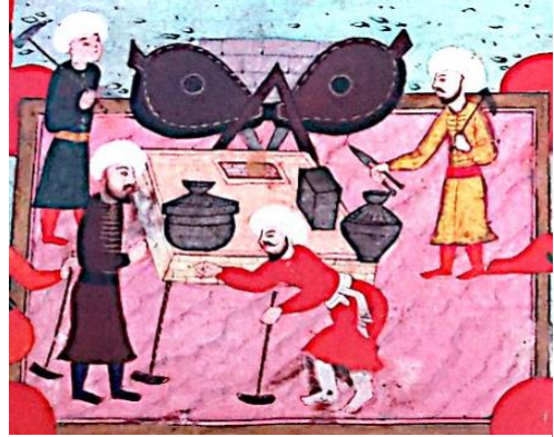
Resim 4: Süvrnâme-i Hümayûn , TSMK, H1344, 255a

Suûdî'nin Metâlî'ü's-Sa'âde ve Yenâbi'ü's-Siyâde adlı resimli fal kitabında demircilik; duvar delici, ateşbaz, ziftçi, hammal, lağımçı ve debbağ (derici) ile birlikte Zuhâl (Satürn) gezegeni ile ilişkilendirilmiştir.