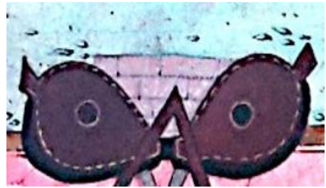
Resim 8: Sûrnâme-i Hümayûn , TSMK, H1344, 255a

Demirin işlenebilmesi için yumuşaması, yumuşayabilmesi için de yüksek sıcaklıktaki ateşte belirli bir süre ısıtılması gerekir. Bunun için demirci ocağında yanan ateşin önce istenilen sıcaklığa ulaşabilmesi, sonrasında da demirci demire şekil verene kadar uzunca bir müddet aynı sıcaklıkta kalması önemlidir. Zira ısınması uzun süren demirin şekillendirilmesi de uzun zaman almakta, bu süreçte metalin tekrar tekrar ısıtılıp dövülmesi gerekmektedir. Yukarıda