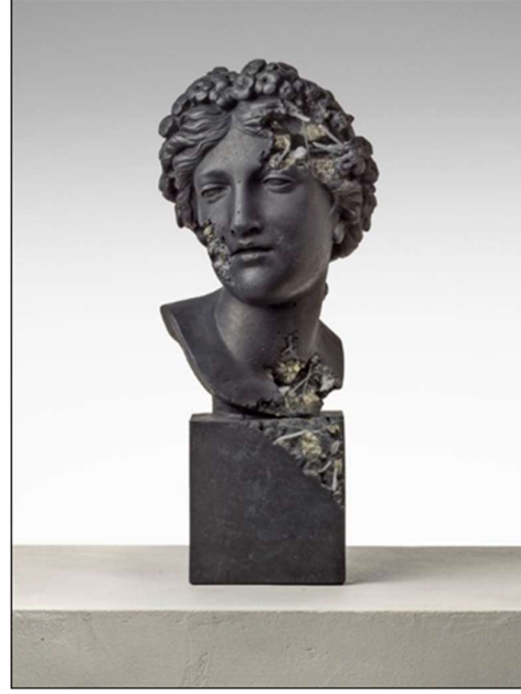
Görsel 9. Daniel Arsham, Bronze Eroded Bust of Rome Deified , 2021, bronz ve paslanmaz çelik, 199x133x104 cm (sol) (Arsham, 2021)