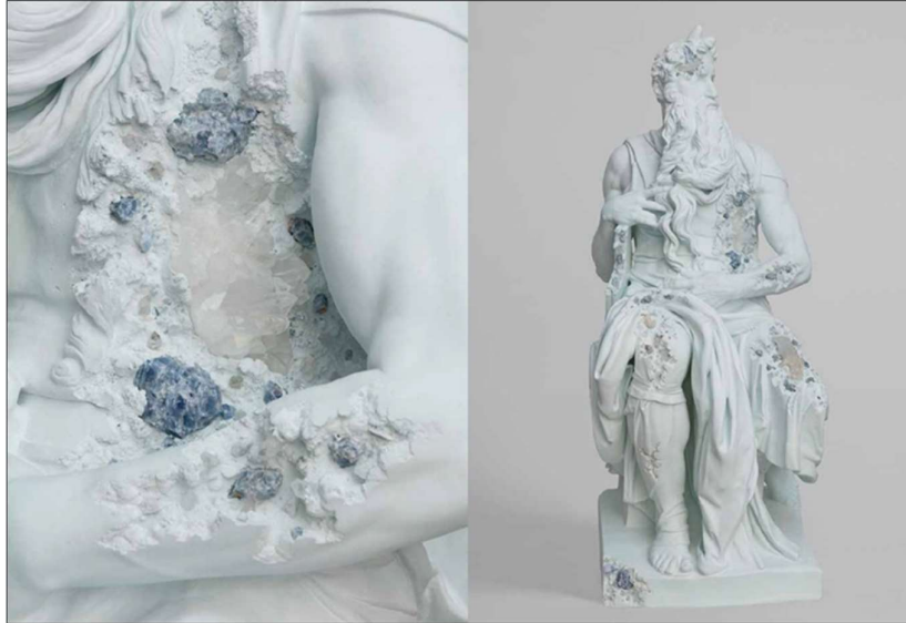
Görsel 6. Daniel Arsham, Blue Calcite Eroded Moses , 2019, mavi kalsit, kuvars, hidrostone, 258x117x121,5 cm (Arsham, 2019)

Daniel Arsham'ın biçimlendirme stiline çocukluğunda yaşadığı bazı olayların etkisi olmuştur. 1992 yılında Amerika'da yaşanan ve Arsham'ın yaşadığı bölgeyi de etkileyen Andrew kasırgasının yıkıcı etkisi sonucunda, sanatçı ve ailesinin evleri yıkılmıştır. Bir süre karavanda yaşayan sanatçı için bu süreç, inşa ve yıkım arasında sorgulamalar yaptığı içsel bir serüvene dönüşmüştür. Yapısöküm ve yeniden inşa olgularına aşinalığı ve yakınlaşması bu dönemde olmuştur.