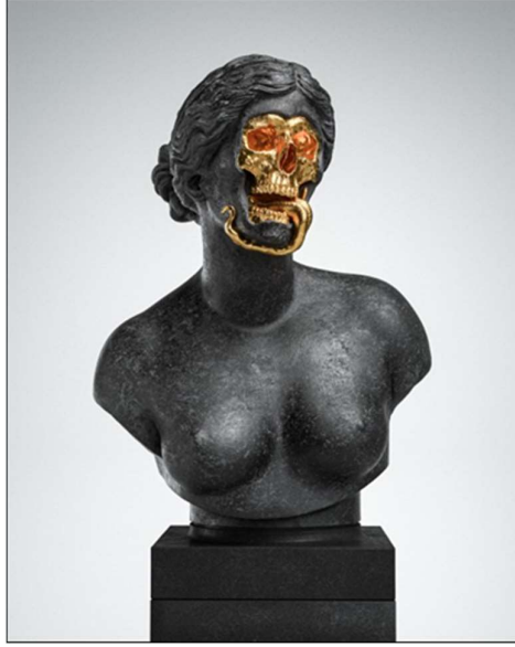
Görsel 4. Hedi Xandt, God Of The Grove , 2013, siyah bronz, 85x 55x 50 cm (Xandt, 2013)

Güncel heykel sanatçılarında Hedi Xandt dijital mecrada çalışmakta ve kütleleşmiş sanat karşıtı işler yapmaktadır. Figürlerinde manipülatif tavır hissedilmektedir. Antik Yunan'ın aşk tanrıçası Afrodit'i yorumlamıştır (Görsel 4). Afrodit'in temsil ettiği kavramların karşıtı olarak biçimlendirmiş, karanlık tarafına vurgu yapmıştır. Güzellik algısının ilizyonuna dikkat çekmektedir. Böylece biçimsel müdahaleyi kavramsal bir düzlemde yeniden yorumlamıştır.