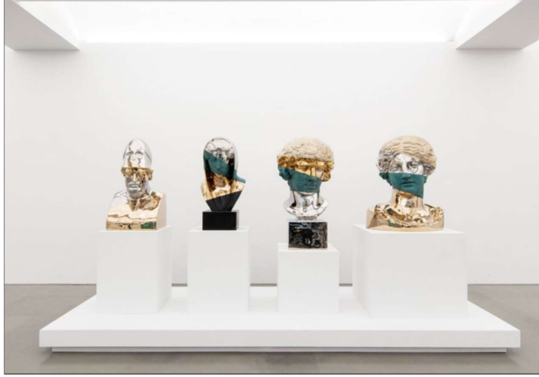
Görsel 11. Daniel Arsham, Veiled and Stratified Classical Antiquity , 2023, patine bronz, parlatılmıř bronz, paslanmaz elik ve ařřap (Arsham, 2023)

Daniel Arsham, Paris-Perrotin’de 2 Eylül – 7 Ekim 2023 tarihleri arası ve New York’ta 6 Eylül – 21 Ekim 2023 tarihleri arasında eř zamanlı olarak “20 YEARS” isimli sergileri aar. Bu sergilerde sanatı, geirdięi bütünü biimsel serüveni iřlerine yansıtmıřtır. Sergi onun sanat hayatı boyunca yaptıęı ya da yapmaya alıřtıęı her řeyi yoęun olarak vermektedir. Antik tanrıların ve mitolojik kahramanların büstlerini (Görsel 11) patine bronz, parlatılmıř bronz, paslanmaz elik ve ařřap gibi malzemelerle katmalar halinde yorumlamıřtır. Tarihin katmanlarına biimsel göndermeler mevcuttur. Buradaki kurgusallık malzeme odaklı bir yaklařımdır. Deęerli malzemelerle güzellik temsili antik formlar (Görsel 12-13) yorumlanarak ve yenilenerek, güncel sanat jargonuna tekrar kazandırılmıřtır. Biimsel pastiř örneęi olarak farklı bir yorumla tekrar karřımıza ıkmaktadır.