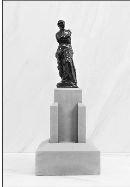
Görsel 5. Raphael Denis, La Vénus De Milo , 2023, alçı ve özel karışım, 20 x 7 x 6cm (Denis, 2023)

Güncel heykel sanatçılarında Hedi Xandt dijital mecrada çalışmakta ve kütleleşmiş sanat karşıtı işler yapmaktadır. Figürlerinde manipülatif tavır hissedilmektedir. Antik Yunan'ın aşk tanrıçası Afrodit'i yorumlamıştır (Görsel 4). Afrodit'in temsil ettiği kavramların karşıtı olarak biçimlendirmiş, karanlık tarafına vurgu yapmıştır. Güzellik algısının ilizyonuna dikkat çekmektedir. Böylece biçimsel müdahaleyi kavramsal bir düzlemde yeniden yorumlamıştır.