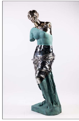
Görsel 12. Daniel Arsham, Stratified Venus of Arles , 2023, bronz ve paslanmaz elik, 200x 90.9x 72.8 cm (sol) (Arsham, 2023)