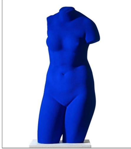
Görsel 1. Yves Klein, Venus Blue (La Vénus d'Alexandrie Vénus Bleue) , 1962, alçı ve mavi boya, 69 cm (Klein,1962)

Postmodernizmin imkânları dâhilinde şekillenen pastiş örneklerine bakıldığında Yves Klein'in Venus Bleue (Görsel 1) eserine değinmek gerekir. Bu eserde Klein antik yunan ideolojisinde estetik olarak mükemmelleştirilmiş kadın temsili venüsü, Klein mavisine boyayarak yorumlamıştır. Sanatçı kendi müdahalesini, formu kendince (ironik olarak) mükemmelleştirmek adına yapmıştır. Böylece güzellik temsiline en ikonik örneğini kullanarak pastiş içerikli ve bu müdahalelerle biçimsel olarak ironi yaratarak venüsü farklı bir alana taşımıştır.