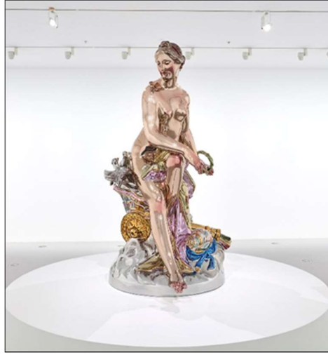
Görsel 3. Jeff Koons, Venus , 2016-2020, paslanmaz çelik, 254x 145,3x 157,3 cm (Koons, 2016-2020)

Fountain'ı isimli eserini sergiye gönderirken kendi adıyla imzalamaması sanatçı kimliğine karşı manipülatif bir tavır içermektedir. Bu tavır hazır nesneyi bağlamdan koparışında da görülmektedir. Sherrie Levine'in yorumladığı "Fountain (Buddha)" eserinde (Görsel 2) pastişin biçimsel olarak kullanıldığı söylemek mümkündür. Fakat burada orijinal eserin buluntuluğundan çıkılmış ve bronz dökülerek biçimsel olarak yeniden yorumlanmıştır. Levine izleyiciyi, fountain ile karşılaştığı şok edici ana geri götürmekte ve o duyguyu yeniden canlandırmaktadır. Aslında sanatçı, erkek egemen bir sanat camiasında erkeklere özgü bir imajı feminist yaklaşımla sorgulamakta ve fountain'ne yeni anlamlar yüklemektedir.