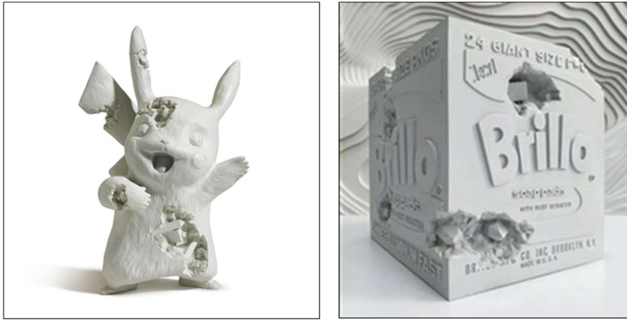
Görsel 7. Daniel Arsham, Blue Crystalized Pikachu , 2020, karıřık teknik, 22x15,5x35,5 cm (sol) (Arsham, 2020)

Günümüzde klasikleşen şekillendirme pratiklerinin dışında sanatçılar kendi geliřtirdięi, literatürde yer almayan yöntemleri, yeni bir ifade biçimi olarak kullanmaktadır (Tazeoęlu, 2023, s. 2143). Arsham da kendi şekillendirme ve biçimsel dilini bireysel ve yeni tekniklerle oluşturmuřtur. Arsham 11 Ocak - 21 Mart 2020 tarihlerinde Paris'teki Perrotin galerisinde “Paris 3020” sergisini açmıřtır. Bu sergide sanat tarihinde klasik dönem heykellerinin Paris'teki kopyalarına ulařmıř ve biçimsel olarak müdahale ederek yeniden yorumlamıřtır. Bu yorumların temelinde kurgusal arkeolojik temalar yer almaktadır. Biçim dilinde kristalizasyon etkisini çalıřmıřtır. Mulajlardan alınan kalıpların içine kuvars, volkanik kül ve selenit gibi malzemeler koyarak biçimsel müdahalelerde bulunmuřtur. Bu sergide kullanılan mulajlar sanat tarihinin en ikonik örnekleri olarak özellikle seçilmiřtir (Görsel 6). Böylece eserlerin kendi döneminin popüler imajlarını ironik baęlamda güncelleyerek yenilemiřtir. Bu baęlamda biçimsel olarak pastiři kullanarak yeni bir dile ulařtıęını düşünmek mümkündür.