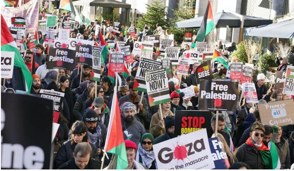
Şekil 2: BBC NEWS -Londra'da ateşkes çağrısı yürüyüşü

Hakikatin ortaya çıkmasıyla dünyadaki protestolar artmıştır. Avrupa ülkelerinin devlet açıklamaları ile halkının sergilediği davranışlar arasında fark oluşmuştur. Kalıcı ateşkes için yürüyen birçok insan bu savaşın dil, din, ırk fark etmeden birlik içerisinde olarak Gazze'ye destek vermişlerdir. Post-truth makinesini kullanarak insanların algılarını yöneten medya artık hakikatin ortaya çıkmasıyla toplumu durduramamaktadır. Avrupa halkının bu kadar tepki göstermesi ile post-truth makinesini tersine çevirmek durumunda kalmışlardır. Bu durum şimdilik böyle istenmiştir fakat bir başka gelecekte post truth tek başına hüküm sürebilir ve hakikate asla ulaşamayabilir. Bölgeden çekilmeyen onlarca muhabirini kaybeden Al Jazeera televizyonu hakikatin ulaşmasında en büyük aktör olmuştur.