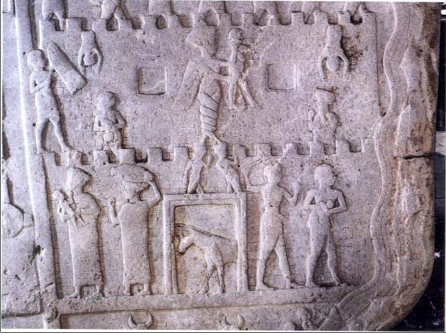
Fig. 3: Harput Kabartması üzerindeki yılanlı tanrıça (Demir vd. 2016, Res.7).