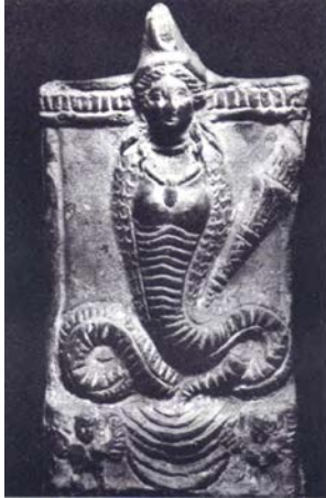
Fig. 7: İsis-Thermutis (Renenutet) kabartması, Ptolemaioslar dönemi, CG26925 (Tiradritti 1998, Fig. 7).