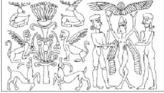
Fig. 6: Mitanni mühür baskısının çizimi (Frankfort, 1970, Fig.287).