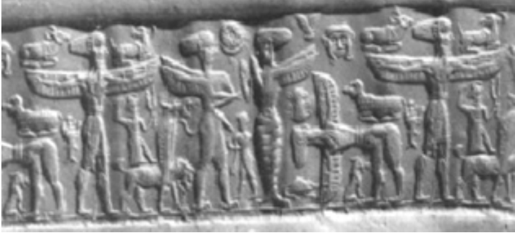
Fig. 5: Eski Babil dönemine ait silindir mühür baskısı, BM 134773 (Buchanan 1971, Lev. Ie).