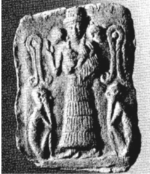
Fig. 2: Doğum tanrıçası Nintu, Irak Müzesi, Bağdat (Frankfort 1970, Fig.120).