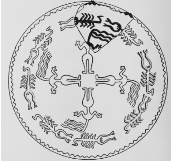
Fig. 1: Mezopotamya'da Samarra kültürüne ait derin çanak içerisinde yılan saçlı kadın tasviri (Goff 1963, Fig.33).