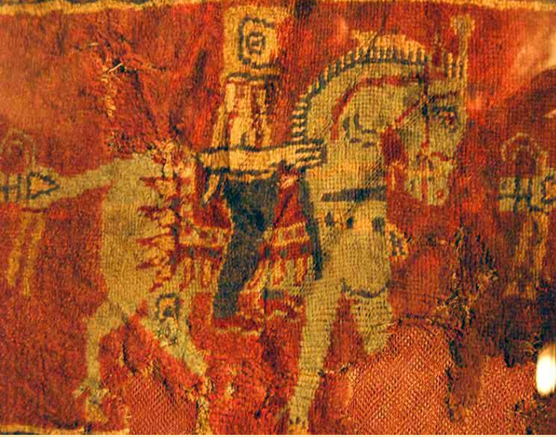
Fotoğraf 4: Pazırık Halısı atlı deseni (St. Petersburg Hermitage Müzesi)

Halının en geniş bordüründe ise 28 adet at ve insan figürleri görülür (Fotoğraf 4). Pazırık halısında kullanılan renkler zeminde koyu kırmızı olmak üzere koyu kahverengi, sarı, lacivert, açık mavi ve krem renkleri kullanılmıştır.