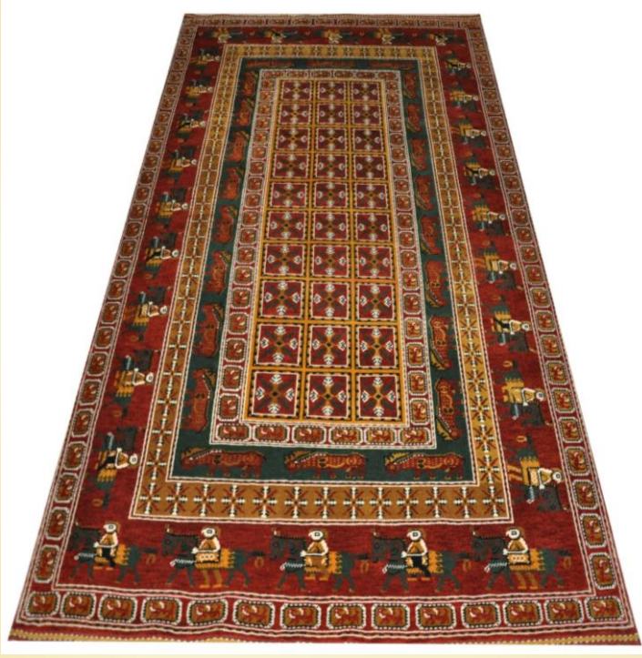
Fotoğraf 7. XXI y.y. Gördes halısı