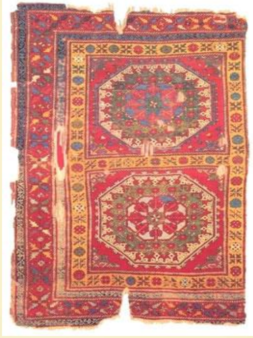
Fotoğraf 6. XVI y.y. sonu, Bergama stili, büyük ve küçük sekizgen halı, Şeyh Baba Yusuf cami, Sivrihisar, Eskişehir, (Türk ve İslam Eserleri Müzesi)

XVI ve XVII y.y.'da halıcılığımız ikinci bir parlak dönem yaşamıştır (Fotoğraf 6). Bu devirde saray ve camilerin ihtiyacını karşılamak için çok miktarda halı dokunmuş ve desenlerde Osmanlı mimari sanatının izleri görülmeye başlanmıştır.