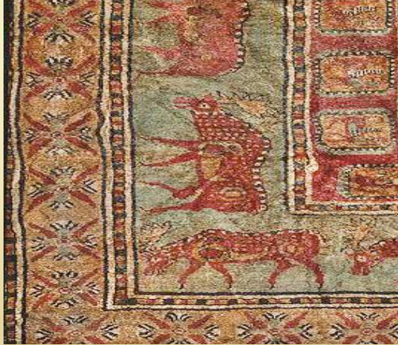
Fotoğraf 3: Pazırık Halısı kenar hayvan desenleri (St. Petersburg Hermitage Müzesi)