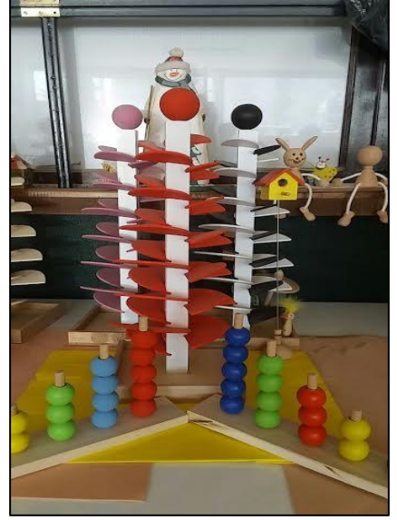
8- Ahşap oyuncaklar