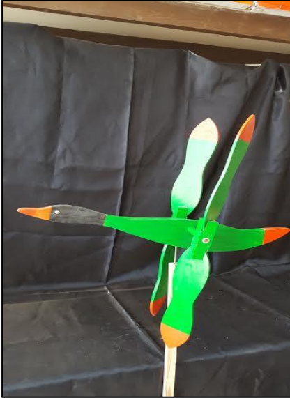
9-Ahşap hareketli oyuncak