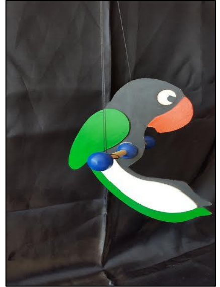
10-Ahşap hareketli oyuncak