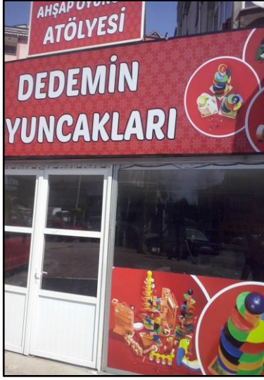
1-Dedemin Oyuncak Atölyesi