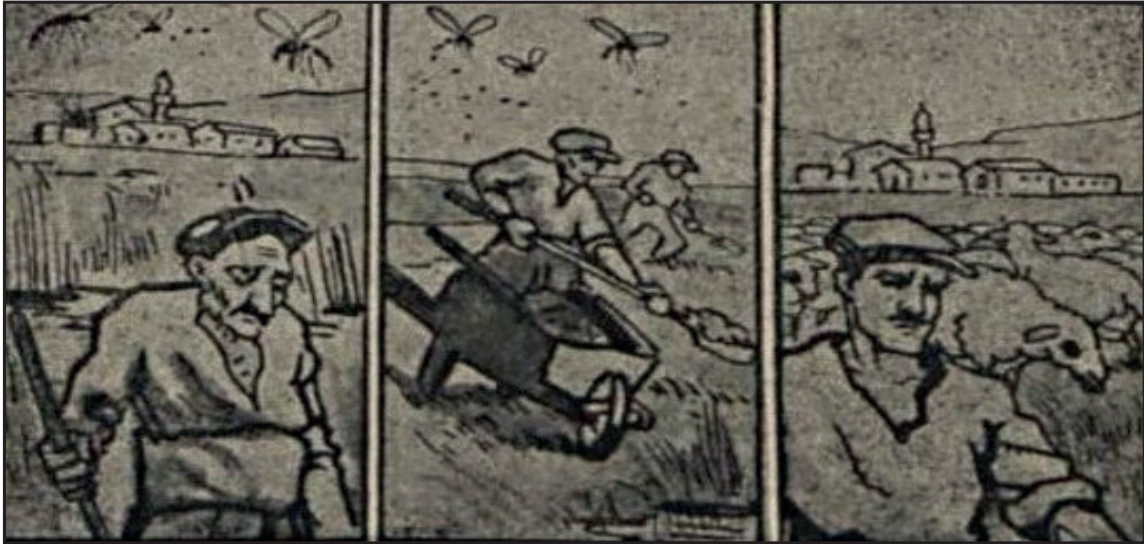
Sıtmalı Köy ve Köylü

taş kaldırımıyla, tarlalarını arklarla döşemek, çamaşırılık, hamam, pazar yerleri yapmak, ortaklaşa şekilde köye pulluk, harman makineleri almak, ormanlık alan oluşturmak, kimsesiz oğlan çocuklarını sünnet ettirmek, kimsesiz kızları evlendirmek, köy oyunlarını öğrenmek gibi etkinliklere kendi isteğiyle katılıp katılmama hakkı vardır. 40 Sıtmayı önlemek için sıtma yapan sivrisineklerin barındığı su birikintilerini kurutmak, temiz içme suyu getirmek, çeşme yapmak köyü temiz tutmak, köyün ortasında bir meydan açmak, köye yol, okul, mescit, köy ve misafir odası yapmak, meydana ve mezarlığa ağaç dikmek ise köylünün yapmaya mecbur olduğu yükümlülükler olarak verilmiştir. 41 Böylelikle öğrenciler Yurt Bilgisi dersinde ülkenin yönetim birimleri içerisinde yer alan muhtar ve ihtiyar meclisi kavramları konusunda bilgilendirilmiştir. Ayrıca muhtarın devletin ve köylünün resmî temsilcisi olduğuna dikkat çekilirken, dayanışmanın gereğine ve önemine vurgu yapılmıştır.