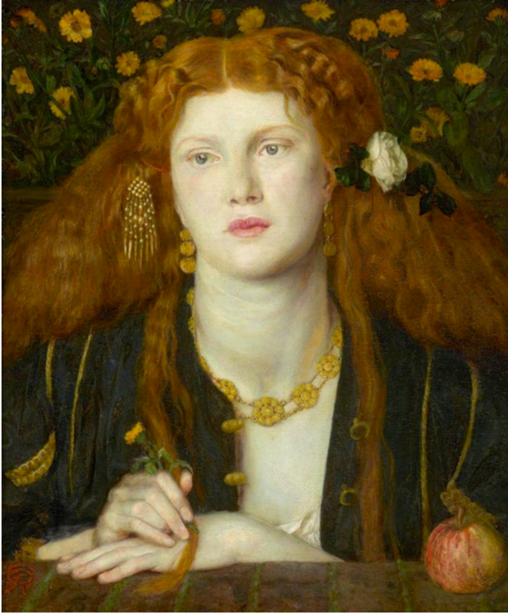
Rossetti, Bocca Baciato

Bocca Baciato, İngilizce karşılığında öpülmüş dudak anlamına gelmektedir. Resimdeki model Rossetti'nin sevgilisi Fanny Cornforth'dur. Kederli ve acı çeken yüzü ve masum duruşu ile dikkati üzerinde toplayan kadın aynı zamanda şehvet dolu bir görünüşe sahiptir.