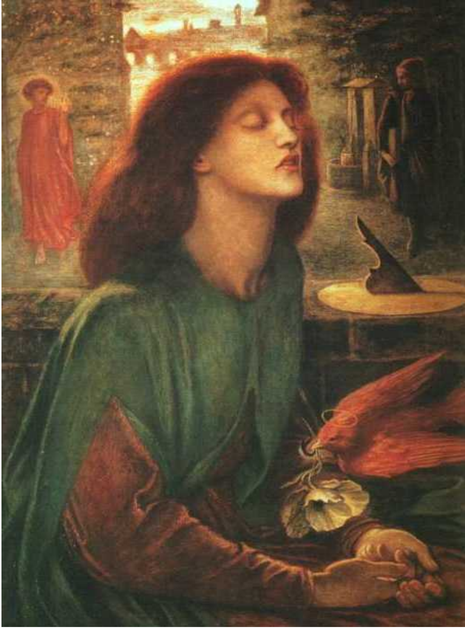
Rosetti, Beata Beatrix (1864-1870)