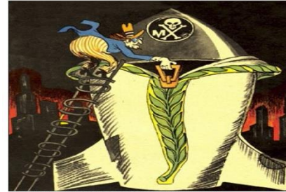
Resim.3. Barış Giysisi Arkasında. V.Tatarinsev (“Kirpi”1983, №2).