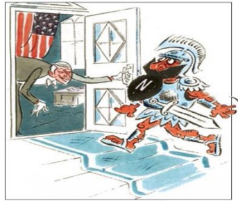
Resim.2. Beyaz Sarayın Sevimli Misafiri. A.Anisimov (“Kirpi”, 1982).