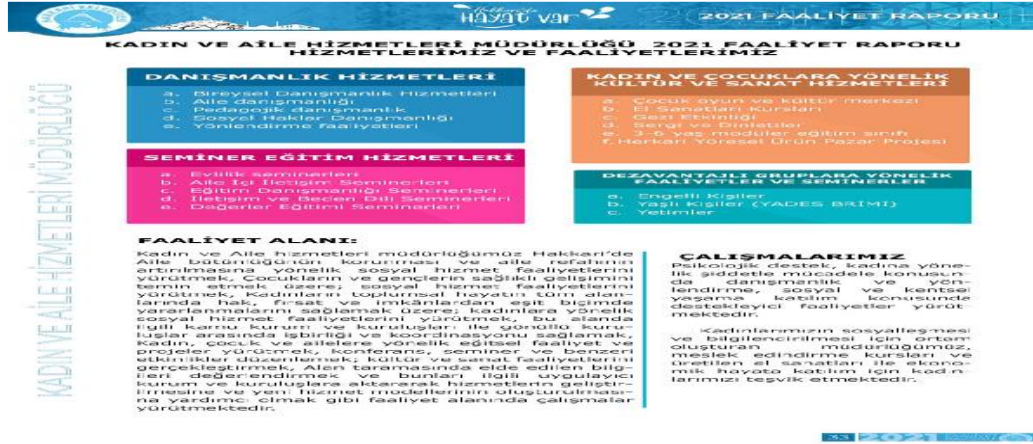
Resim 2. Hakkari Belediyesi Engelli Hizmetleri

Merkezi ve Akşam Sanat Okulu ile iş birliği içinde dezavantajlılar için eğitim programları düzenlendiği anlaşılmıştır (Hakkâri Belediyesi, t.y.: 33-34).