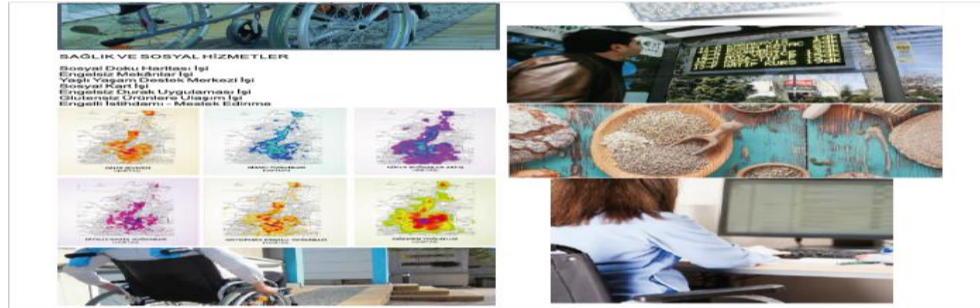
Resim 5. Konya Büyükşehir Belediyesi Engelli Hizmetleri Stratejik Öncelikleri

Plan vatandaş analizinde talepler arasında, “engelli vatandaşların engelsiz hayatları için yardım edilmesi” başlığı yer almaktadır (Konya Büyükşehir Belediyesi, t.y.: 63). Kamu Kurum ve Kuruluşları, Üniversiteler, STK, Dernek, Vakıfların Görüşleri’nin verildiği bölümde, hiçbir kuruluşun “engellilik” sorununa dair talep ya da yorumu bulunamamıştır (Konya Büyükşehir Belediyesi, t.y.: 65-68). Seydişehir İlçe Belediye Başkanlığı ise “Şehir içi ve köy otobüs seferlerinin iyileştirilmesi talebini (65 yaş üstü ve engelliler adına)” istemiştir (Konya Büyükşehir Belediyesi, t.y.: 69).