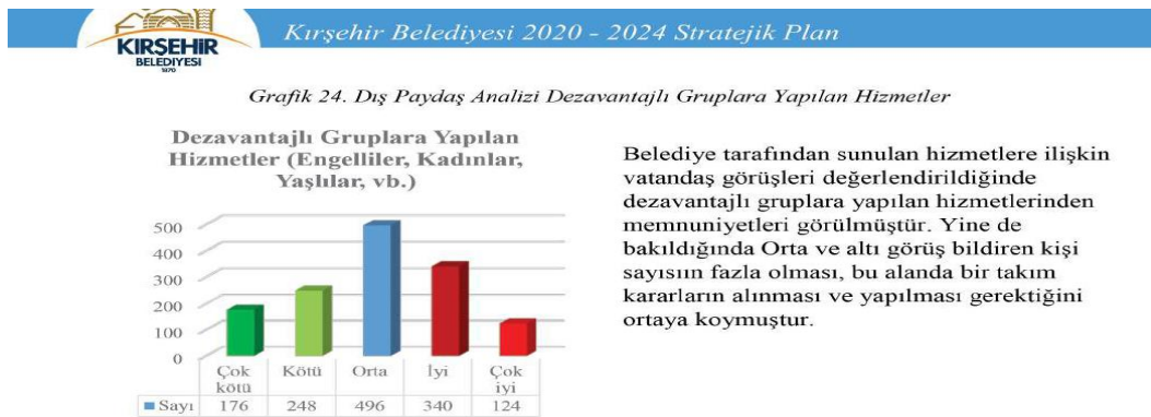
Resim 3. Kırşehir Belediyesi Dezavantajlı Grupların Planda Gösterimi

Kırşehir Belediye Başkanlığı Stratejik Planında engelliler konusu, “Dezavantajlı gruplar” arasında sayılmış, ancak bu grupta yaşlılar ve kadınlar gibi çok geniş bir kesim de dezavantajlı kabul edildiğinden somut bir ayırım yapmak mümkün olamamıştır. Bir bütün olarak “Dezavantajlı Gruplar” konusu ise “Dış Paydaş Analizi”nde ağırlıklı olarak “orta ve altı” olarak değerlendirildiğinden etkin bir hizmet yürütümü yansıtlamadığı görülmüştür (Kırşehir Belediyesi, t.y.: 94).