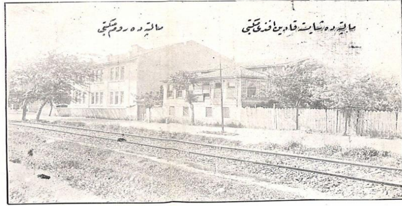
Resim 5. Maltepe Rum Mektebi ve Şayeste Kadınefendi Mektebi