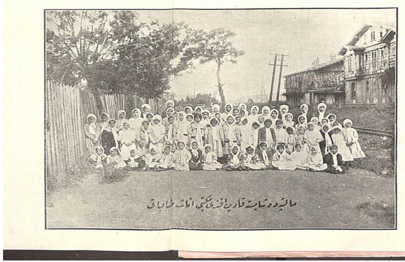
Resim 3. Maltepe Şayeste Kadınefendi İnas (kız) Talebeleri

Erkek öğrenci kısmı: (Süreyya Paşa: 10-11)