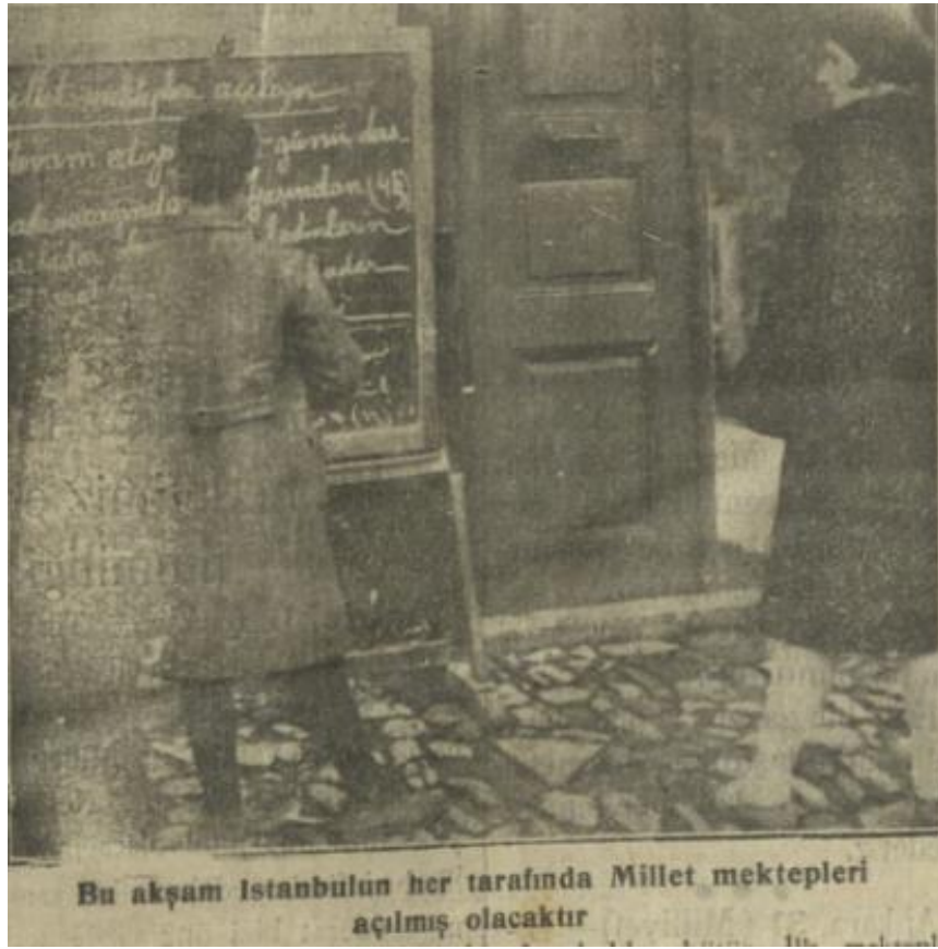
Bu akşam İstanbulun her tarafında Millet mektepleri açılmış olacaktır