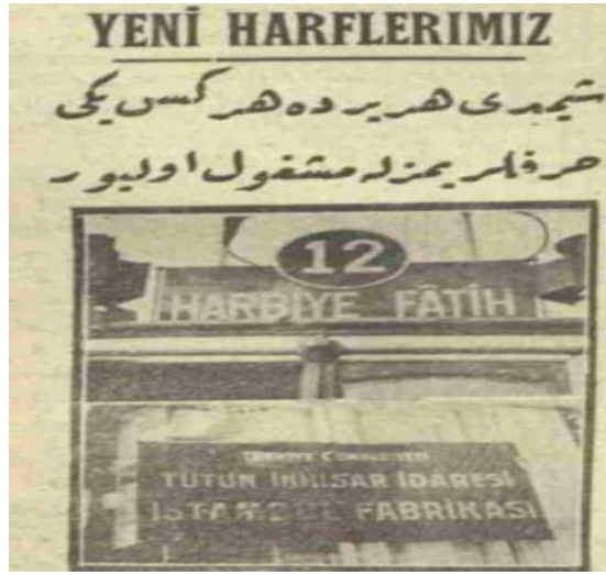
Cumhuriyet, 31 Ağustos 1928

Milliyet gazetesi de benzer bir yazıyı yayımlamıştır: “Bugünden itibaren bu sahife Millet Mekteplerine devam edenler için bir tatbikat sahifesi olabilecektir. Bugün Millet Mekteplerinin açıldığı gündür. Herkes bugünden itibaren ana dilini öz şekli ve temiz ruhiyle öğrenmeye candan koşacaktır...” 29