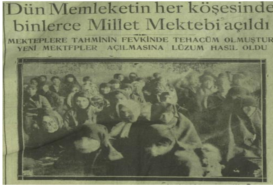
Hâkimiyet-i Milliye, 2 Kânunusani 1929

Ankara Millet Mektebine de kadınların ve erkeklerin devam ettiği çok sayıda dersane açılmıştır. Ankara'nın merkezinde ve şehrin sınırları içinde açılan dersanelere devam eden kadın sayısı dokuz bin iki yüz yetmiş dört, erkek sayısı da yedi bin dokuz yüz kırk sekiz olarak verilmiştir. Ankara genelinde açılan dersane ve o dersanelerde görevli muallim sayısı üç yüz dokuz olarak tespit edilmiştir. 41 Mardin'de otuz, Siirt'te yirmi yedi Millet Mektebi açılırken Bitlis'te de çok sayıda Millet Mektebi açılmıştır. 42 7 Kânunusani 1929'da yayımlanan Hâkimiyeti Milliye gazetesinin haberine göre Isparta'da üç yüz beş, Gümüşhane'de seksen beş, Bolu'da dört yüz, Kayseri'de iki yüz elli dört, Eskişehir'de de yüz otuz yedi Millet Mektebi açılmıştır. 43 Bu mekteplerin sayısı, sonraki günlerde artarak devam etmiştir. Millet Mekteplerinin ilk yılında 1.000.000'dan fazla kişinin kayıt yaptırdığı ve bunların yaklaşık 600.000'inin mezun olduğu ifade edilmiştir. 44 Zaman geçtikçe halkın ilgisi azalmıştır. Bu durumun pek çok sebebi olduğu düşünülmektedir. İlk sebebin Mustafa Necati Bey'in aniden ölmesi, ikinci sebebin de dünya ekonomik krizinin Türkiye'deki etkisi olduğu düşüncesidir. Ayrıca bazı yöneticilerin olumsuz tavırları da başvuruların ve ilginin azalmasında etkili olan sebepler arasında gösterilmiştir. 45