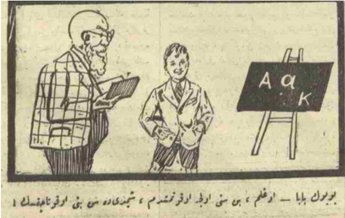
Cumhuriyet, 2 Ağustos 1928

Harf Devrimi'ne destek veren gazetelerden bazıları Akşam, Cumhuriyet, Hâkimiyet-i Milliye, Milliyet ve Vakit'tir. Harf Devrimine ve Millet Mekteplerinin açılışına yönelik yazıları ve karikatürleri ile devrimi topluma kabul ettirmek yolunda önemli adımlar atmışlardır. Özellikle 1928 yılının ikinci yarısında yayınlanan gazetelerde bu yönde örneklere rastlamak mümkündür. Yeni Türk harflerinin öğrenilmesi ve öğretilmesi çabası başlamış 22 hem basın hem resmi kurumlar bu konu ile ilgili yoğun bir gayret göstermiştir. Resmi kurumlar kendi personellerinin yeni Türk harflerini öğrenmesini sağlamış 23 ve topluma örnek olmuştur. Jandarmalar 24 ve diğer devlet memurları yeni Türk harflerini öğrenmeye çalışırken İstanbul Millet Mekteplerinde görev yapmak isteyen öğretmenler de dilekçe ile İstanbul Maarif Müdürlüğü'ne başvurmuştur. 25 Ayrıca tevkifhanelerde de kurslar açılmış, tutukluların yeni Türk harflerini öğrenmeleri sağlanmak istenmiştir. 26