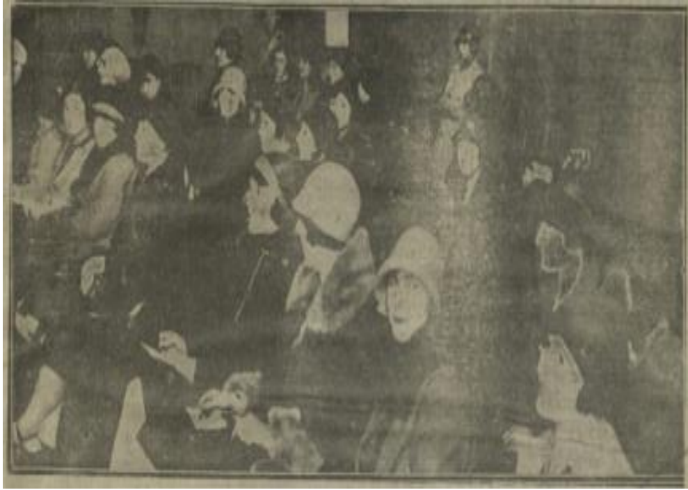
Milliyet, 2 Kânunusani 1929 (Galatasaray Millet Mektebi)

Kadınlara olduğu gibi erkeklere de dersanelere devam etme mecburiyeti getirilmiştir. Millet Mekteplerine kayıt yaptırmamış olanlardan veya kayıt yaptırıp derslere devam etmeyen öğrencilerden beş liradan altmış liraya kadar nakdî ceza alınmasına karar verilmiştir. Böylece derslere devam edecek öğrencilerin keyfi hareket etmelerinin önüne geçilmiştir. 64 18 Şubat 1929 tarihli Cumhuriyet gazetesi haberine göre Millet Mekteplerine kayıt yaptırıp da devam etmeyenler hakkında “evamiri Hükûmete âdemi riayet noktasından” tahkikat başlatılmış, devam etmeyenlerin isimleri polis merkezlerine bildirilmiştir. 65