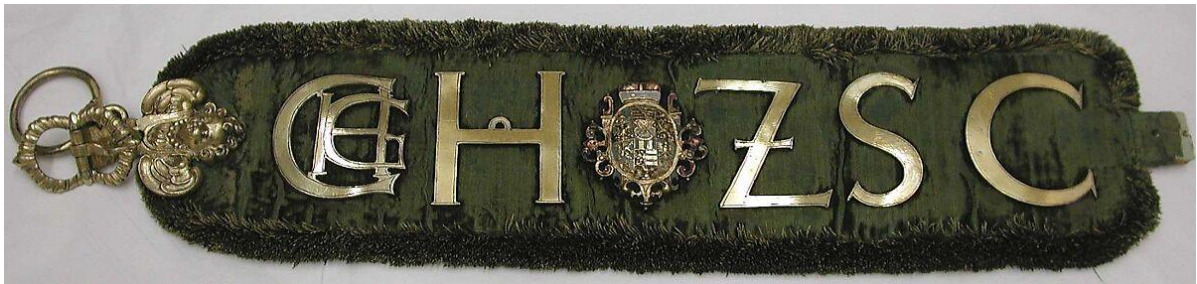
Görsel 6. Av Köpeği Tasması (1607-1611).