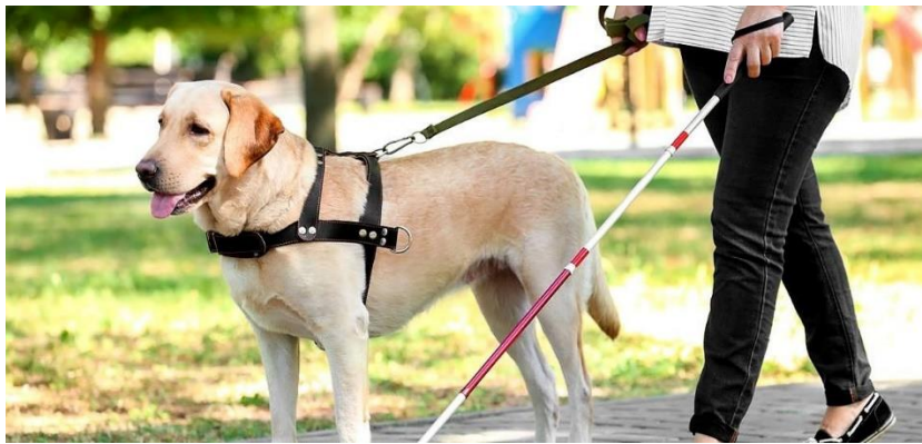
Görsel 2 Rehber Köpekler.

Eski Yunan medeniyetinde insan sağlığına iyi geleceği düşünülerek hekimler tarafından yaraların köpeklere yalıtılmak suretiyle iyileşeceğine inanılmaktadır (Gökkaya 2019: 12). Bu örnek bizlere insanların sağlık için de hayvan odaklı tedavi biçimleri aradığını ve uyguladığını göstermektedir. Günümüz koşullarında psikolojik destek amaçlı evcil hayvanların insan sağlığına iyi geldiği yönünde araştırmalar söz konusudur. Rehabilitasyon hemşireliği tarafından yürütülen hayvan destekli tedavi uygulamaları hasta bakımını kolaylaştırmakta ve olumlu yönde etkilemektedir. Temelinde, insan ve hayvan etkileşiminin sağladığı biyolojik ve fiziksel değişimlerle açığa çıkan psikosomatik etkilere dayanmaktadır. Hayvan beslemek ve birlikte olmak mental, sosyal ve fiziksel sağlığın tedavisinde önemli bir rol oynamaktadır (İncazlı, Özer, Yıldırım 2016: 88). Görme engelli bireylere refakatçi olmak için özel eğitim verilen rehber köpekler onların günlük yaşam kaliteleri yükseltmektedir.