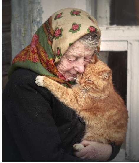
Görsel 1. Hayvan sevgisi.

İnsan ve hayvan birlikteliğinin en samimi göstergesi, evcilleştirme iç güdüsüyle insanların hayvanlara yaklaşması ve onları benimsemeleri olmuştur. Evcil hayvan sahipleri, sahip oldukları hayvanların sağlığından, barınmasına, yiyeceğine ve aksesuarlara karşılık beklemeden yüksek miktarda para, zaman ve enerji harcıyorlar. İnsan ve hayvan arasındaki şefkat ve sevgi bağı kalp hastalığı gibi ciddi bir hastalıkta bile sağlığımız üzerinde büyük bir etkiye sahip olabileceğini göstermiştir (O’Haire 2010: 226-227).