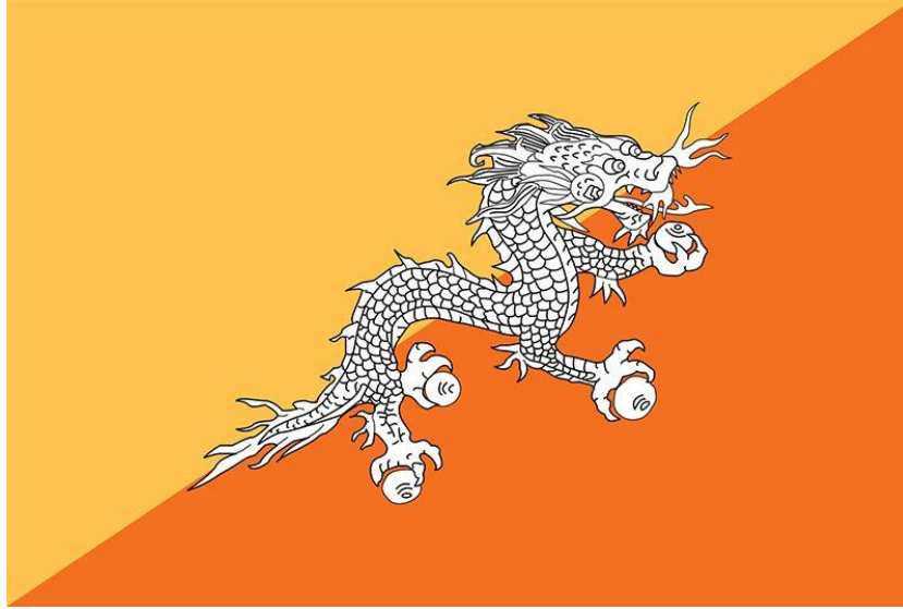
Görsel 4. Bhutan Bayrağı.

İnsan yaşamında önemini ilk günkü gibi taşıyan kültür olgusu, gelenek ve göreneklerini yansıtmaya aracı olarak hayvanları da kullanmıştır. Bu bağlamda dünyada yer alan bazı ülkelerin bayrakları üzerinde ülkeyi temsil eden sembollerde hayali hayvan figürleri kullanılmaktadır. Bayraklar üzerinde oluşturulan sembolere yüklenen anlamlar içerisinde ulusun birliğini, bütünlüğünü korumaya ve aynı zamanda dış ülkelere karşı etkin mesajlar verilmeye çalışılmaktadır. Bu doğrultuda örnek olarak gösterebileceğimiz Bhutan bayrağı üzerinde dört ayağında elma taşıyan ejderha figürü yer almaktadır. Bhutan Devleti'nin ana dilinde "Gök Gürültüsü Ejderhanın Ülkesi" olarak anılması nedeniyle geleneksel olarak dağlardan ve vadilerden gelen gök gürültüsünün sesini ejderha sesi olarak inanmasına dayanmaktadır. Bayrak üzerinde yer alan ejderha pençeleri arasında tuttuğu elmaların ulusun zenginliğini ve mükemmelliğini temsil ettiğini ve beyaz ejderha ülke içerisindeki farklı etnik yapıların saflığını ve ülkeye olan sadakatini simgelemektedir (URL3).