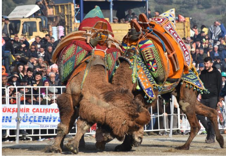
Görsel 5. Deve Güreşi.