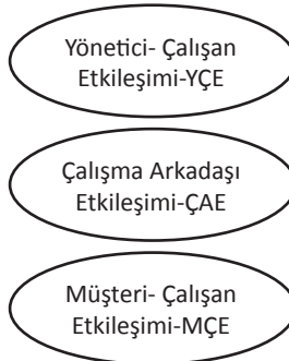
Şekil 2. Otel İşletmeleri Bağlamında Sosyal Değişim Teorisinin Boyutları