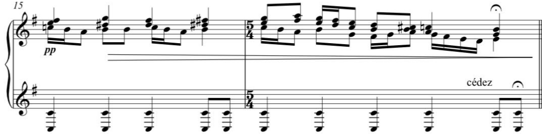
Görsel 4. Cemal Reşit Rey, 1926, Ayın Ondördü, Piyano Partisi, 12-13.ölçüler.

Yukarıda yer alan Görsel 3'te, ikinci dönüşte yer alan şan partisinin sona ermesiyle solo olarak devam eden piyano partisi görülmektedir. Ana melodi, 5/4'lük olan 9.ölçünün dördüncü vuruşunda başlar. Görsel 3'te de görüldüğü üzere 5/4'lük ölçü birimi sonraki ölçüde 2/4'lük ve ardından 4/4'lük olmaktadır. Sağ eldeki soprano partisinde "do" notasından başlayan tema, aynı partide iki ölçü boyunca devam eder. Sol eldeki ritmik yapı sağ eldeki temayla beraber ilerlemektedir. Sol elde, sağ elin üzerinden atlanarak çalınan çarpımalı "mi" notaları gelmektedir. Mi Minör tonunda olan eseri bitişe götüren bu pasajlarda, dört sesli polifonik yapı açıkça belli olmaktadır.