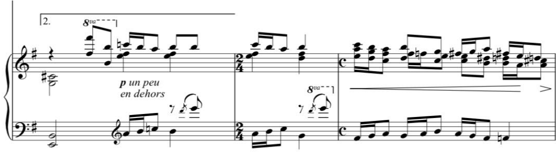
Görsel 3. Cemal Reşit Rey, 1926, Ayın Ondördü, Piyano Partisi, İkinci Dönüşe Göre 9-11.ölçüler.

Yukarıda yer alan Görsel 3'te, ikinci dönüşte yer alan şan partisinin sona ermesiyle solo olarak devam eden piyano partisi görülmektedir. Ana melodi, 5/4'lük olan 9.ölçünün dördüncü vuruşunda başlar. Görsel 3'te de görüldüğü üzere 5/4'lük ölçü birimi sonraki ölçüde 2/4'lük ve ardından 4/4'lük olmaktadır. Sağ eldeki soprano partisinde "do" notasından başlayan tema, aynı partide iki ölçü boyunca devam eder. Sol eldeki ritmik yapı sağ eldeki temayla beraber ilerlemektedir. Sol elde, sağ elin üzerinden atlanarak çalınan çarpımalı "mi" notaları gelmektedir. Mi Minör tonunda olan eseri bitişe götüren bu pasajlarda, dört sesli polifonik yapı açıkça belli olmaktadır.