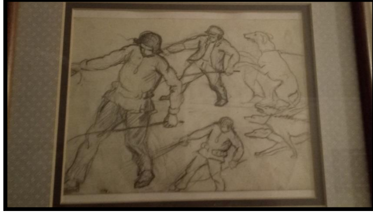
Şekil 2.4. Ekber Kazım Muğan, ismi bilinmiyor, karakalem resim defteri, Aile Koleksiyonu