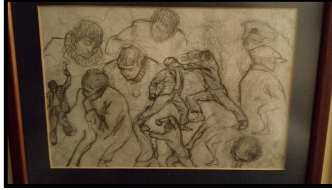
Şekil 2.2 Ekber Kazım Muğan, ismi bilinmiyor, karakalem serbest çalışma, Aile Koleksiyonu

Çalışmanın sonunda, Ekber Kazım Muğan'ın elimizde bulunan fotoğrafını, resim defterinden olduğu düşünülen, oğlu Nazım Muğan'ın çantasında bulunan karakalem çalışmalarını ve Kazım Muğan'a ait elimizde bulunan bir diğer portre çalışmasını birlikte veriyoruz. İbrahim Safi'nin eserleri elimizde olmadığı için, onlara burada yer veremedik.