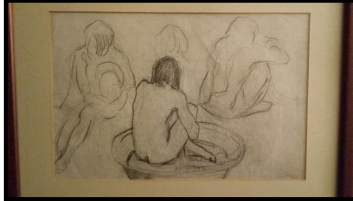
Şekil 2.3 Ekber Kazım Muğan, ismi bilinmiyor, karakalem serbest çalışma, Aile Koleksiyonu